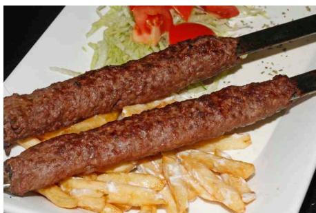
Pincho de Ternera Carne picada (2 Espadas)