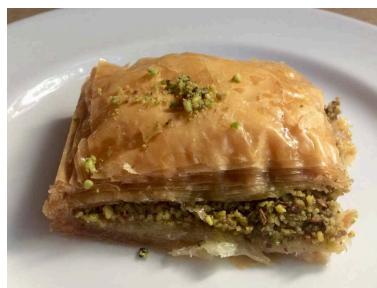
BAKLAVA 2€/unidad Dulce Griego