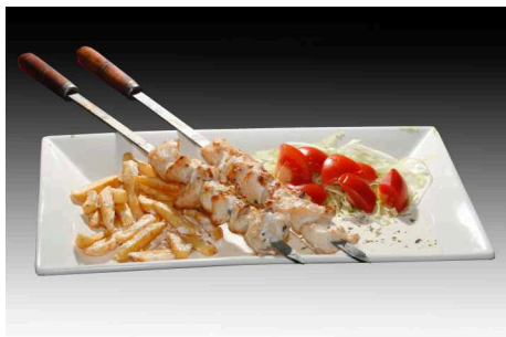
Pincho de Pollo (2 Espadas)