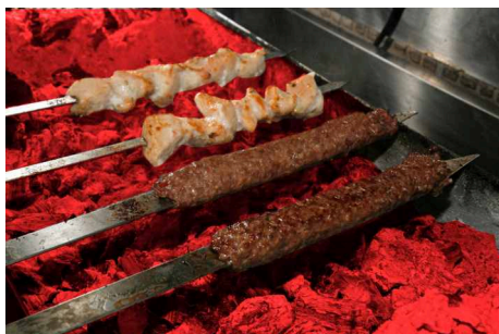
Degustación 3 Espadas surtidas