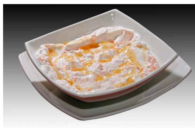
YOGURT GRIEGO 7€ con Zanahoria y Miel