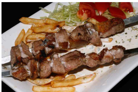
Pincho de Cordero (2 Espadas)