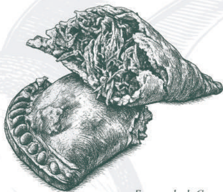
Empanada de Carne