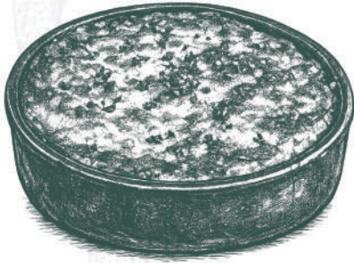
Pastel de Choclo Vegano