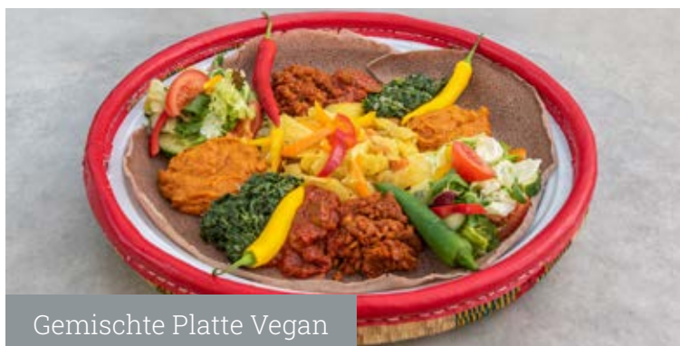
Gemischte Platte Vegan