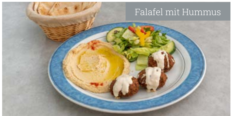
Falafel mit Hummus