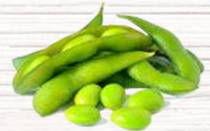
⑫ Edamame Vainas de soja salteadas 2,50€