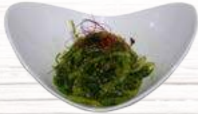
① Ensalada de Wakame Ensalada de Algas con agar-agar y sésamo 3,80€