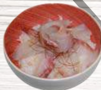
30 Dorada 7,50€

Finas lonchas de sashimi sobre arroz avinagrado