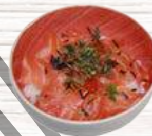
32 Salmón 7,80€