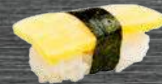
46 Tamago 3,50€