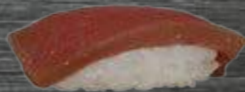
38 Atún 3€