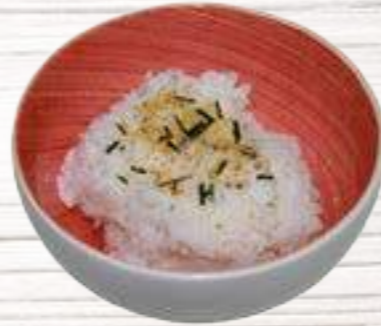
③ Bol de arroz 1,50 €