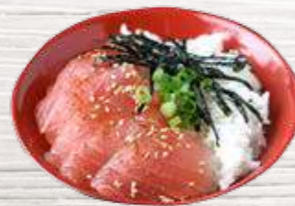
31 Atún 7,75€