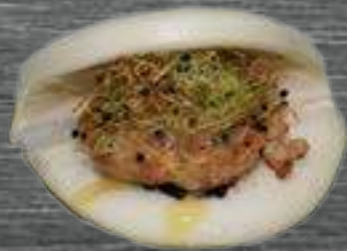
15 Gamba Gamba con mayonesa cítrica 2,80€