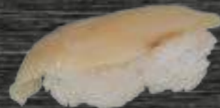
40 Pez Mantequilla 3,50€