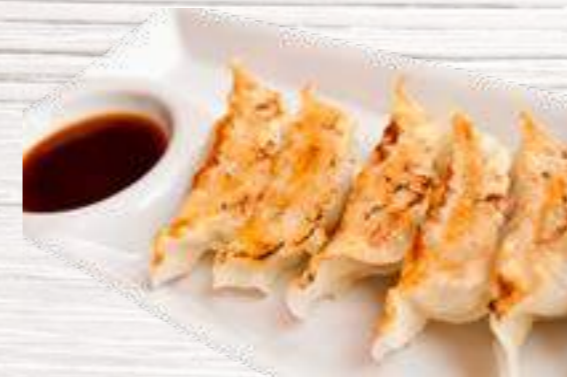
Gyoza Carne o verdura ⑩ Empanadillas rellenas de cerdo. 4u. ⑪ Empanadillas rellenas de verdura. 4u. 3,50€