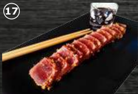
17 Atún Atún con salsa yakimiku, sésamo y sal maldon 9€