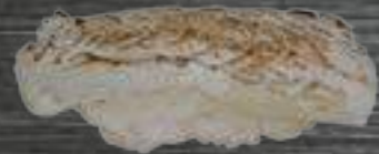
36 Dorada 3,50€

Lonchas de pescado crudo sobre arroz avinagrado - 2u.