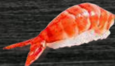
43 Langostino 3,50€