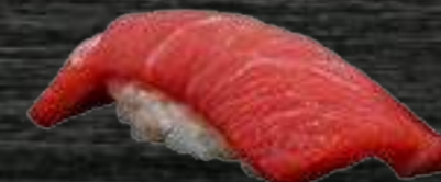
52 Ventresca Atún Rojo 5€