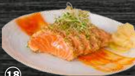
18 Salmón Salmón con salsa yakimiku, sésamo y sal maldon 9€