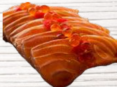
26 Salmón 6,50€