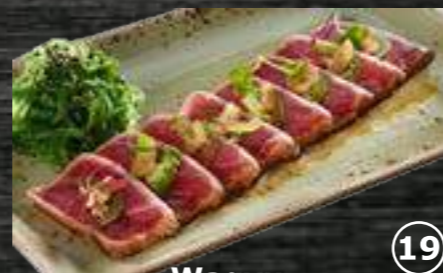
19 Wagyu Wagyu con salsa yakimiku, sésamo y sal maldon 9€