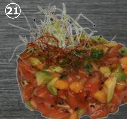
21 Salmón Salmón, aguacate, cebollino y mayonesa japonesa 8,60€