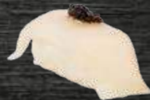
41 Pez Mantequilla y trufa 4€