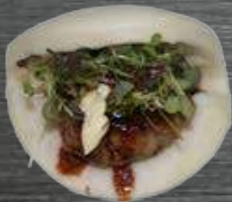
14 Wagyu Ternera Wagyu con cebolla caramelizada, salsa tokatsu y mayonesa japonesa 3,50€