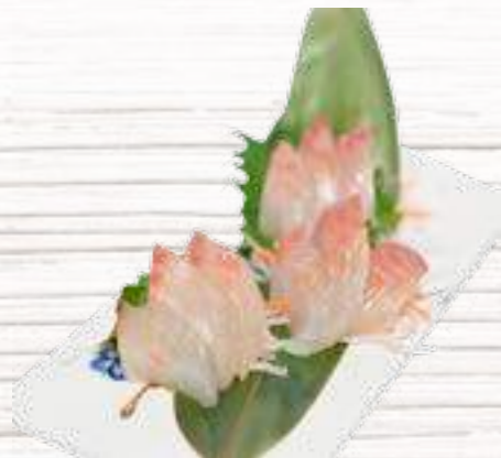
24 Dorada 4,80€