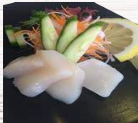
27 Pez Mantequilla 6,30€