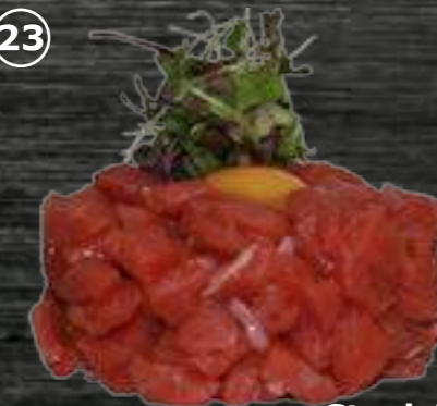
23 Steak Tartar Con carne de Wagyu con yema de huevo de codorniz 9,00€