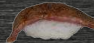
49 Wagyu 5€