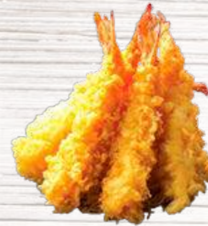
④ Langostinos en tempura. 5u 5€