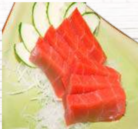
25 Atún 6,30€