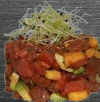
20 Atún Atún, aguacate, mango y tobiko 8,50€