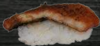
42 Anguila 3,50€