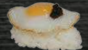
53 Huevo codorniz y trufa 3,50€