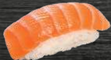
39 Salmón 3,50€