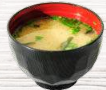
⑬ Sopa de Miso 3€