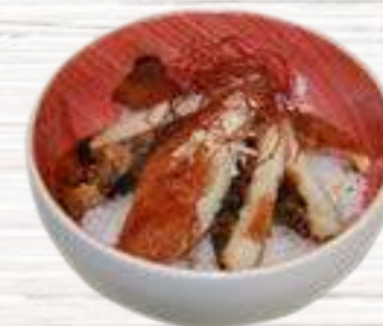
35 Anguila 8,20€