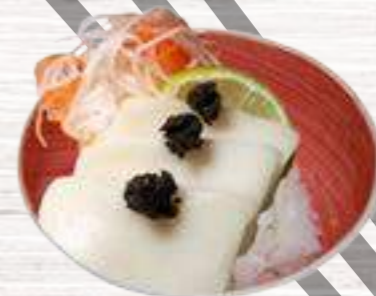
33 Pez Mantequilla 7,60€