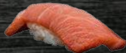
44 Ventresca 6€