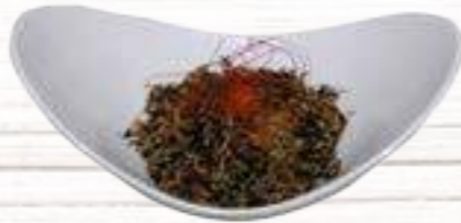
② Ensalada de Hijiki Ensalada de Algas con quínoa y sésamo 4,50€