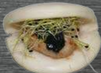
16 Sepia Sepia con mayonesa negra 2,80€