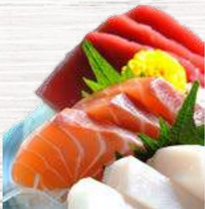
28 Moriwase - 10u. 8,60€