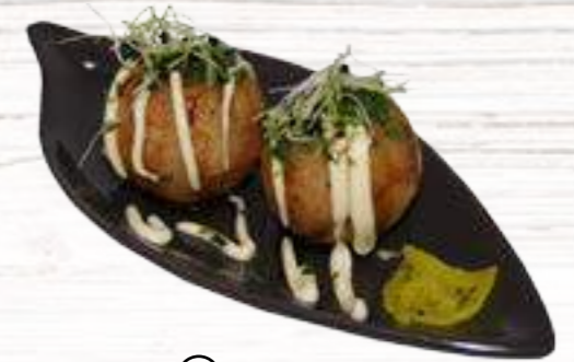
⑤ Takoyaki Buñuelos rellenos de pulpo – 6u. 6€