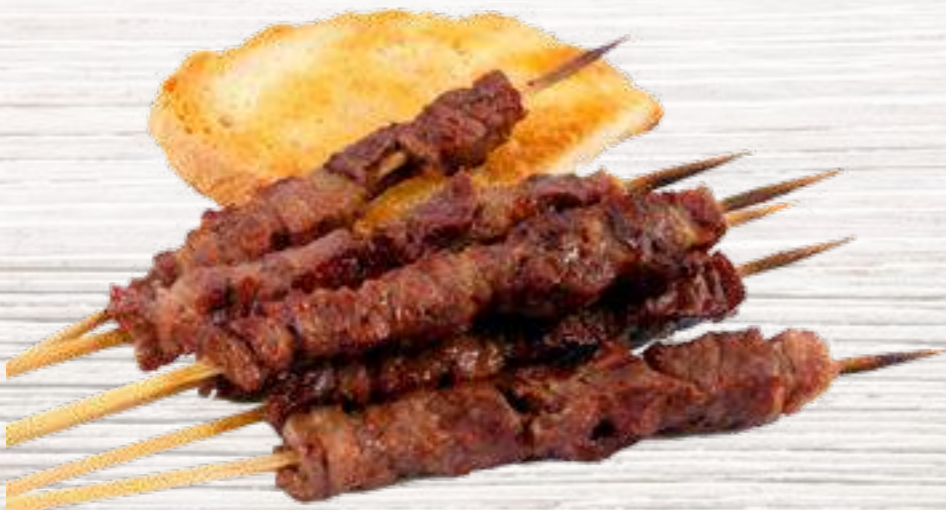
⑥ Pollo Brochetas de pollo con salsa Teriyaki – 2u. 3,50€