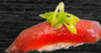
51 Atún Rojo 4€