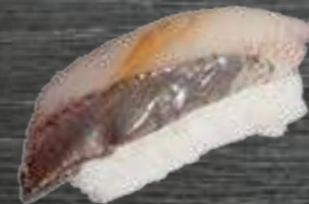
45 Caballa 3,50€