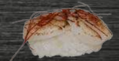
50 Vieira 4€