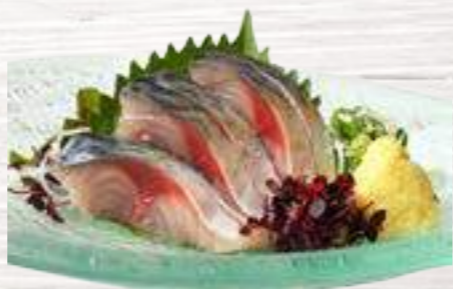
29 Caballa 4,80 €