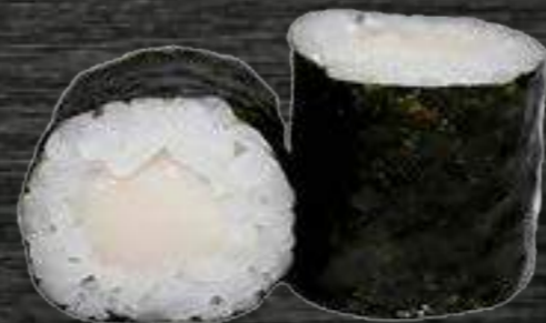
Pez mantequilla 5,70€