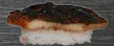
47 Congrio 3€