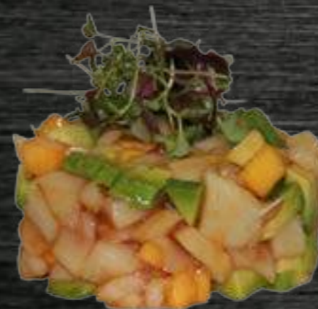
22 Pez Mantequilla Pez mantequilla, aguacate, mango y tobiko 8,50€