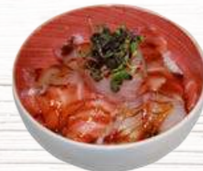
34 Moriwase 7,80€