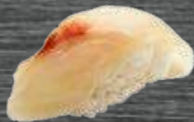
37 Lubina 3,50€