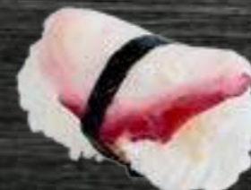
48 Pulpo 4€