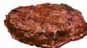
Extra Scheibe Beef