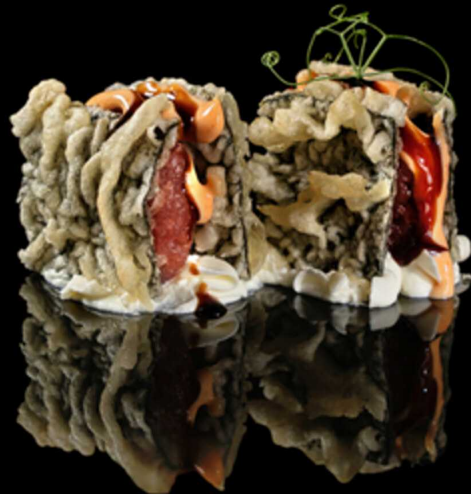
68. MILLEFOGLIE ALGA MAGURO SPICY 2PZ € 5.50

Sfoglia di alga fritta farcita con tonno e philadelphia. Guarnita con salsa teriyaki e spicy cream