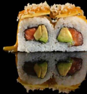
227. EXOTIC SAKE 4PZ € 5.50

Roll farciti con pesce fritto. Guarniti con anguilla*, katsubushi, tobiko* e gustose salse teriyaki, salsa mango e spicy cream. Allergeni: 1, 3, 4, 5, 6, 7, 15