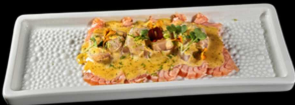
27. CARPACCIO PLUM 5PZ € 10.00 Carpaccio di salmone scottato con salsa plum e capesante* decorato con scorza di lime. Allergeni: 3, 4, 14