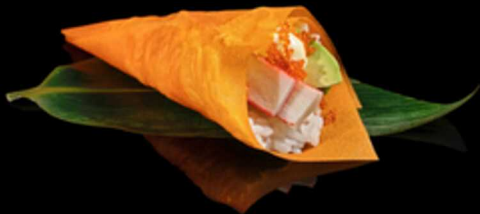
188. TEMAKI SURIMI 1PZ € 5.50

Foglia di tofu farcita con pollo fritto e insalata. Guarnita con granella di pistacchio e spicy cream Allergeni: 1, 3, 6, 7, 8