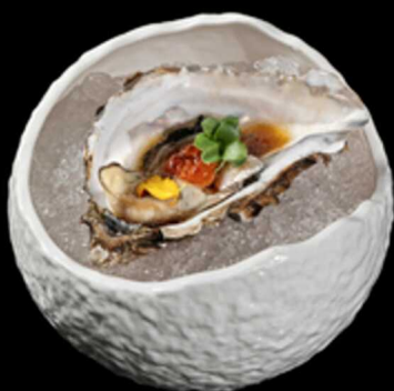
49. OSTRICHE SPECIAL 1PZ € 6.00

Ostrica aromatizzata con ikura* e salsa sudachi Allergeni: 14