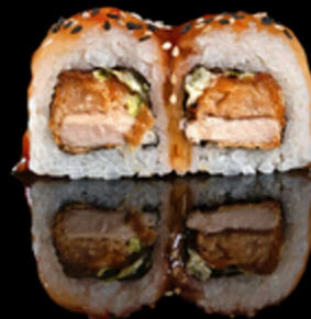
205. CHICKEN ROLL 4PZ € 5.00

Roll farciti con salmone fresco affumicato, crumble di tempura e philadelphia. Guarniti con chips di patate. Allergeni: 1, 4, 7