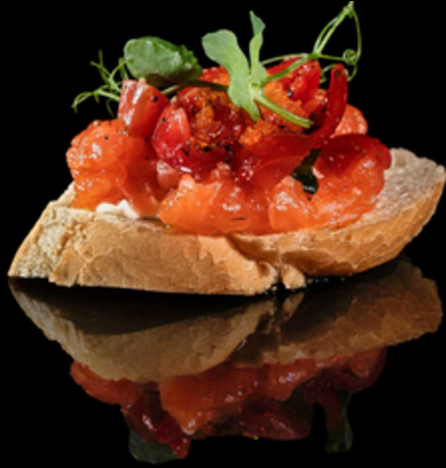
80. TAPAS SALMON IPZ € 3.00

Tapas con pomodorini speziati, salmone e philadelphia. Guarnito con tobiko*, olio oliva, sale e pepe Allergeni: 1, 4, 7, 8, 15