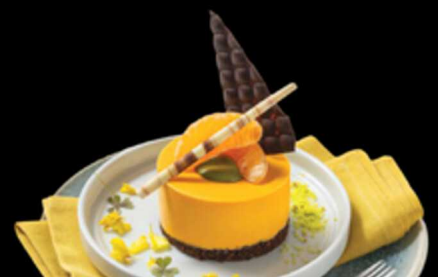
Ispirazione Al Mandarino € 6.00