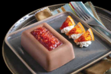
Cuore D'arancia € 6.00