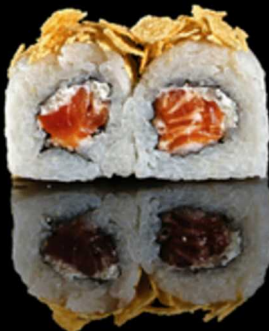
204. SMOKE ROLL 4PZ € 5.00

Roll farciti con salmone cotto e philadelphia. Guarniti con semi di sesamo e salsa teriyaki. Allergeni: 1, 4, 6, 7, 11