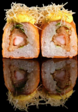
234. WHITE EBITEN 4PZ € 5.50

Roll farciti con asparagi in tempura e philadelphia. Guarnito con fette di salmone affumicato e mozzarella di bufala e salsa teriyaki. Allergeni: 1, 4, 7