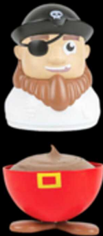
Pirata € 6.00