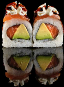
224. SAKE TATAKI 4PZ € 5.50

Roll farciti con salmone e avocado. Guarniti con salmone scottato, philadelphia e salsa teriyaki. Allergeni: 1, 4, 6, 7