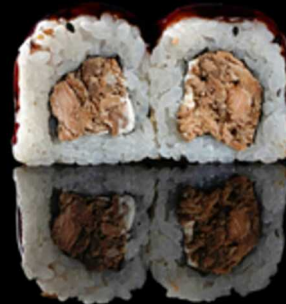
203. MIURA 4PZ € 5.00

Roll farcito con salmone e avocado. Guarnito con philadelphia e sesamo Allergeni: 4, 7, 11