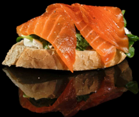
82. TAPAS AFFUMICATO IPZ € 3.00

Tapas con pomodorini speziati, olio oliva, mozzarella di burrata, live, olio oliva, sale e pepe Allergeni: 1, 7, 8