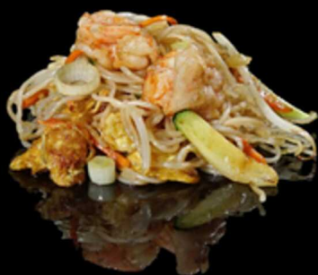
374. SPAGHETTI DI RISO CON GAMBERI E VERDURE € 7.50

Spaghetti di soia piccanti saltati con carne di maiale, cipolla e peperoni. Allergeni: 1, 6