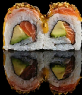
228. PISTACCHIO SAKE FLAMBE 4PZ € 5.50

Roll farciti con salmone e avocado. Guarniti con sottili fette di mango, salsa mango e croccante tempura sbriciolata. Allergeni: 1, 3, 4, 7