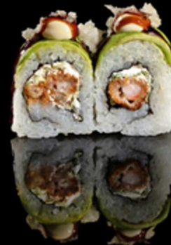
211. DRAGON ROLL 4PZ € 5.50

Roll farcito con avocado e philadelphia. Guarnito con tartar di tonno, sesamo e salsa spicy cream Allergeni: 4, 7, 11