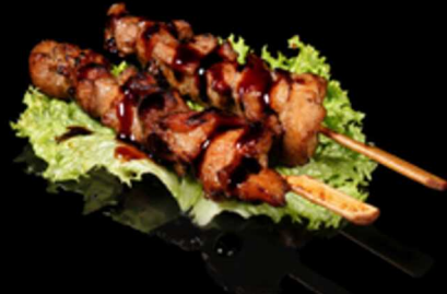
421. SPIEDINI DI POLLO 2PZ € 7.00

Spiedini di gamberetti* alla griglia e salsa teriyaki. Allergeni: 1, 2