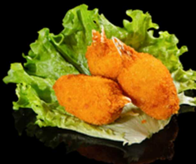
127. CHELE DI GRANCHIO 3PZ € 3.50

Croccanti involtini fritti di pasta sfoglia con ripieno di gamberi*. Allergeni: 1, 2