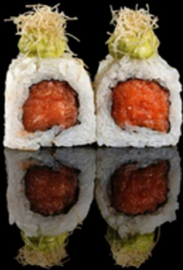
220. SALMON GUACAMOLE 4PZ € 5.00

Roll farcito con tartare di salmone. Guarnito con guacamole e kataifi