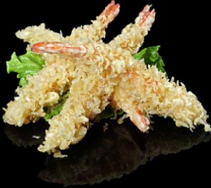
430. TEMPURA DI GAMBERI 3PZ € 9.00

Croccante frittura giapponese di gamberoni*. Allergeni: 1, 2