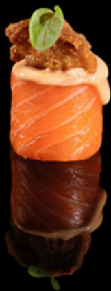
336. GUNKAN CHICKEN IPZ € 2.50 Bocconcino di riso avvolto da salmone. Guarnito con pollo fritto e spicy cream Allergeni: 1, 3, 4, 7