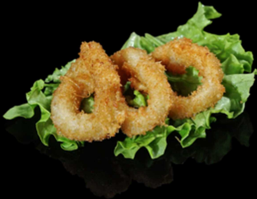
432. CALAMARI FRITTI 3PZ € 6.00

Croccante frittura giapponese di verdure miste (carote, patate dolce e zucchine) Allergeni: 1