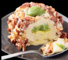
Croccante Al Pistacchio € 6.00