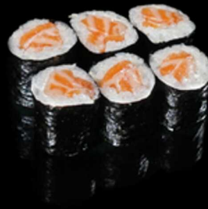
165. HOSOMAKI SAKE 6PZ € 5.00

Mini roll di riso fritti con salmone, decorati con philadelphia, gambero amaebi* e salsa teriyaki. Allergeni: 1, 2, 4, 6, 7