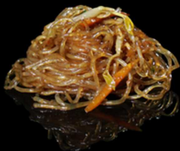
372. SPAGHETTI DI SOIA CON VERDURE € 7.50

Spaghetti di soia saltati con verdure miste. Allergeni: 1, 6