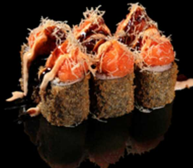
163. HOSOMAKI FRITTO 6PZ € 7.50

Mini roll farciti con salmone, decorati con granella di pistacchio, crema allo zafferano e salsa teriyaki. Avvolti in una croccante alga nori fritta. Allergeni: 1, 3, 4, 6, 7