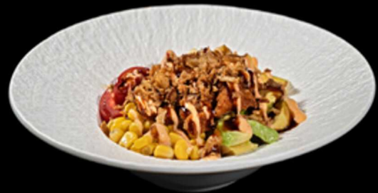
356. POKE CHICKEN SPICY € 13.00

Poke a base di riso condito sopra con pollo fritto, avocado, mango, pomodorini, salsa spicy cream e cipolla fritta