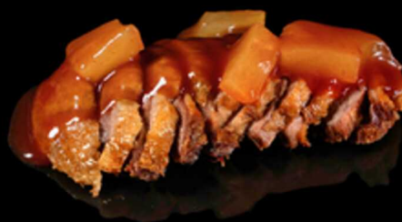
403. ANATRA AGRODOLCE € 8.00

Fettine di petto d' anatra* cotte al forno con cubetti di ananas, pomodorini e salsa agrodolce. Allergeni: 1