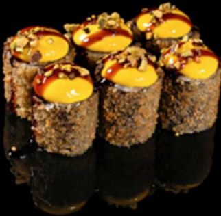
162. HOSOMAKI PISTACCHIO 6PZ € 7.00

Mini roll di riso fritti con salmone, decorati con fragole fresche, philadelphia e salsa teriyaki. Avvolti in una croccante alga nori fritta. Allergeni: 1, 3, 4, 6, 7