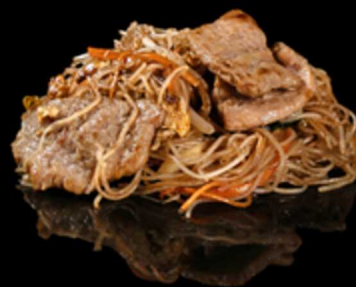
375. SPAGHETTI DI RISO CON MANZO E VERDURE € 7.50

Spaghetti di riso saltati con uova, gamberetti* e verdure miste. Allergeni: 1, 2, 3