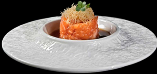
285. SAKE TARTARE € 8.50

Tartare di salmone con kataifi e salsa ponzu Allergeni: 1, 4, 6