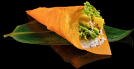
189. TEMAKI VEGGAN 1PZ € 5.50

Foglia di tofu farcita con surimi* e avocado. Guarnita con maionese e tobiko* Allergeni: 2, 3, 4, 6, 7, 14, 15