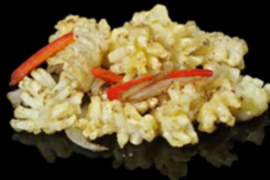
401. SEPIE SALE E PEPE € 8.00

Seppia* saltata con peperoni, cipolle, arachidi e salsa piccante. Allergeni: 8, 14