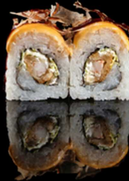
225. ROLL KIBOU 4PZ € 5.50

Roll farciti con salmone e avocado. Guarniti con salmone scottato, philadelphia e salsa teriyaki. Allergeni: 1, 4, 6, 7