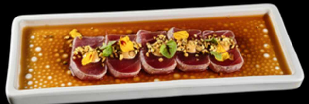
30. TONNO TATAKI 5PZ € 10.00 Tonno scottato con salsa miso e granella di pistacchio adagiato su salsa sudachi. Allergeni: 1, 4, 6, 8