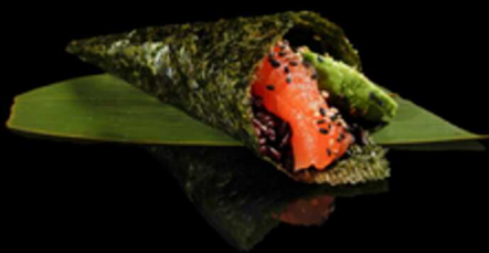
190. TEMAKI BLACK SAKE 1PZ € 6.00

Foglia di tofu farcita con mango, avocado e insalata. Guarnita con salsa di mango e semi di sesamo Allergeni: 6, 11