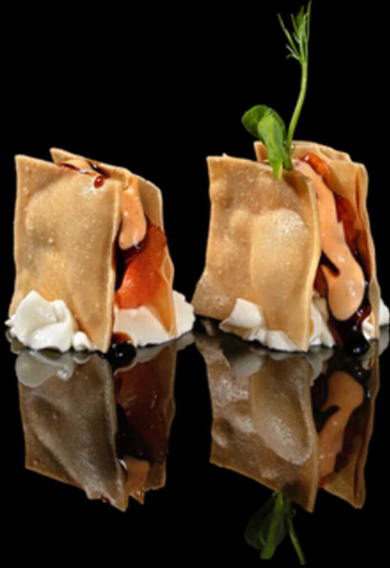
65. MILLEFOGLIE SALMONE 2PZ € 5.50

Sfoglia di pasta fritta farcita con salmone e philadelphia, aromatizzata alla salsa teriyaki e salsa spicy cream