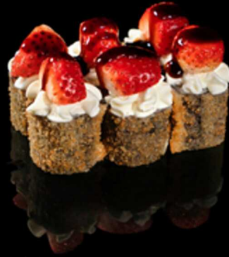
161. HOSOMAKI FRAGOLA 6PZ € 7.00

Mini roll di riso farciti con salmone, decorati con mango e philadelphia e salsa mango. Avvolti in una croccante alga nori fritta. Allergeni: 1, 3, 4, 6, 7