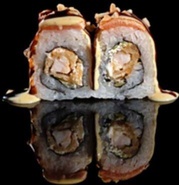
214. EBI NUTS ROLL 4PZ € 5.50

Roll farciti con gambero in tempura, insalata e philadelphia. Guarniti con salmone scottato, mandorle a fette e salsa teriyaki e miso Allergeni: 1, 2, 4, 6, 7, 8