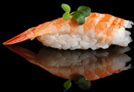
304. EBI NIGIRI 2PZ € 4.00

Bocconcini di riso con fettina di ricciola crudo. Allergeni: 4