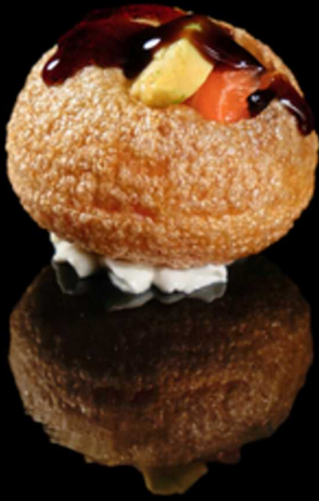
276. PURI SALMON IPZ € 4.00

Puri ball con ripieno di salmone, avocado e philadelphia. Guarnito con salsa teriyaki. Allergeni: 1, 4, 7, 8