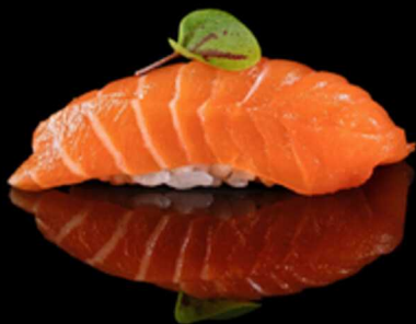
300. NIGIRI SAKE 2PZ € 4.00

Bocconcini di riso con fettina di salmone crudo. Allergeni: 4