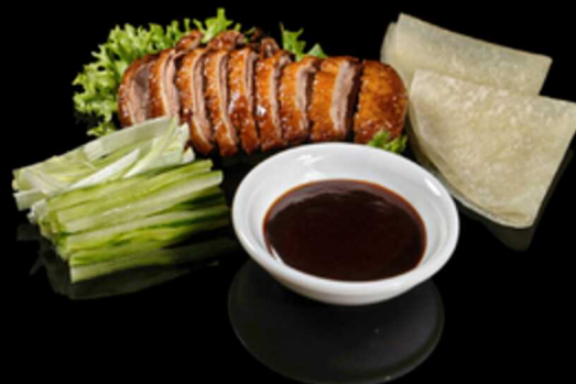
405. ANATRA PECHINESE € 12.00

Fettine di petto d' anatra* cotte al forno, aromatizzate all' arancia. Allergeni: 1