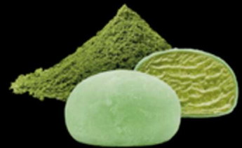
Moci Matcha € 6.00