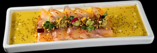
26. CARPACCIO SUZUKI 5PZ € 7.00 Carpaccio di branzino aromatizzato al passion, con pistacchio Allergeni: 4, 8