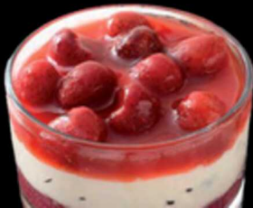
Coppa Mascarpone E Fragole € 6.00