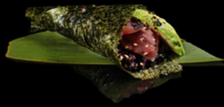
191. TEMAKI BLACK MAGURO 1PZ € 6.00

Cono di alga nori ripieno di riso venere, fette di salmone e avocado. Guarnito con semi di sesamo. Allergeni: 4, 6, 11