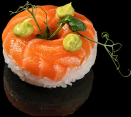
350. CHIRASHI SAKE 1PZ € 9.00

Fettine di salmone crudo su un letto di riso decorato con guacamole.