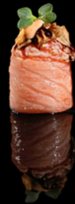
341. GUNKAN SAKE FLAMBE SPICY IPZ € 2.50 Bocconcino di riso avvolto da salmone scottato, guarnito con tartare di salmone, cipolla croccante, salsa teriyaki e spicy cream. Allergeni: 1, 4