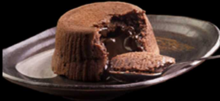
SOUFFLE AL CIOCCOLATO € 6.00