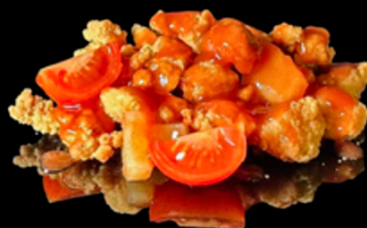
389. POLLO AGRODOLCE € 7.00

Pollo cotto con latte di cocco e salsa thailandese, unito a patate, cipolla, peperoni e funghi. Allergeni: 7, 8