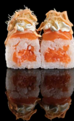
223. FRESH SAKE 6PZ € 8.00

Roll farciti con tartare di salmone. Guarniti con fettine di salmone, philadelphia, croccante kataifi e salsa spicy cream.