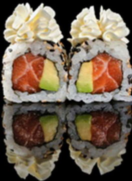
202. PHILA ROLL 4PZ € 5.00

Roll farciti con gambero* fritto, insalata e philadelphia. Guarniti con croccante kataifi e salsa teriyaki. Allergeni: 1, 6, 7