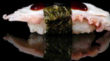
307. NIGIRI TAKO 2PZ € 4.50

Bocconcini di riso con fettina di anguilla* e salsa teriyaki. Allergeni: 1, 4, 6, 11