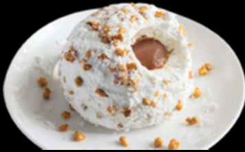
Tartufo Cocco Nocciola € 6.00