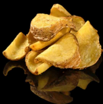
130. PATATE CON BUCCIA FRITTE € 4.50