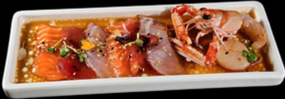
25. CARPACCIO KIBOU SELECTION 7PZ € 12.00 Carpaccio di pesce misto: 2pz salmone, 1pz tonno, 1pz scampo*, 2pz branzino, 1pz capasanta*. Aromatizzato con sesamo, salsa ponzu e olio EVO Allergeni: 1, 2, 4, 6, 11, 14