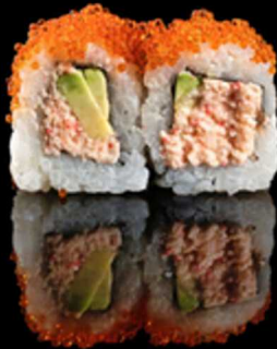
208. CALIFORNIA TOBIKO 4PZ € 5.00

Roll farciti con surimi*, tobiko*, avocado e maionese. Guarniti con gambero* cotto. Allergeni: 1, 2, 3, 7, 12, 14, 15