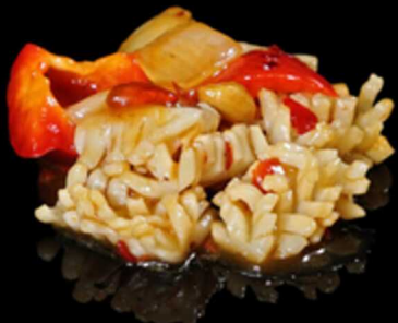
400. SEPIE IN SALSA PICCANTE € 8.00

Seppia* saltata con peperoni, cipolle, arachidi e salsa piccante. Allergeni: 8, 14