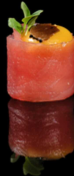
343. GUNKAN QUAGLIA IPZ € 3.50

Bocconcino di riso avvolto da salmone crudo, guarnito con ikura*. Allergeni: 4