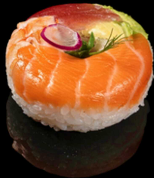
351. CHIRASHI MORIAWASE 1PZ € 10.00

Fettine di salmone, tonno e gambero* su un letto di riso decorato con avocado