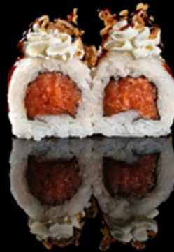
219. SALMON CRUNCHY 4PZ € 5.00

Roll farcito con tartare di salmone. Decorato con cipolla frita, Philadelphia e salsa teriyaki