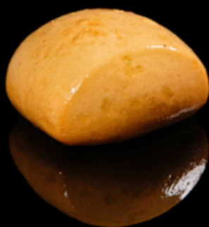
146. PANE ORIENTALE FRITTO 2PZ € 2.50

Pane* cinese a doppia lievitazione fritto