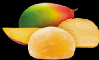
Moci Mango € 6.00