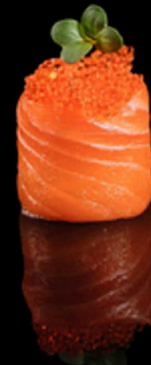
335. GUNKAN TOBIKO IPZ € 2.50

Bocconcino di riso avvolto da salmone crudo guarnito con granella di pistacchio e crema allo zafferano. Allergeni: 1, 4, 7, 8