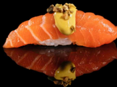
311. NIGIRI ZAFFERANO 2PZ € 5.00

Bocconcino di riso con fettina di salmone. Guarnito con philadelphia e tobiko* Allergeni: 1, 4, 7, 15