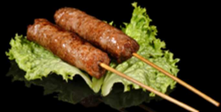
423. SPIEDINI DI SALSICCIA 2PZ € 5.00

Spiedini di manzo alla griglia. Allergeni: 1