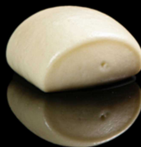
145. PANE ORIENTALE 2PZ € 2.50