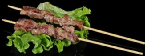
422. SPIEDINI DI MANZO 2PZ € 7.00

Spiedini di pollo marinato con salsa di soia e farina di riso glutinoso. Allergeni: 1, 6