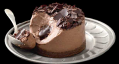
Cremoso Al Cioccolato € 6.00