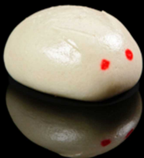
144. PANE DOLCE 2PZ € 3.00

Simpatico pane dolce cinese con crema all' uovo.