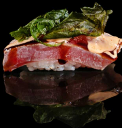
319. TONNO FLAMBE RUCOLA 2PZ € 5.50

Bocconcino di riso con fettina di tonno scottato. Guarnito con philadelphia, cipolla croccante e salsa teriyaki Allergeni: 1, 4, 7