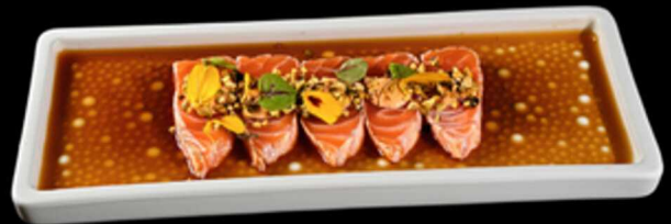
28. TATAKI SAKE 5PZ € 8.50 Tataki di salmone flambé adagiato su un letto di salsa ponzu e guarnito con granella di pistacchio e salsa spicy cream. Allergeni: 1, 4, 6, 8