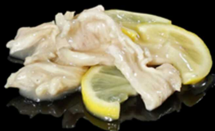
393. POLLO LIMONE € 8.00

pollo marinato, saltato con salsa teriyaki e semi di sesamo. Allergeni: 11