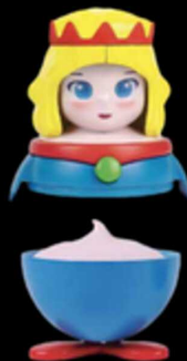
Principessa € 6.00