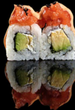
209. SPICY SALMON 4PZ € 5.50

Roll farcito con surimi*, avocado e maionese, avvolto da tobiko* Allergeni: 1, 2, 3, 7, 12, 14, 15