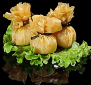
123. EBI BAG 3PZ € 4.50

Crocante involtino fritto di pasta sfoglia con gustoso ripieno di verdure. Allergeni: 1, 3, 6, 11