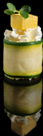
338. GUNKAN VEGAN IPZ € 2.50 Bocconcino di riso avvolto da zucchini. Guarnito con philadelphia e cubetto di mango Allergeni: 7, 8