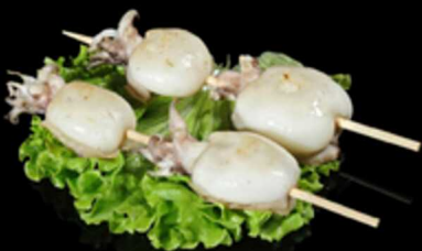
424. SPIEDINI DI SEPPIOLINE 2PZ € 6.50

Spiedini di seppioline* e salsa teriyaki Allergeni: 1, 6, 14