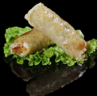
121. INVOLTINO VIETNAMITA 2PZ € 3.00

Crocante involtino fritto di pasta sfoglia con gustoso ripieno di verdure. Allergeni: 1, 3, 6, 11