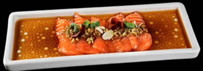
288. CARPACCIO SMOKY 5PZ € 8.50

Carpaccio di salmone guarnito con granella di pistacchio e ponzu. Allergeni: 1, 4, 6, 8