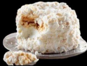
Meringa € 6.00