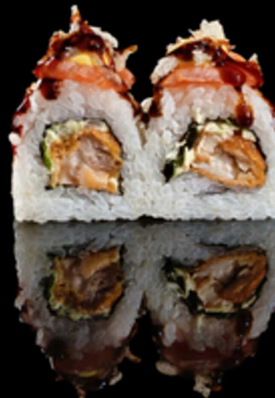
229. KINGROLL 4PZ € 6.00

Roll farciti con salmone e avocado. Guarniti con fette di salmone flambè, granella di pistacchi e salsa mango. Allergeni: 1, 4, 8