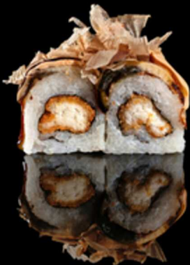
226. VULCANO 4PZ € 6.00

Roll farcito con tempura di gamberi*, insalata e philadelphia. Guarnito con cheddar scottato, katsubushi e salsa teriyaki Allergeni: 1, 2, 4, 6, 7