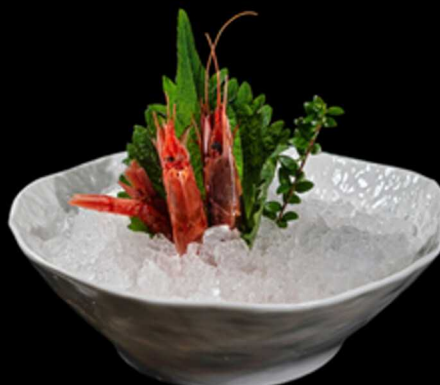
48. SASHIMI GAMBERI ROSSI 3PZ € 11.00