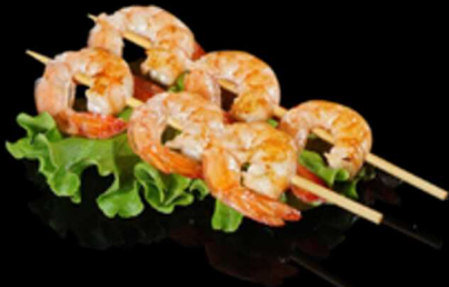
420. SPIEDINI DI GAMBERI 2PZ € 5.00

Spiedini di gamberetti* alla griglia e salsa teriyaki. Allergeni: 1, 2