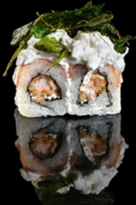
216. BURRATA ROLL 4PZ € 5.50

Roll farcito con tempura di gamberi*, insalata e philadelphia. Guarnito con salmone, tobiko* e salsa teriyaki Allergeni: 1, 2, 4, 6, 7, 15