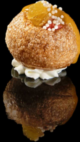
277. PURI MAGURO IPZ € 4.00

Puri ball con ripieno di salmone, avocado e philadelphia. Guarnito con salsa teriyaki. Allergeni: 1, 4, 7, 8