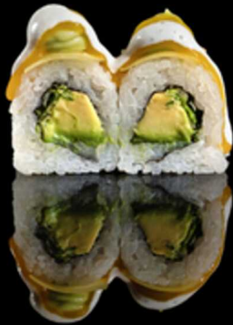
230. LIGHT GUACAMOLE 4PZ € 5.00

Veggie roll farciti con avocado, cetrioli e insalata. Guarniti da mango, guacamole, salsa al mango e salsa yogurt soy Allergeni: 1, 3, 7