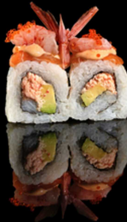
258. ROSSO SICILIANO 4PZ € 8.00

Preziosi roll farciti di salmone e avocado. Guarniti con guacamole, salsa teriyaki e polvere d' oro. Allergeni: 1, 4, 6