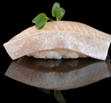
303. NIGIRI RICCIOLA 2PZ € 5.00

Bocconcini di riso con fettina di branzino crudo. Allergeni: 4