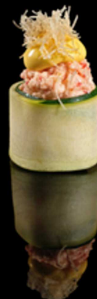
337. GUNKAN SURIMI IPZ € 2.50 Bocconcino di riso avvolto da zucchini. Guarnito con surimi*, kataifi e crema allo zafferano Allergeni: 2, 3, 4, 7, 14, 15