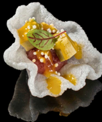
279. CLOUD MAGURO IPZ € 4.00

Nuvola di drago accompagnata con salmone, philadelphia, avocado e cipolla croccante. Guarnita con salsa teriyaki e spicy cream. Allergeni: 1, 2, 4, 7, 8