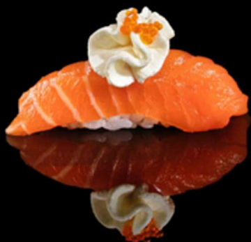
310. NIGIRI KIBOU 2PZ € 5.00

Bocconcino di riso con gambero* rosso crudo Allergeni: 2