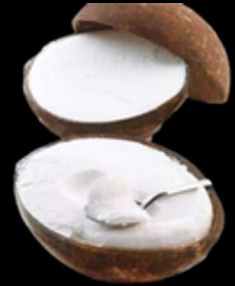
Cocco Ripieno € 6.00