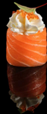
333. GUNKAN PHILADELPHIA IPZ € 2.50

Bocconcino di riso avvolto da salmone crudo guarnito con tartare di tonno e salsa spicy cream. Allergeni: 1, 4