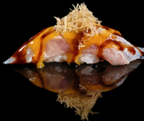
321. NIGIRI SUZUKI MAGO 2PZ € 5.00

Bocconcino di riso con fettina di branzino scottato. Guarniti con philadelphia, granella di pistacchio e salsa teriyaki. Allergeni: 1, 4, 7