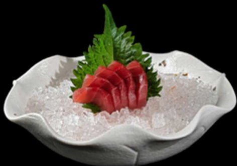
45. SASHIMI TONNO 5PZ € 12.00