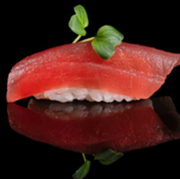
301. NIGIRI MAGURO 2PZ € 5.00

Bocconcini di riso con fettina di salmone crudo. Allergeni: 4