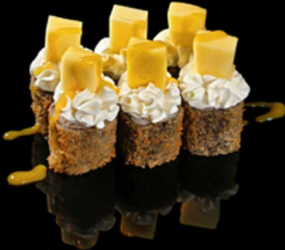
160. HOSOMAKI MANGO 6PZ € 7.50

Mini roll di riso farciti con salmone, decorati con mango e philadelphia e salsa mango. Avvolti in una croccante alga nori fritta. Allergeni: 1, 3, 4, 6, 7