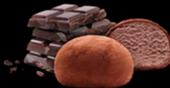
Moci Cioccolato € 6.00