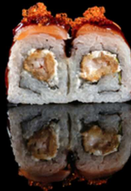
215. EBI TOBIKO 4PZ € 5.50

Roll farciti con gambero in tempura, insalata e philadelphia. Guarniti con salmone scottato, arachidi e salsa teriyaki e plum Allergeni: 1, 2, 4, 6, 7, 8