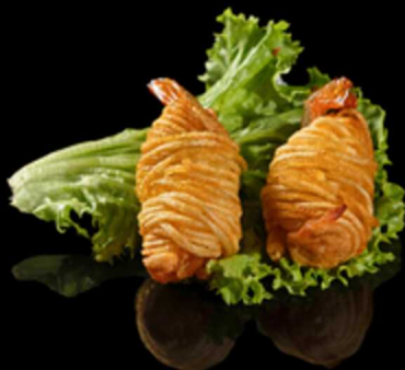
124. GAMBERI VIETNAMITI 3PZ € 4.50

Crocante pasta sfoglia frita con ripieno di gamberi*, carota e zucca. Allergeni: 1, 2, 3