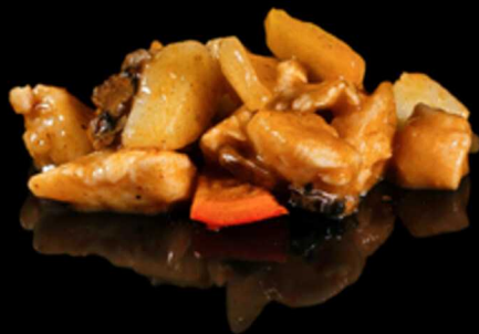
388. POLLO THAI € 7.50

Pollo cotto con latte di cocco e salsa thailandese, unito a patate, cipolla, peperoni e funghi. Allergeni: 7, 8