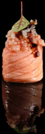
340. GUNKAN SAKE FALMBE IPZ € 2.50 Bocconcino di riso avvolto da salmone scottato, guarnito con tartare di salmone scottato, farina di tempura e salsa teriyaki. Allergeni: 1, 4