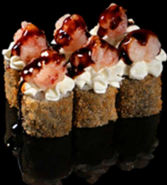
164. HOSOMAKI AMAEBI 6PZ € 8.50

Mini roll di riso farciti con salmone, decorati con tartare di salmone, kataifi, salsa teriyaki e salsa spicy cream. Avvolti in una croccante alga nori fritta. Allergeni: 1, 4, 6, 11