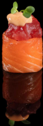
332. GUNKAN SPICY MAGURO IPZ € 2.50

Bocconcino di riso avvolto da salmone crudo guarnito con tartare di salmone e salsa spicy cream. Allergeni: 1, 4