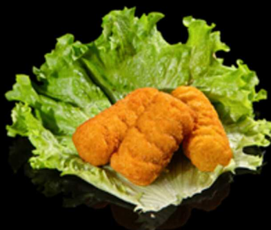
131. CROCCHETTE DI PATATE 3PZ € 4.00

Crocchette di patate* fritte Allergeni: 1