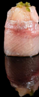
345. GUNKAN RICCIOLA IPZ € 3.50

Bocconcino di riso avvolto da tonno crudo, guarnita con capesante*, scaglia di tartufo e salsa al tartufo Allergeni: 1, 4, 14