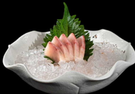
46. SASHIMI RICCIOLA 5PZ € 12.00