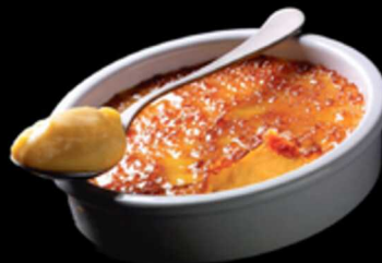
Crema Catalana In Coccio € 6.00