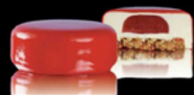
Rubino Cheesecake € 6.00