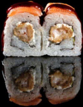
212. TIGER ROLL 4PZ € 5.50

Roll farcito con tempura di gamberi*, insalata e philadelphia. Guarnito con salmone e salsa teriyaki Allergeni: 1, 2, 4, 6, 7