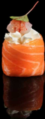
330. GUNKAN SICILIANO IPZ € 3.00

Bocconcino di riso avvolto da salmone crudo guarnito con gambero* rosa, Philadelphia e salsa ponzu. Allergeni: 1, 2, 4, 6, 7