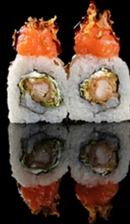
217. EBI CRUNCHY 4PZ € 6.00

Roll farcito con gambero* fritto, insalata e philadelphia. Guarnito con prosciutto crudo, burrata e rucola frita. Allergeni: 1, 2, 7