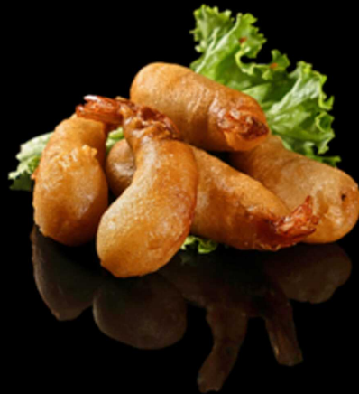
433. GAMBERI FRITTI 5PZ € 8.00

Gamberi* fritti con una leggera impanatura. Allergeni: 1, 2, 3