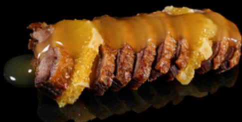
404. ANATRA ARANCIA € 8.00

Fettine di petto d' anatra* cotte al forno con cubetti di ananas, pomodorini e salsa agrodolce. Allergeni: 1