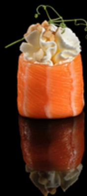
339. GUNKAN ARACHIDI IPZ € 2.50 Bocconcino di riso avvolto da salmone, con philadelphia e arachidi. Allergeni: 1, 4, 7, 8