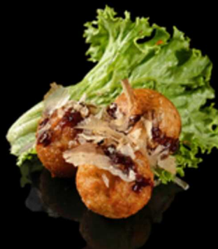
125. TAKOYAKI 3PZ € 5.50

Gambero* fritto avvolto da un vortice di patate Allergeni: 1, 2