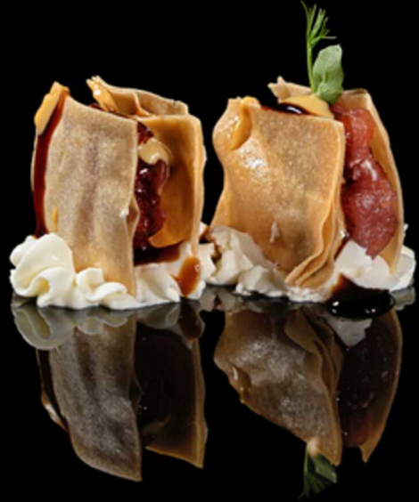
66. MILLEFOGLIE TONNO 2PZ € 5.50

Sfoglia di pasta fritta farcita con tonno e philadelphia, aromatizzata alla salsa teriyaki e miso