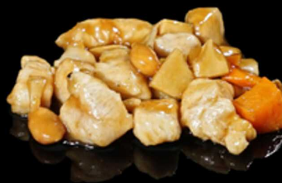
391. POLLO E MANDORLE € 8.00

Pollo piccante con arachidi, peperoni e cipolle Allergeni: 8