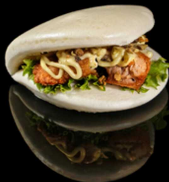
147. BAO TORY 1PZ € 4.00

Pane* cotto al vapore ripieno di pollo croccante, foglie di misticanza, granella di pistacchio e maionese