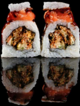
232. YASAI ROLL 4PZ € 5.00

Roll farcito con pesce fritto. Decorato con tartare di salmone, croumble di nuvole di drago e salsa teriyaki Allergeni: 1, 4, 6, 14