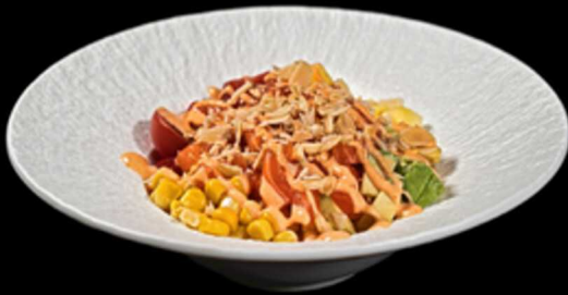
355. POKE KIBOU € 13.00

Poke a base di riso condito sopra con salmone, avocado, mango, pomodorini, mais, mandorle e salsa spicy cream