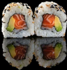
200. SAKE ROLL 4PZ € 5.00

Roll farcito con salmone e avocado. Guarnito con semi di sesamo Allergeni: 4, 11