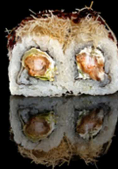
201. EBITEN 4PZ € 5.00

Roll farcito con salmone e avocado. Guarnito con semi di sesamo Allergeni: 4, 11