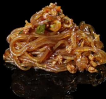
373. SPAGHETTI DI SOIA CON CARNE PICCANTE € 7.50

Spaghetti di soia saltati con verdure miste. Allergeni: 1, 6