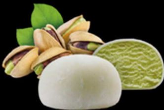
Moci Pistacchio € 6.00