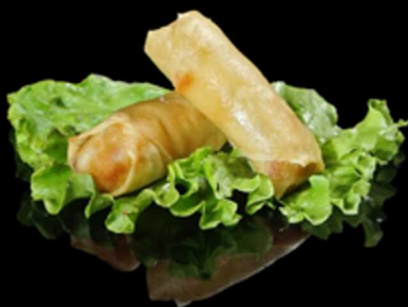
122. HARUMAKI 2PZ € 2.00

Croccanti involtini fritti di pasta sfoglia con ripieno di carne di gamberi*, pesce, carote, cipolle, funghi e germogli di soia. Allergeni: 1, 2, 3, 4