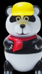
PAN-DAN € 6.00