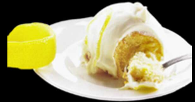
Torta Delizie Limone € 6.00