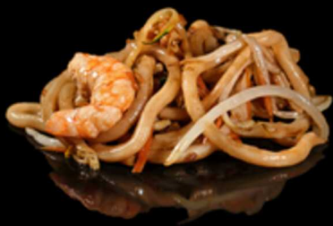
376. UDON CON GAMBERI E VERDURE € 8.00

Spaghetti di riso saltati con uova, manzo e verdure miste. Allergeni: 1, 3