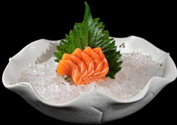
286. SASHIMI SAKE 5PZ € 8.50

Tartare di salmone con kataifi e salsa ponzu Allergeni: 1, 4, 6