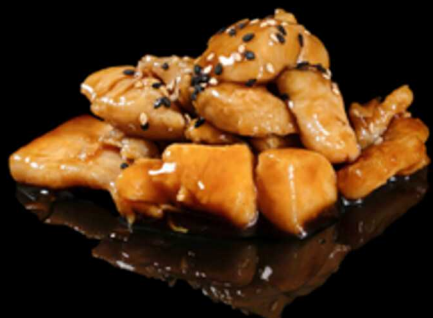
392. POLLO YAKITORI € 8.00

pollo marinato, saltato con salsa teriyaki e semi di sesamo. Allergeni: 11