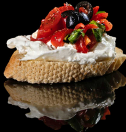
81. TAPAS BURRATA IPZ € 3.00

Tapas con pomodorini speziati, salmone e philadelphia. Guarnito con tobiko*, olio oliva, sale e pepe Allergeni: 1, 4, 7, 8, 15