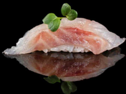
302. NIGIRI SUZUKI 2PZ € 4.00

Bocconcini di riso con fettina di tonno crudo. Allergeni: 4