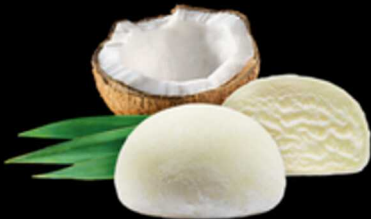
Moci Coco € 6.00