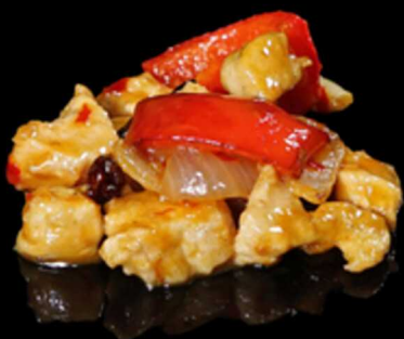
390. POLLO PICCANTE € 8.00

Pollo leggermente impanato, saltato con ananas, pomodorini in salsa agrodolce. Allergeni: 1, 3