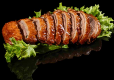
402. ANATRA ARROSTO € 11.00

Seppia* saltata con peperoni, cipolle, sale e pepe. Allergeni: 14