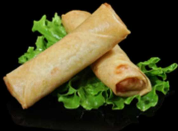
120. INVOLTINO PRIMAVERA 2PZ € 2.50

Crocante involtino fritto di pasta sfoglia con gustoso ripieno di verdure. Allergeni: 1, 3, 6, 11