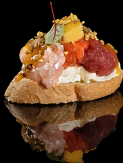
83. TAPAS TROPICAL IPZ € 3.50

Tapas con salmone affumicato, rucola, philadelphia olio oliva, sale e pepe. Allergeni: 1, 4, 7, 8