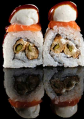
233. URAMAKI ASPARAGI 4PZ € 5.50

Roll farcito con verdure mix in tempura. Guarnito con tartare di salmone, croumble di tempura e salsa teriyaki Allergeni: 1, 4, 6