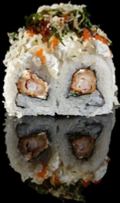
218. EBI BURRATA ROLL 4PZ € 5.50

Roll farcito con gambero* fritto, insalata e philadelphia, avvolto da tobiko*. Guarnito con burrata, tempura farina, rucola frita e pomodorini sott'olio.