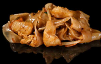
377. FETTUCINE VIETNAMITA CON POLLO € 8.00

Udon giapponese saltata con uova, gamberetti* e verdure miste Allergeni: 1, 2, 3, 6