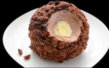
Tartufo classico € 6.00