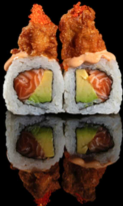
206. QUEEN ROLL 4PZ € 5.50

Roll farcito con salmone e avocado. Guarnito con pollo fritto, tobiko* e spicy cream Allergeni: 1, 3, 4, 7, 15