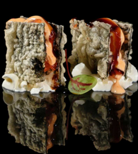
67. MILLEFOGLIE ALGA SAKE SPICY 2PZ € 5.50

Sfoglia di alga fritta farcita con salmone e philadelphia. Guarnita con salsa teriyaki e spicy cream