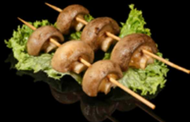
425. SPIEDINI DI FUNGHI 2PZ € 3.50

Spiedini di seppioline* e salsa teriyaki Allergeni: 1, 6, 14