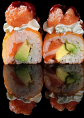
235. TOFU ROLL 4PZ € 6.00

Foglia di tofu farcita con gamberi* in tempura e insalata. Guarnita con kataifi e salsa allo zafferano Allergeni: 1, 2, 3, 6, 7