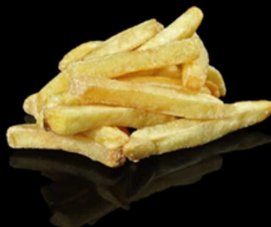
129. PATATINE FRITTE € 4.00