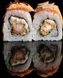
213. EBI ALMOND 4PZ € 5.50

Roll farcito con tempura di gamberi*, insalata e philadelphia. Guarnito con salmone e salsa teriyaki Allergeni: 1, 2, 4, 6, 7