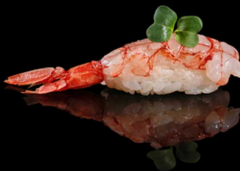
309. NIGIRI GAMBERO ROSSO 2PZ € 6.00

Bocconcino di riso con gambero* rosso crudo Allergeni: 2