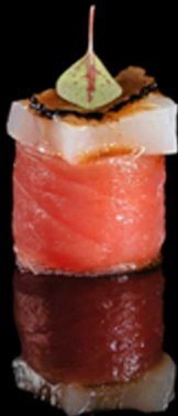
344. GUNKAN CAPESANTA IPZ € 3.50

Bocconcino di riso avvolto da tonno crudo, guarnita con uova di quaglia, tartufo e salsa al tartufo Allergeni: 1, 3, 4