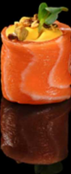
334. GUNKAN PISTACCHIO IPZ € 2.50

Bocconcino di riso avvolto da salmone, con philadelphia e tobiko*. Allergeni: 1, 4, 7, 15