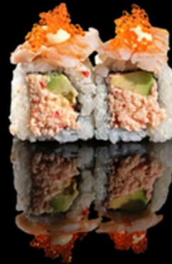
207. CALIFORNIA 4PZ € 5.50

Roll farcito con salmone e avocado. Guarnito con pollo fritto, tobiko* e spicy cream Allergeni: 1, 3, 4, 7, 15