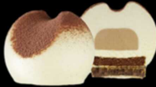
Goccia Tiramisù € 6.00