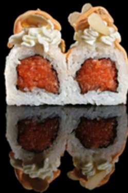
221. ALMOND SAKE 4PZ € 5.00

Roll farciti con tartare di salmone. Guarniti con mandorle a fette, philadelphia e spicy cream