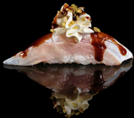
320. SUZUKI FLAMBE 2PZ € 5.00

Bocconcino di riso con fettina di tonno scottato. Guarnito con rucola fritto, salsa teriyaki e spicy cream Allergeni: 1, 4, 7