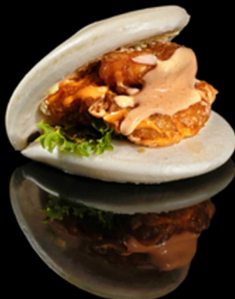
148. BAO EBI 1PZ € 4.00

Pane* cotto al vapore ripieno di gamberetti* fritti, cipolla, tobiko* e salsa piccante.