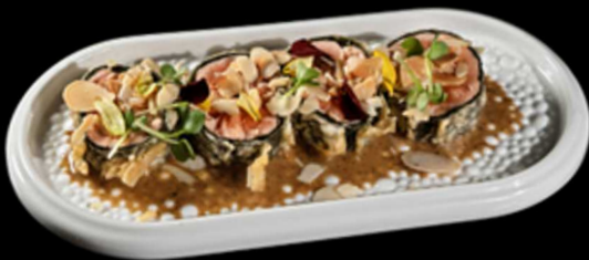
29. TATAKI DRESSING 4PZ € 9.00 Salmone in tempura avvolto da alga decorato con mandorle a fette ed adagiato su salsa sesamo Allergeni: 1, 4, 8, 11