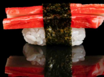
305. NIGIRI SURIMI 2PZ € 4.00

Bocconcini di riso con gambero* cotto Allergeni: 2