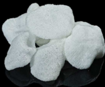
128. NUVOLE DI DRAGO € 3.50

Gustose chele di granchio* fritte. Allergeni: 1, 2, 3