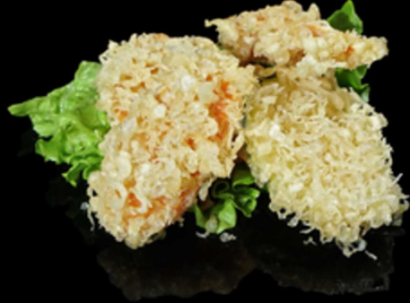
431. TEMPURA YASAI 9PZ € 7.00

Croccante frittura giapponese di gamberoni*. Allergeni: 1, 2