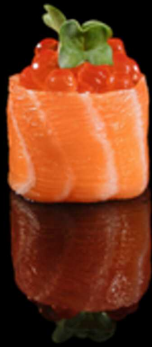
342. GUNKAN IKURA IPZ € 3.50

Bocconcino di riso avvolto da salmone crudo, guarnito con ikura*. Allergeni: 4