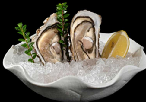
50. OSTRICHE 2PZ € 10.00

Ostrica aromatizzata con ikura* e salsa sudachi Allergeni: 14