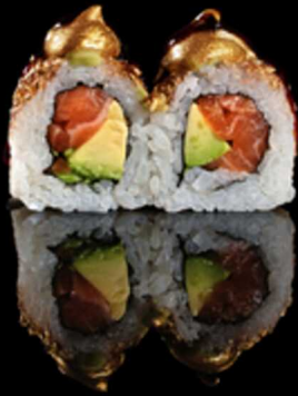
257. GOLDEN SAKE 4PZ € 6.00

Preziosi roll farciti di salmone e avocado. Guarniti con guacamole, salsa teriyaki e polvere d' oro. Allergeni: 1, 4, 6