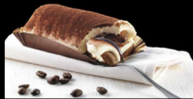
TIRAMISU CON SAVOIARDI € 6.00