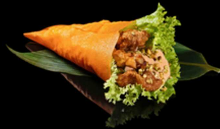
187. TEMAKI CHICKEN 1PZ € 5.50

Cono di alga nori ripieno di fette di anguilla* e avocado. Guarnito con semi di sesamo e salsa teriyaki Allergeni: 1, 4, 11