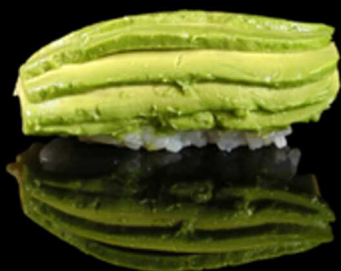
308. NIGIRI AVOCADO 2PZ € 4.00

Bocconcini di riso con polpo* cotto al vapore, alga nori e salsa teriyaki. Allergeni: 1, 4, 6, 11, 14