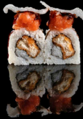
231. DRAFON FRY 4PZ € 5.50

Veggie roll farciti con avocado, cetrioli e insalata. Guarniti da mango, guacamole, salsa al mango e salsa yogurt soy Allergeni: 1, 3, 7