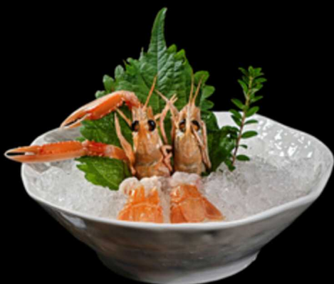
47. SASHIMI SCAMPO 2PZ € 8.00