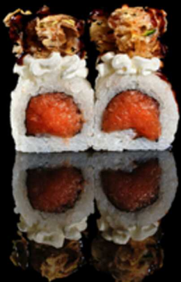
222. SALMONE PHILADELPHIA 4PZ € 5.00

Roll farcito con tartare di salmone. Decorato con Philadelphia, mix di verdure in tempura e salsa teriyaki