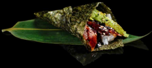
186. TEMAKI UNAGI 1PZ € 7.00

Cono di alga nori ripieno di fette di anguilla* e avocado. Guarnito con semi di sesamo e salsa teriyaki Allergeni: 1, 4, 11