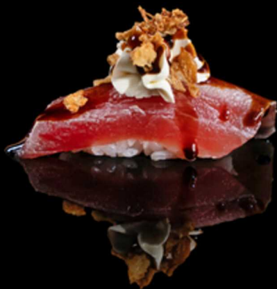
318. NIGIRI CRISPY MAGURO 2PZ € 5.50

Bocconcino di riso con fettina di tonno scottato. Guarnito con philadelphia, cipolla croccante e salsa teriyaki Allergeni: 1, 4, 7