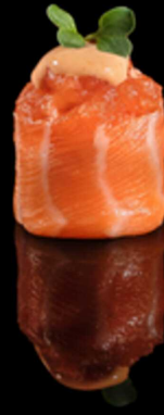
331. GUNKAN SPICY SAKE IPZ € 2.50

Bocconcino di riso avvolto da salmone crudo guarnito con gambero* rosa, Philadelphia e salsa ponzu. Allergeni: 1, 2, 4, 6, 7