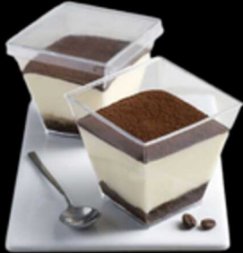
Coppa Tiramisu Gluten Free € 6.00