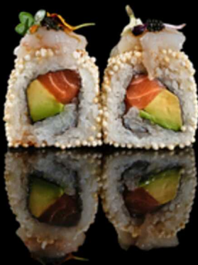
259. SCAMPO ROLL 4PZ € 8.00

Roll farciti con surimi*, avocado e maionese. Guarniti da salmone crudo, gambero* rosso, tobiko* e salsa spicy cream. Allergeni: 1, 2, 3, 4, 7, 12, 15