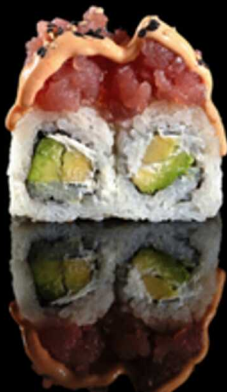
210. SPICY MAGURO 4PZ € 5.50

Roll farcito con avocado e philadelphia. Guarnito con tartar di salmone, sesamo e salsa spicy cream Allergeni: 4, 7, 11