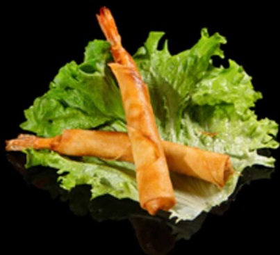
126. EBI STICK 2PZ € 3.50

Croccanti involtini fritti di pasta sfoglia con ripieno di gamberi*. Allergeni: 1, 2