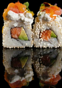
260. MAZZARA ROLL 4PZ € 8.00

Roll farciti con salmone, avocado e masago arare. Guarniti con scampo crudo, uova di lompo nero* e salsa al tartufo Allergeni: 1, 2, 4, 6, 15