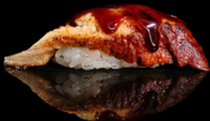
306. NIGIRI UNAGI 2PZ € 5.00

Bocconcini di riso con fettina di anguilla* e salsa teriyaki. Allergeni: 1, 4, 6, 11