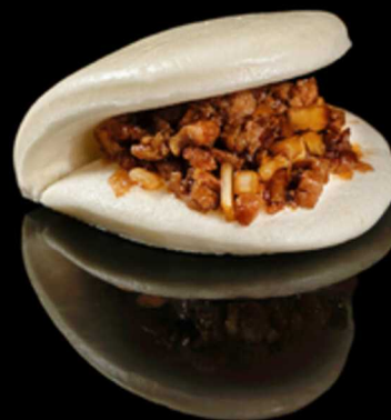
149. ANGUS BAO 1PZ € 4.50

Pane* cotto al vapore, con angus saltato con cipolle alla piastra