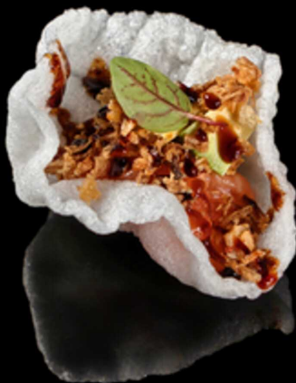
278. CLOUD SALMON IPZ € 4.00

Puri ball con ripieno di tonno crudo e philadelphia. Guarnito con arancia, masago arare e salsa mango. Allergeni: 1, 4, 7, 8