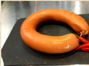
Saarl. Lyoner 7 € je Ring