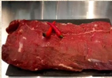
Arg. Rumpsteak 45 € / Kg