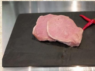
Kaminbraten 20 € / kg