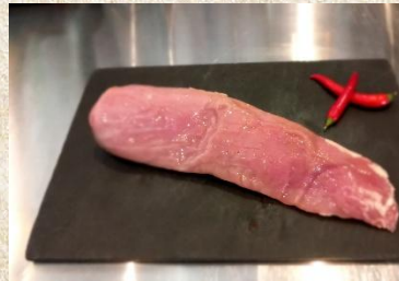
Dt. Schweinefilet 26 € / Kg