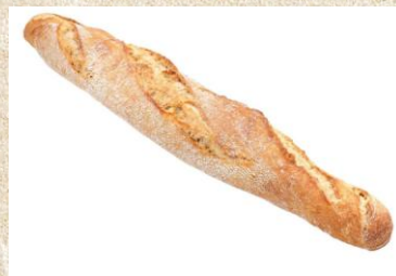
Baguette 3 € / Stück