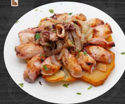
Chipirones encebollados sobres lecho de patata panadera. P.V.P. 16,00 €