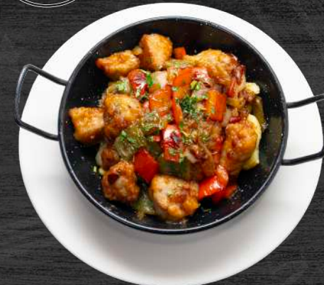
Sarten cerdo agri dulce de solomillo ibérico al estilo TONEL.