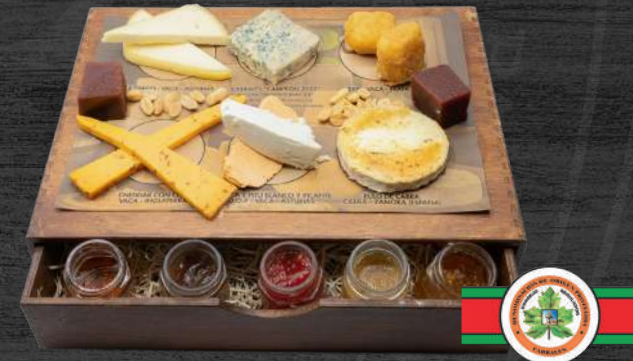
Tabla de quesos con frutos secos, mer- meladas y membrillo. Cabrales campeón, rulo de cabra, Vidiago, cheddar con chili, brie y afuega'l pitu blanco y Roxu.