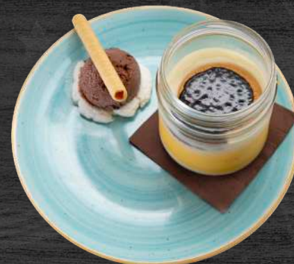
Tarrito del abuelo con helado.