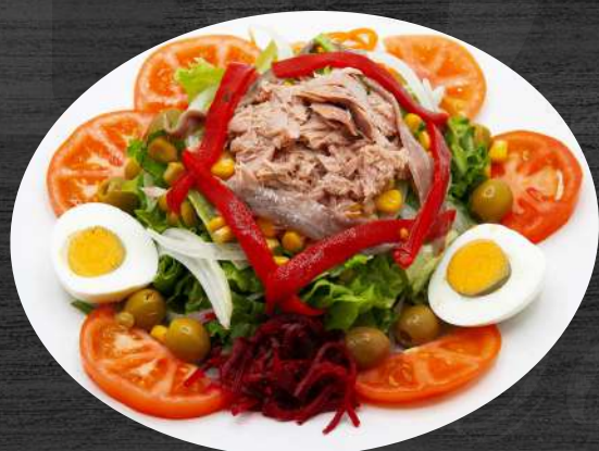
Ensalada BIG mixta. P.V.P. 15,50 €