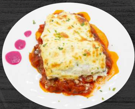
Bacalao gratinado en costra de ali-oli sobre cama de panaderas y pisto asturiano.