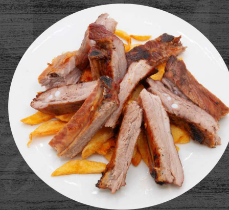
Costillas de cerdo a la parrilla con patatas fritas. P.V.P. 22,00 €