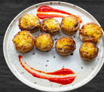
Champiñones enteros rellenos de jamón ibérico y gratinados con queso. P.V.P. 14,00 €