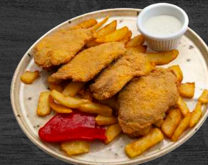
Escalopines de solomillo ibérico al Cabrales.