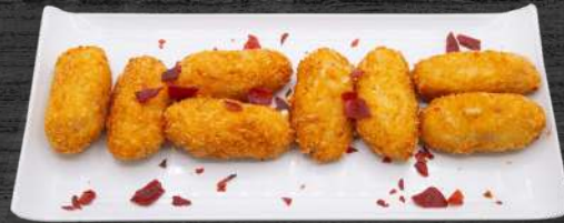
Croquetas cremosas de jamón ibérico. P.V.P. 12,00 €