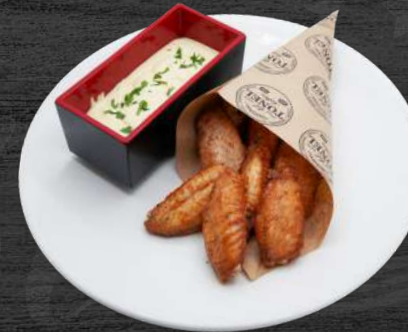
Alitas de pollo crunchy con la auténtica salsa chick fil-a. P.V.P. 12,50 €