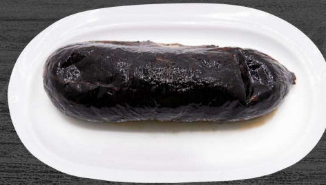
Morcilla matachana a la brasa. P.V.P. 6,50 €