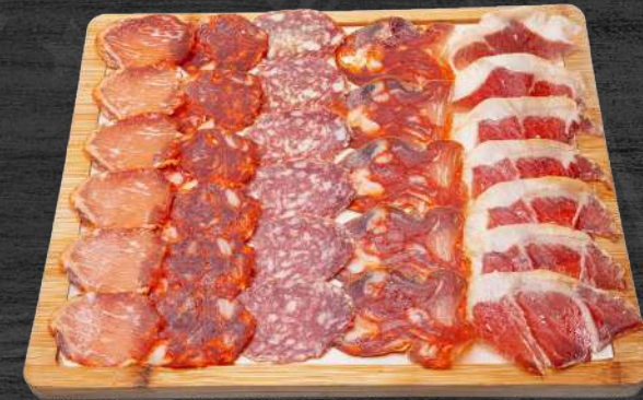
Selección de embutidos ibéricos. P.V.P. 20,90 €