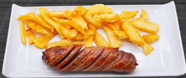
Chorizo criollo con patatas fritas. P.V.P. 5,90 €