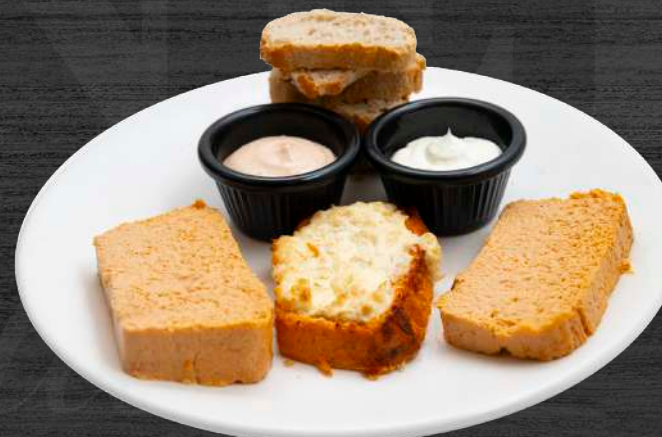
Pastel de cabracho con panecillos y gratin de manzana. P.V.P. 14,50 €