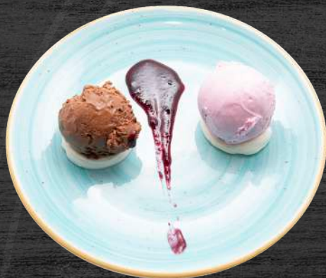
Esferas de helados. Elige dos bolas. P.V.P. 6,00 €