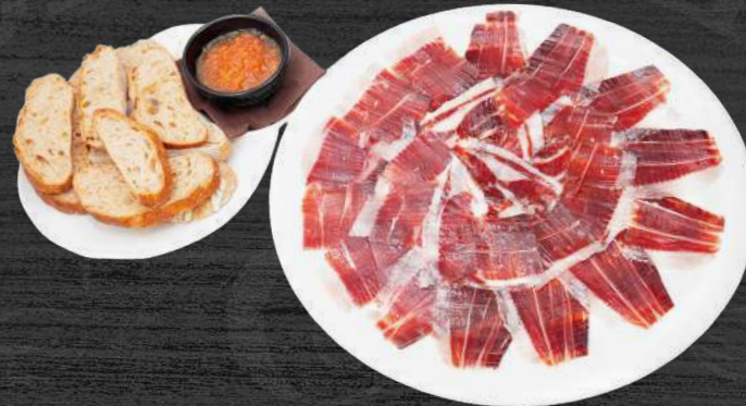
Jamon ibérico de bellota cortado a cuchillo con tostas de pan tumaca. P.V.P. 21,00 €