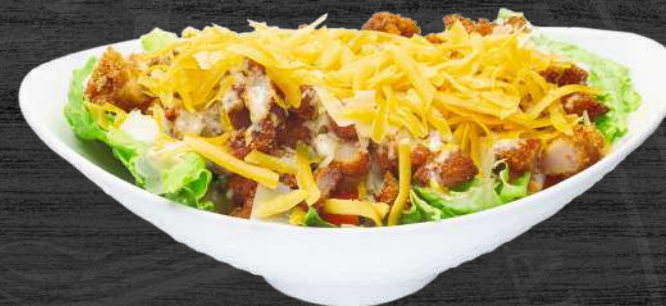
Ensalada Cesar de pollo crujiente Especial TONEL P.V.P. 15,00 €