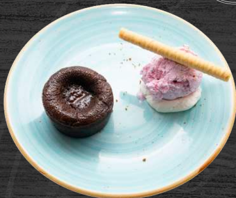
Volcán de chocolate caliente con helado.