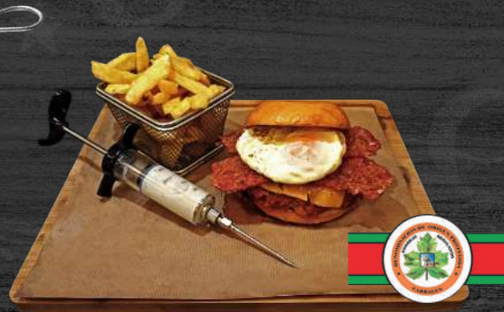
Hamburguesa de picadillo "ganadería Cabrero."

Con cebolla caramelizada queso cheddar; huevo y bacon, inyectada con queso cabrales más valorado del mundo.