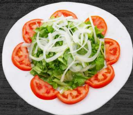
Ensalada LTC. Lechuga Asturiana, tomate y cebolla. P.V.P. 7,50 €