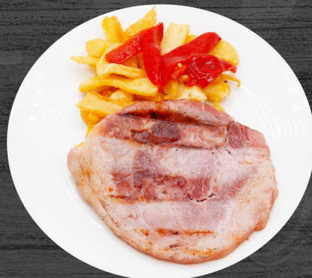
Lacón braseado con patatas fritas y piquillo. P.V.P. 13,50 €