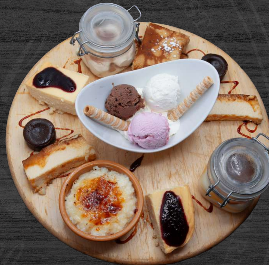
Ruleta de postres variados. P.V.P. 24,00 €