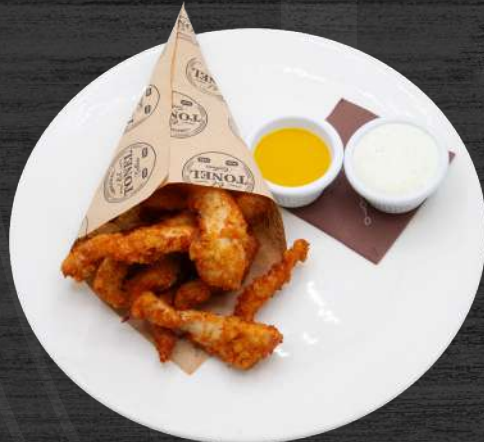
Fingers de pitu con salsa mostaza dulce y ali-oli. P.V.P. 16,50 €