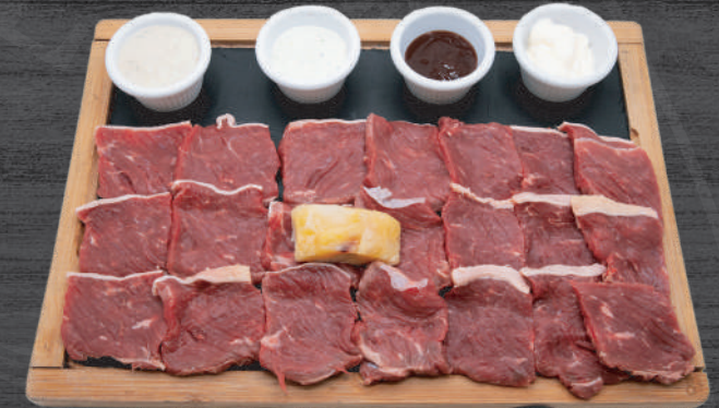
Tabla de lomo bajo de vaca madurada totalmente limpio para hacer a la piedra con sus diferentes salsas y patatas fritas. P.V.P. 38,50 €