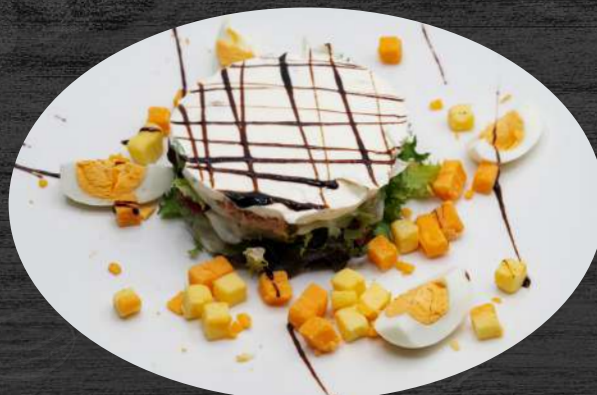
Ensalada mimosa. Lechuga, tomate, cebolla, huevo cocido, atún, queso y mayonesa. P.V.P. 13,50 €