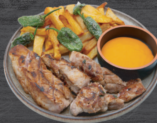
Lagarto a la brasa con patatas fritas y mojo picón. P.V.P. 18,50 €