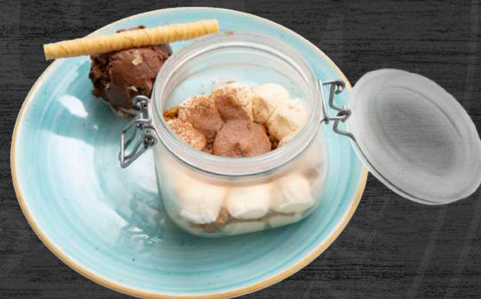
Vasito de tiramisú estilo tonel con su helado.