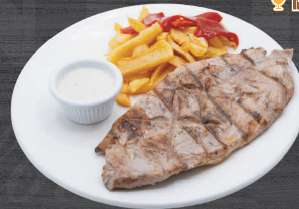
Solomillo ibérico a la brasa con salsa cabrales, patatas fritas y piquillo. P.V.P. 18,70 €