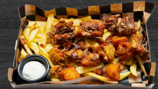
Pollo al ajillo con mucho ajo y ali-oli. P.V.P. 17,50 €