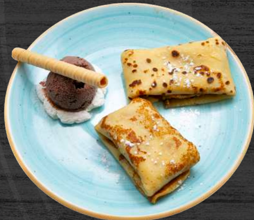
Ravioli de frixuelos rellenos de crema de turrón de Xixona y helado.