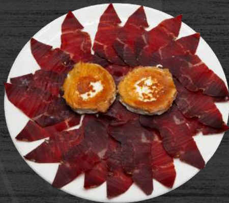
Cecina de Ezequiel con queso de cabra a la placha. P.V.P. 19,50 €