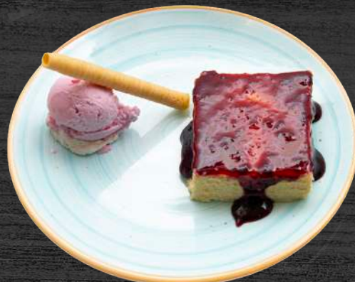
Tarta de queso casera con mermelada de arándanos y helado.