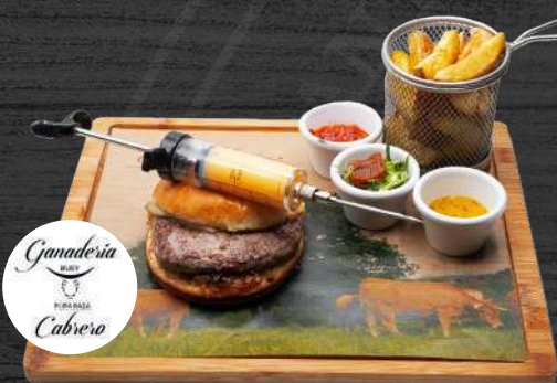
Hamburguesa de buey "ganadería Cabrero."