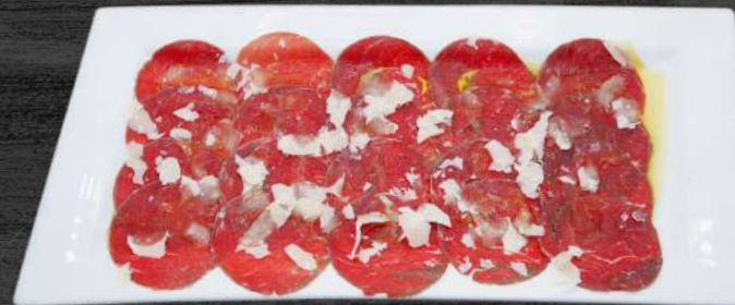
Carpaccio de buey con lascas de parmesano y aceite de arbequina. P.V.P. 20,00 €