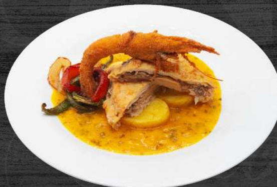
Cachopo de merluza relleno de setas, gulas y langostinos con salsa marinera.