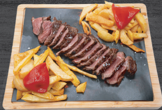
Entrecot de vaca madurada 30 días a la parrilla con patatas fritas y pimientos del piquillo P.V.P. 24,50 €