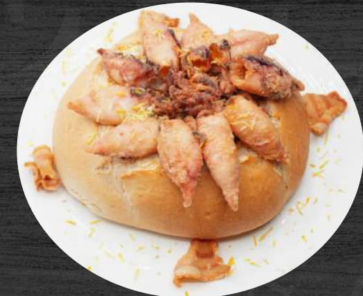
Chipirones al estilo "Cabrero" en hogaza de pan recién hecha. P.V.P. 17,50 €