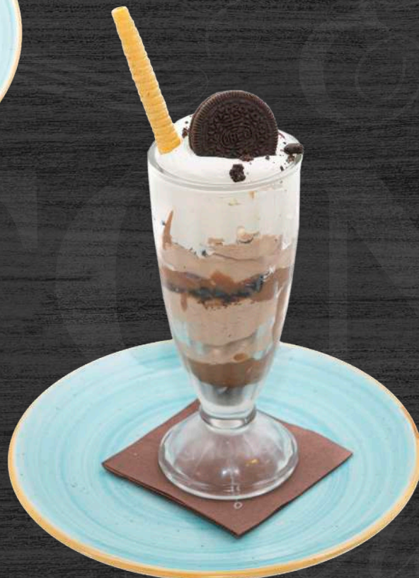
Copa de Oreo con pepitas de chocolate. P.V.P. 6,60 €