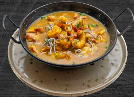
Sartén de la Costa. Gambas, gulas, chipirones y patata panadera en salsa marinera.