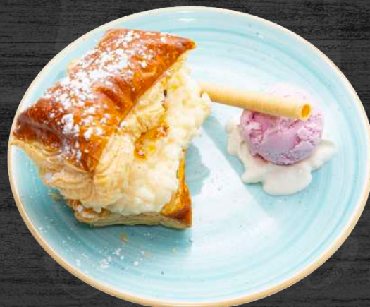
Milhoja crujiente rellena de arroz con leche y helado.