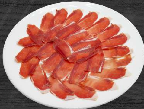
Jamón de Ezequiel cortado a cuchillo. P.V.P. 16,00 €