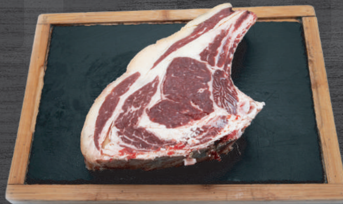
Chuletón de Vaca Rubia Asturiana con patatas fritas y pimientos del piquillo. P.V.P 65,00€/kg