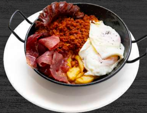
Sarten de Villamiana, mi pueblo. Picadillo ganadería Cabrero, huevos, jamón, chorizo y patatas.