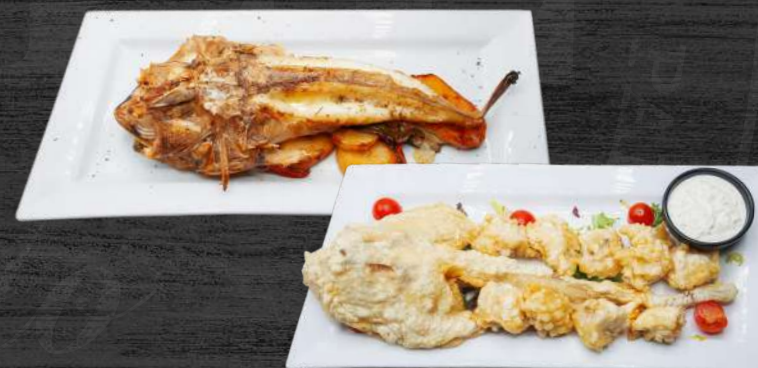
Pixín de ración al horno / a la espalda / en fritos.