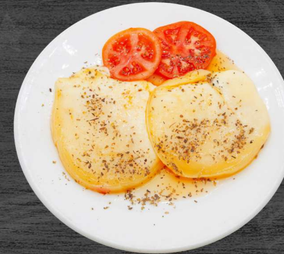
Queso provolone con tomate, AOVE y oregano. P.V.P. 14,00 € 1/2 Ración: 8,50 €