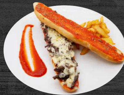
Tosta de tiras de picanha de buey con queso vidiago y patatas fritas.