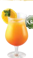
Téquila Sunrise Téquila Mexicaine, jus d'orange, grenadine