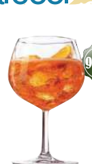
Spritz Prosecco, eau gazeuse, orange fraîche, Apérol