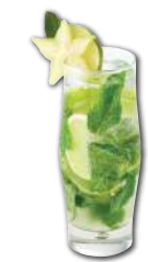
Virgin Mojito Menthe fraîche, citron vert, sucre et eau gazeuse