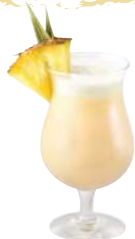
Coconut King Délite des îles au jus d'ananas et à la crème, saveur coco