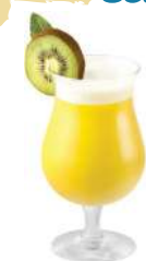
Caribbean Sun Tourbillon exotique au jus d'orange, parfums mangue, fruit de la passion, papaye et kiwi