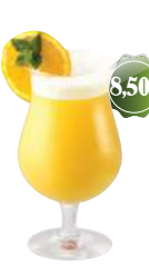
Sex in the Beach Vodka, jus d'orange, jus d'ananas, parfum fruits de la passion, pêche, melon