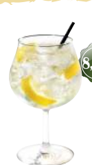
Gin Tonic Gin, eau tonic, tranche de citron