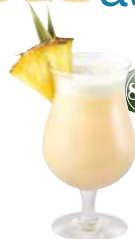
Piña Colada Rhum blanc, Rhum ambré, jus d'ananas, lait de coco