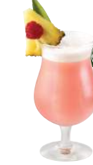
Bikini Téquila Mexicaine, Gin, jus d'ananas, saveur pastèque, framboise, citron