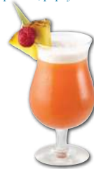
Paradise Dream Jus d'ananas, cascade de saveurs fraise, framboise, grenadine et pêche blanche