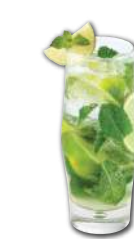
Mojito Rhum Havana, menthe fraîche, citron vert, sucre de canne, eau pétillante, angostura