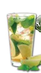
Caipirinha Cachaça brésilienne, sucre, citron vert, glace pilée