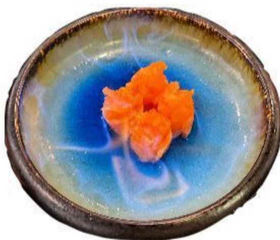
(CENA) 75 GUN FUOCO (Riso,salmone,ceetriolo vino) 4PZ 9,00 EURO SOLO UNA VOLTA