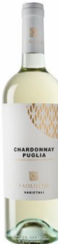
CHARDONNAY IPG PAOLOLEO 10,00 EURO