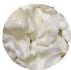
05 NUVOLETTE DI GAMBERI (Gamberi) 4,00 EURO