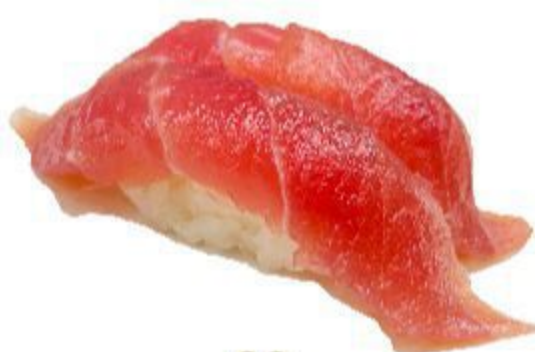
60 NIGIRI TONNO (Riso,tonno) 2PZ 3,50 EURO