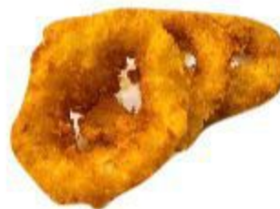
103 CALAMARI FRITTI 8,00 EURO