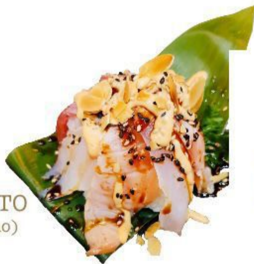
80 CHIRASHI MISTO SCOTTATO (Riso, sashimi, sesamo) 10,00 EURO