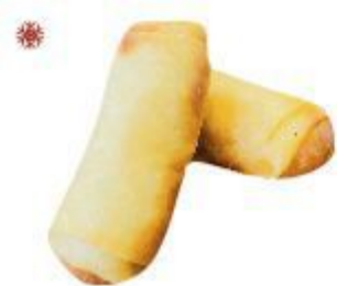
01 INVOLTINI PRIMAVERA (Verdura, il prodotto contiene proteine del latte) 2PZ 2,00 EURO