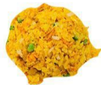
117 RISO AL CURRY (Riso, curry, uovo, verdura) 5,00 EURO