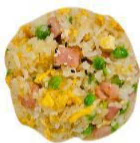
115 RISO ALLA CANTONESE (Riso, prosciutto, uovo, piselli) 6,00 EURO