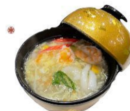
(CENA) 11 ZUPPA CON FRUTTI DI MARE (Uovo, gambero, mais, surimi) 5,00 EURO