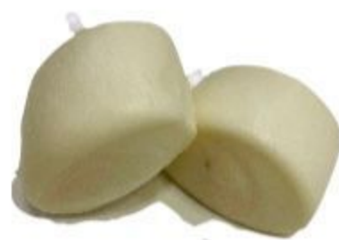
106 PANE BIANCO AL VAPORE 3,50 EURO