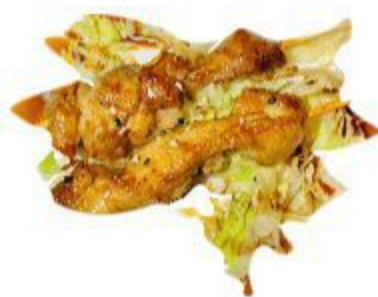
109 SPIEDINI DI POLLO 4,50 EURO