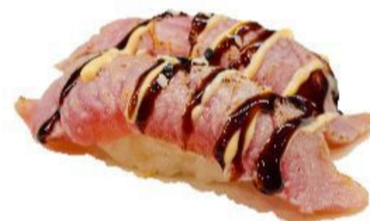
68 NIGIRI TONNO SCOTTATO (Riso,tonno,sesamo) 2PZ 4,00 EURO