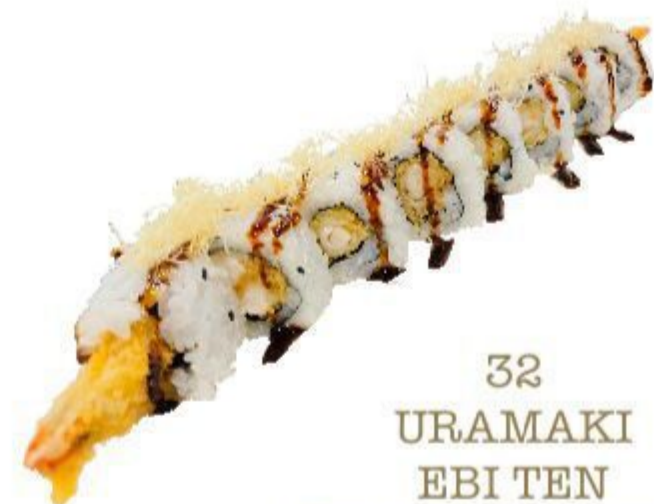
32 URAMAKI EBI TEN (Riso,alga,gambero,crispy) 8PZ 10,00 EURO