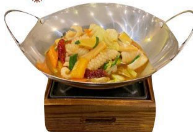
(CENA) 146 SCODELLA DI FUOCO CON CALAMARI (Calamari,zucchine,peperocini, carota,bamboo) 9,00 EURO