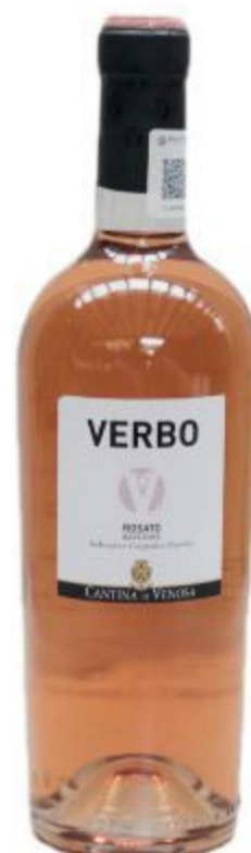
VERBO ROSATO BASILICATA CANTINA DI VENOSA 18,00 EURO