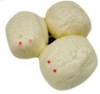
144 PANE RABBIT (Farina,uova,latte) 3,50 EURO 2 PZ