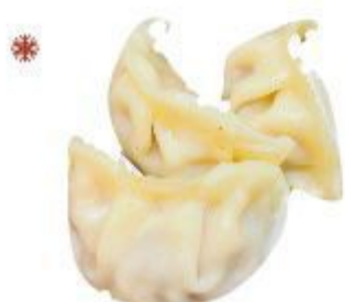
03 RAVIOLI AL VAPORE (Maiale) 3PZ 3,00 EURO