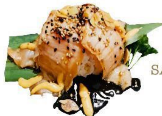
81 CHIRASHI SALMONE SCOTTATO (Riso, salmone, sesamo) 10,00 EURO