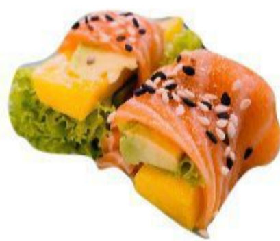
(CENA) 73 STICK MANGO (Salmone,avocado,insalata,ma ngo,sesamo,salsa) 5,00 EURO SOLO UNA VOLTA