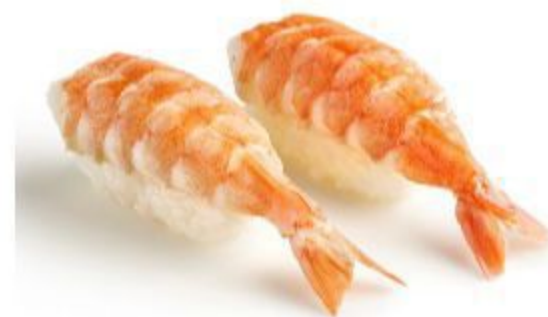
62 NIGIRI GAMBERO (Riso,gambero) 2PZ 3,50 EURO