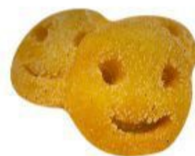
107 CROCHETTE DI PATATE 5,00 EURO