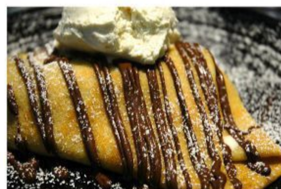
N605 CREPE 3,00 EURO