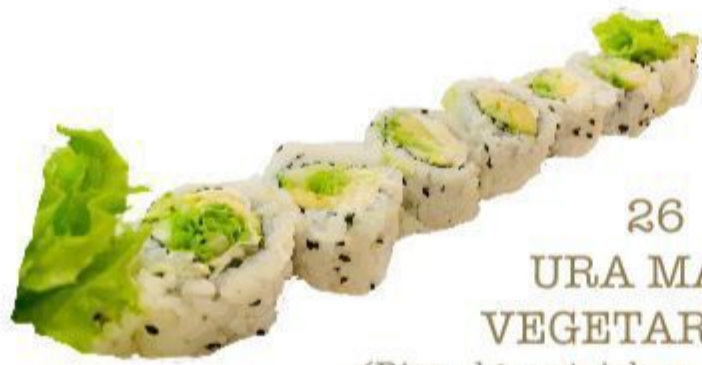
26 URA MAKI VEGETARIANO (Riso,alga,cetriolo,avocado,insalata, Philadelphia,sesamo) 8PZ 8,00 EURO