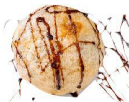
N602 GELATO FRITTO 3,00 EURO