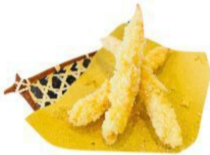
100 TEMPURA DI GAMBERI 8,00 EURO