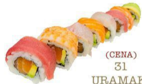
(CENA) 31 URAMAKI RAINBOW (Riso,alga,gambero,tonno,salmone,branzino Avocado) 8PZ 12,00 EURO