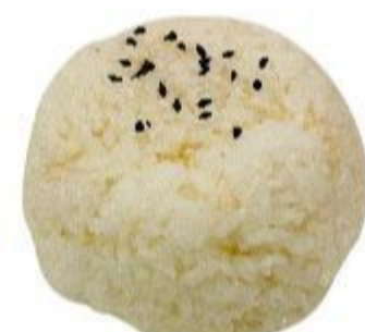
120 RISO BIANCO 2,50 EURO