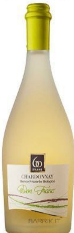
CHARDONNAY FRIZZANTE 100% PUGLIA 14,00 EURO