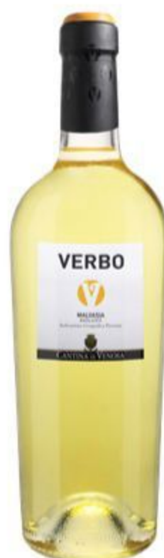
VERBO BIANCO MALVASIA BASILICATA IGP 18,00 EURO