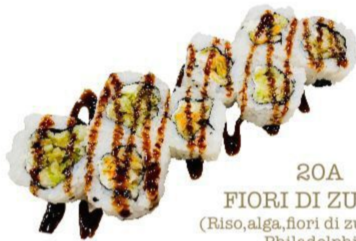
20A FIORI DI ZUCCHI (Riso, alga, fiori di zucchini fritti Philadelphia) 8PZ 8,00 EURO