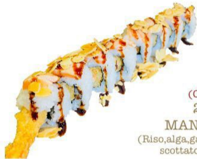
(CENA) 26A MANDORLA (Riso, alga, gambero, salmone scottato, mandorla) 8PZ 10,00 EURO