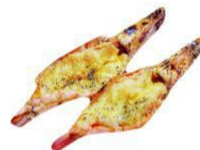
(CENA) 114 GAMBERONI GRIGLIATI 10,00 EURO SOLO UNA VOLTA