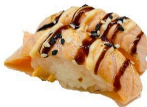
67 NIGIRI SALMONE SCOTTATO (Riso,salmone,sesamo) 2PZ 3,50 EURO