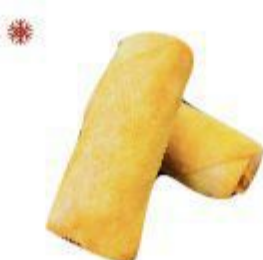
(CENA) 02 INVOLTINI DI GAMBERI (Gambero, il prodotto contiene proteine del latte) 2PZ 2,50 EURO