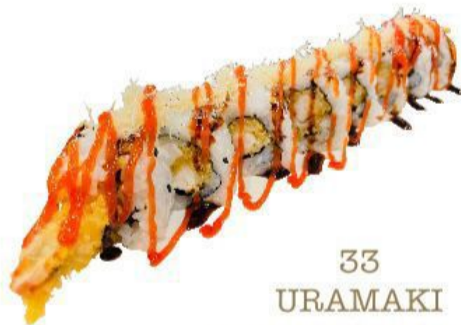
33 URAMAKI EBI TEN SPECIALE (Riso,alga,gambero,ketchup,crispy) 8PZ 12,00 EURO