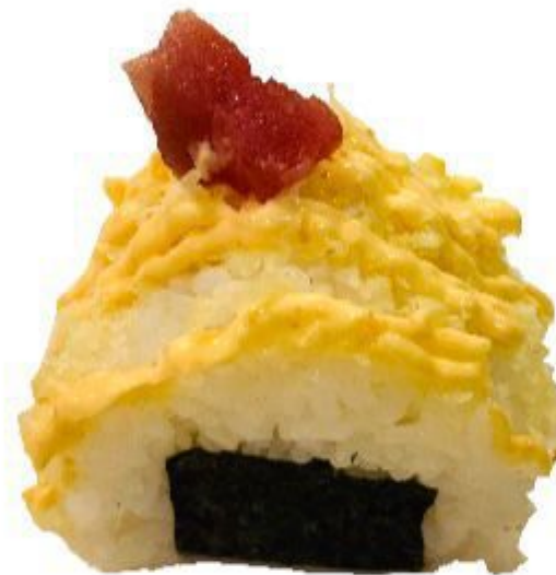
57 ORIGINI TONNO SPICY (Riso,alga,tonno,salsa) 5,00 euro