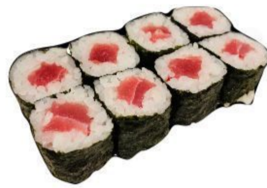
13 HOSOMAKI TONNO (Riso, alga, tonno) 8PZ 3,50 EURO