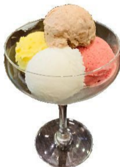
N601 GELATO 3 GUSTI NOCCIOLA/VANIGLIA/ CIOCCOLATO/FRAGOLA 2,50 EURO