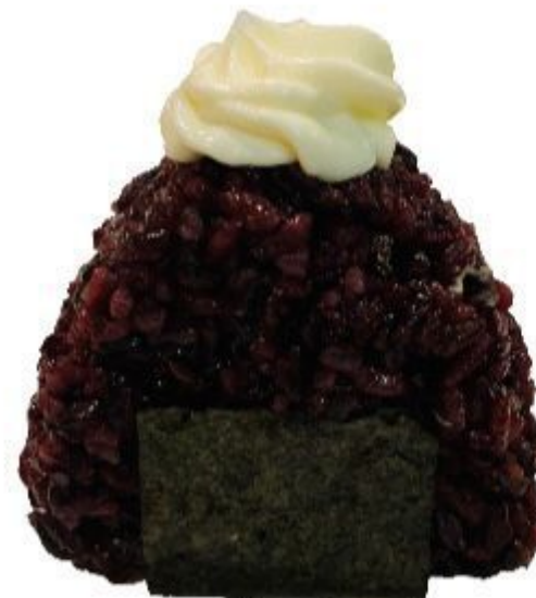
58 ORIGINI RISO NERO (Riso,alga,salmone cotto,philadelphia) 6,00 EURO