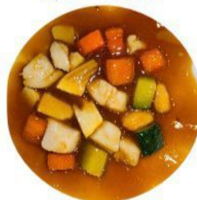
135 POLLO ALLE MANDORLE 7,00 EURO