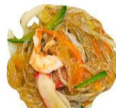
127 SPAGHETTI DI SOIA CON FRUTTI DI MARE (Germogli di fagiolo) 7,00 EURO