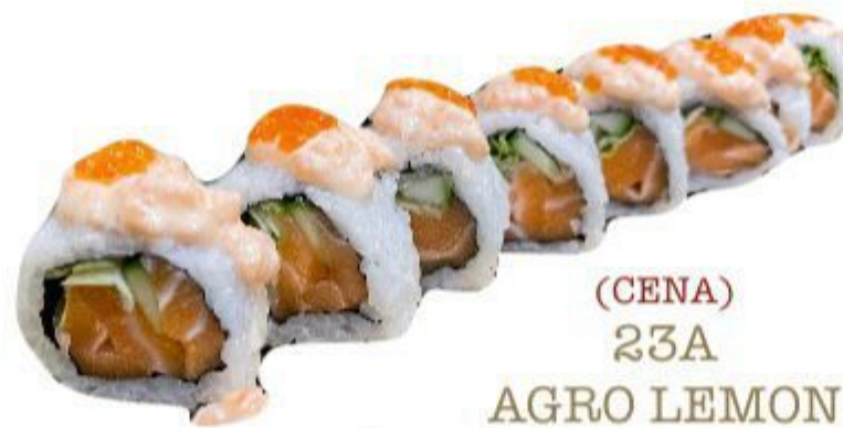
(CENA) 23A AGRO LEMON (Riso, alga, limone, cetriolo, insalata salmone) 8PZ 10,00 EURO