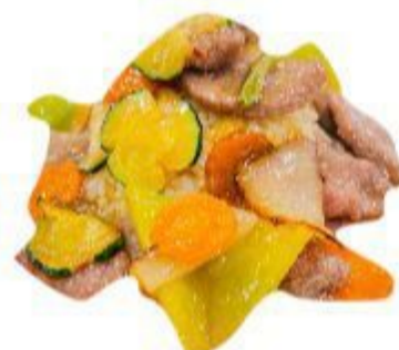
119 RISO SPECIALE CON MANZO (Riso, manzo, verdura) 6,00 EURO