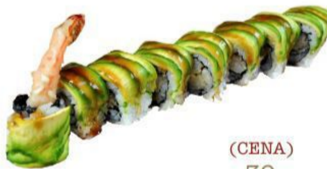
(CENA) 30 URAMAKI DRAGON (Riso,alga,avocado,gambero) 8PZ 12,00 EURO