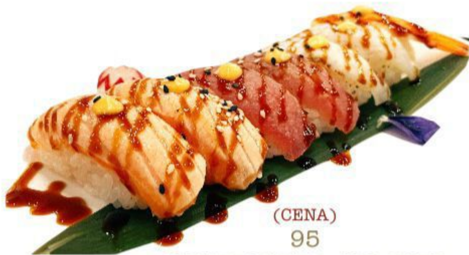
(CENA) 95 NIGIRI MISTO ARROSTO (7 nigiri) 12,00 EURO