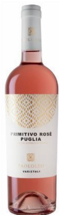
PRIMITIVO ROSÈ PUGLIA IGP 12,00 EURO