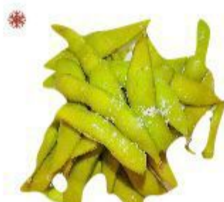
06 EDAMAME (Foglioli di soia) 3,50 EURO