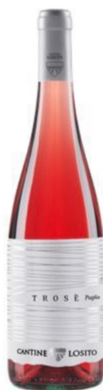
TROSÈ PUGLIA VINO BIOLOGICO 13,00 EURO