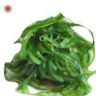
07 WAKAME (ALGA) 4,50 EURO