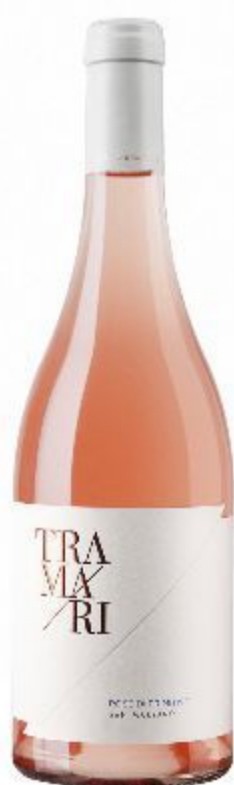
TRAMRI ROSÉ DI PRIMITIVO 18,00 EURO