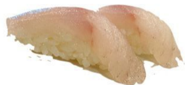
61 NIGIRI BRANZINO (Riso,branzino) 2PZ 3,00 EURO