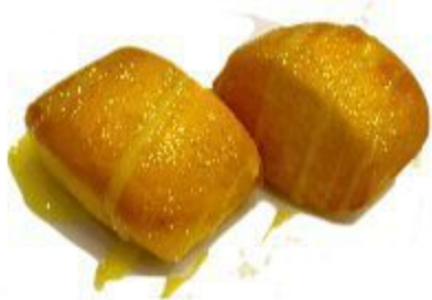
105 PANE FRITTO (SALSA LATTE CONDENSATO) 3,50 EURO