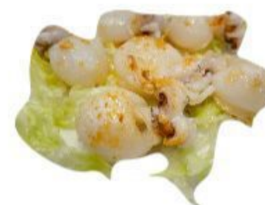
(CENA) 113 CALAMARI GRIGLIATI 8,00 EURO