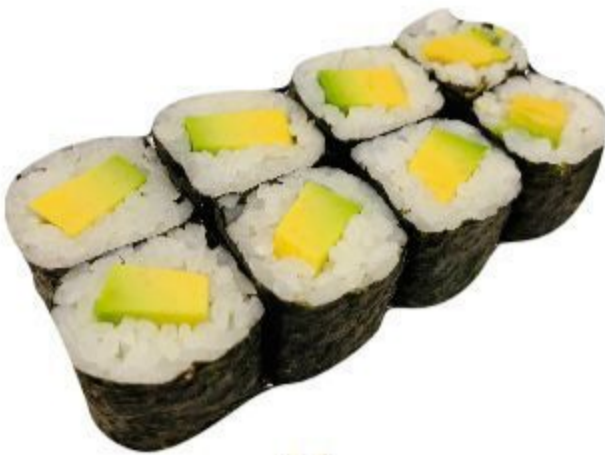
14 HOSOMAKI AVOCADO (Riso, alga, avocado) 8PZ 3,50 EURO