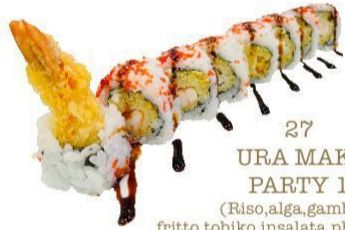
27 URA MAKI PARTY 1 (Riso,alga,gambero fritto,tobiko,insalata,philadelphia) 8PZ 12,00 EURO