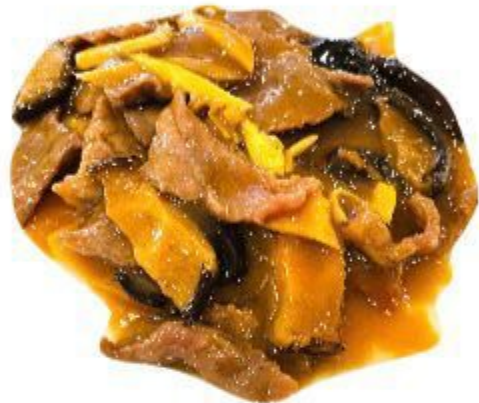
128 MANZO CON FUNGHI E BAMBOO 8,00 EURO