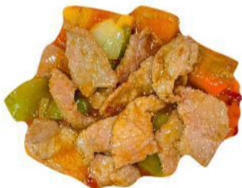
130 MANZO PICCANTE 8,00 EURO