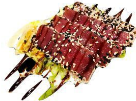
(CENA) 141 TATAKI TONNO 7,00 EURO