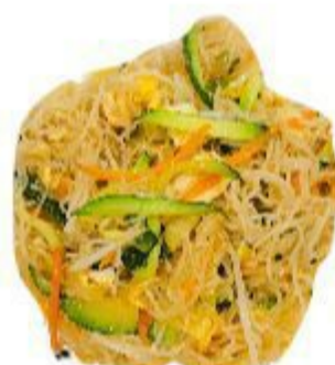
122 SPAGHETTI DI RISO CON VERDURE (Verdure, uovo, germogli di fagiolo) 5,00 EURO