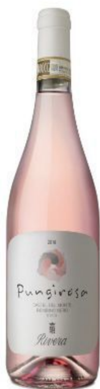
PUNGIROSA ROSATO 14,00 EURO