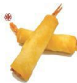
(CENA) 02A STICK GAMBERI (Gambero, il prodotto contiene proteine del latte) 2PZ 3,00 EURO