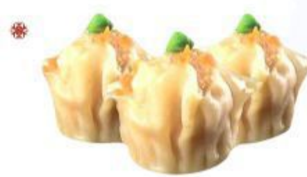
(CENA) 04 SHAO MAI (Gamberi, carne, verdura) 3PZ 4,00 EURO