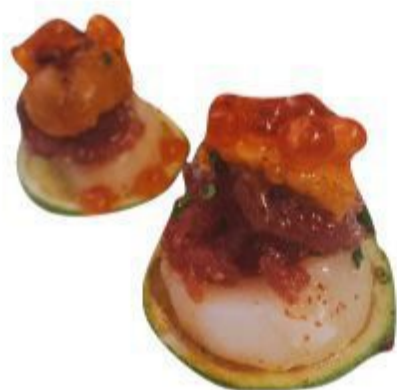
(CENA) 70 YUKO (Riso,scaloppine,tonno Ikura) 2PZ 6,00 EURO SOLO UNA VOLTA/PERSONA