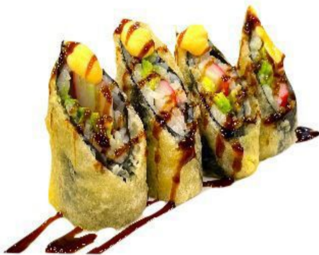
17 HOSOMAKI FOUR SEASONS (Riso, alga, surimi, avocado, salsa piccante, teriyaki) 4PZ 5,00 EURO