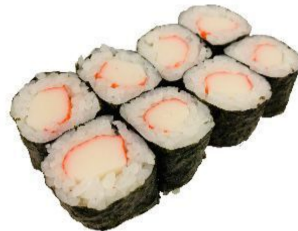
16 HOSOMAKI SURIMI (Riso, alga, surimi) 8PZ 3,50 EURO