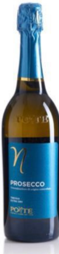
PROSECCO TREVISO EXTRA DRY 13,00 EURO