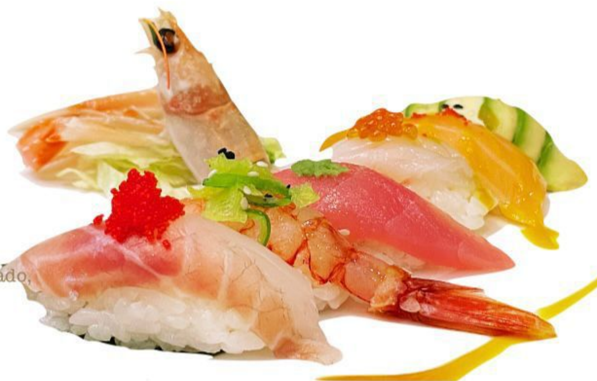
NIGIRI CHEF (6 Nigiri) (Scampi crudo, gambero crudo, tonno, salmone, Salsa di mango, avocado, wasabi, tobiko) 15,00 EURO