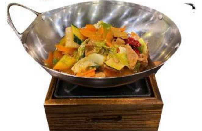
(CENA) 147 SCODELLA DI FUOCO DI MANZO (manzo,zucchine,peperocini, arota,bamboo) 7,00 EURO