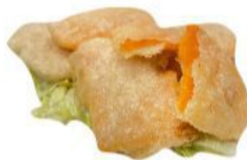
101 TEMPURA DI PATATE DOLCE 8,00 EURO