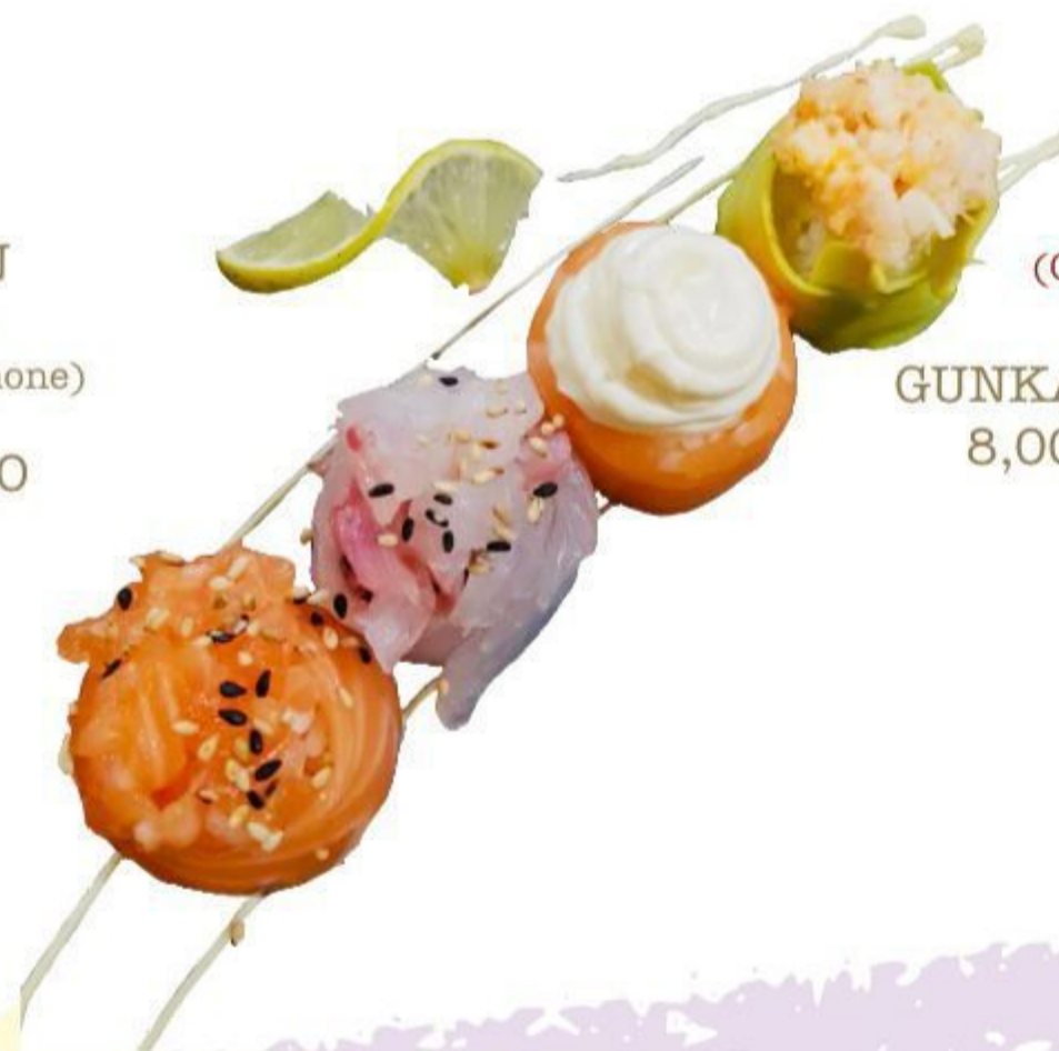
(CENA) 76 GUNKAN MISTO 8,00 EURO