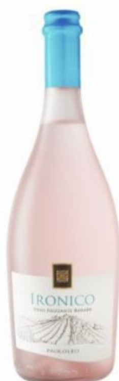
IRONICO FRIZZANTE ROSATO 14,00 EURO