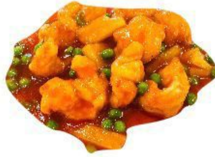
(CENA) 143 SWEET AND SOUR GAMBERI 8,00 EURO