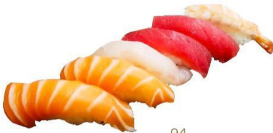
94 NIGIRI MISTO (7 nigiri) 9,00 EURO