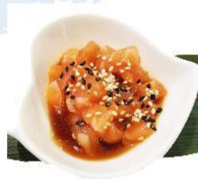
82 TARTARE SALMONE (Salmone, sesamo, in salata) 5,00 EURO