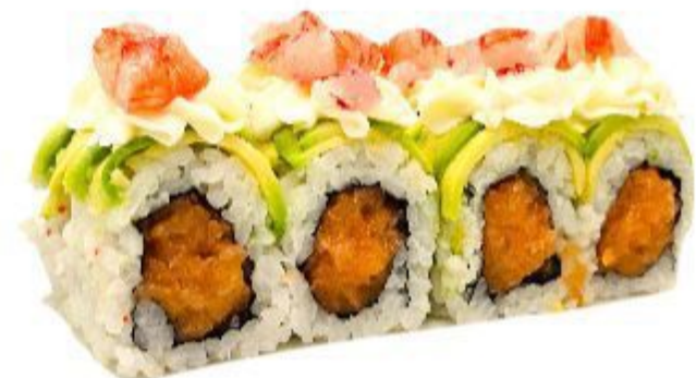
(CENA) UNA VOLTA A PERSONA 37A GAMBERO ROSSO (Riso, alga, gambero rosso crudo, Avocado, philadelphia, salmone) 12,00 EURO