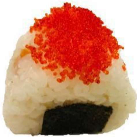
53 ORIGINI SALMONE (Riso,alga,salmone,avocado) 4,00 EURO