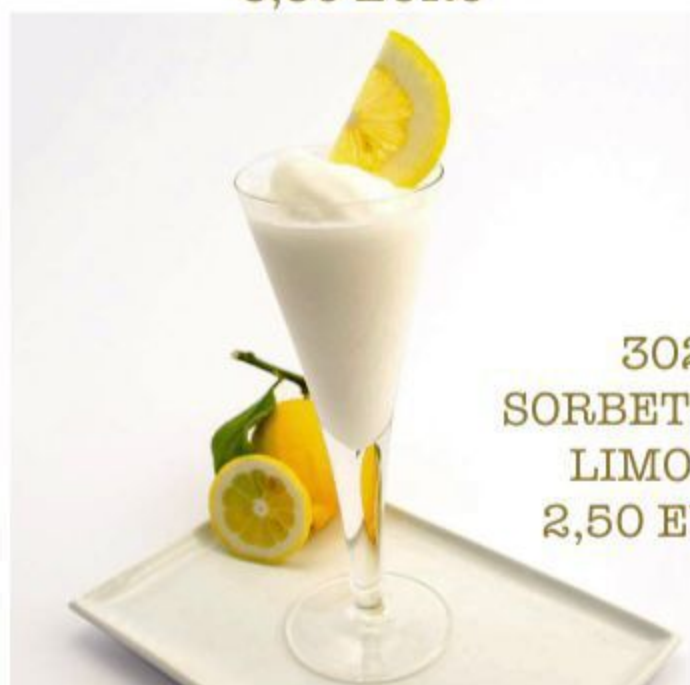
302 SORBETTO AL LIMONE 2,50 EURO