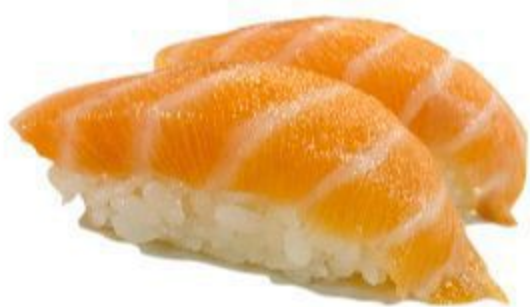
59 NIGIRI SALMONE (Riso,salmone) 2PZ 3,50 EURO