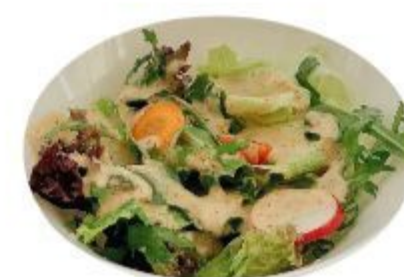
08 INSALATA (Insalata, olio, sale) 4,50 EURO