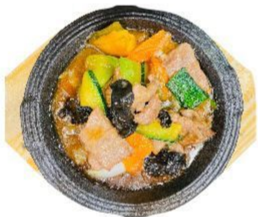
(CENA) 129 MANZO ALLA PIASTRA 8,00 EURO