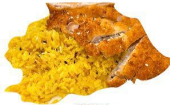
(CENA) 132 POLLO FRITTO CON RISO AL CURRY 8.00 EURO