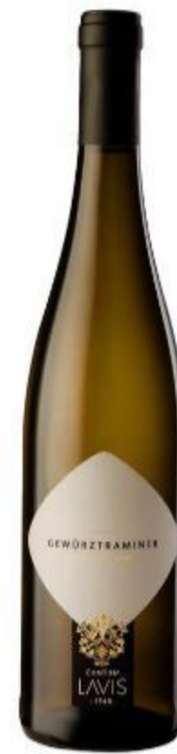
GEWÜRZTRAMINER TRENTINO DOC VINO BIANCO 18,00 EURO