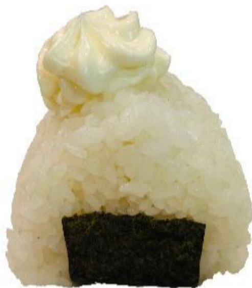
55 ORIGINI PHILADELPHIA (Riso,alga,salmone,philadelphia) 4,00 EURO