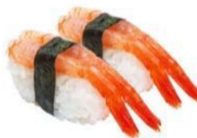
(CENA) 65 NIGIRI AMA EBI (Riso,gambero crudo) 2PZ 4,00 EURO