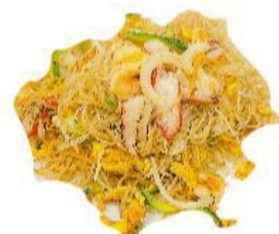
123 SPAGHETTI DI RISO CON FRUTTI DI MARE (Frutti di mare, uovo, verdura) 6,00 EURO