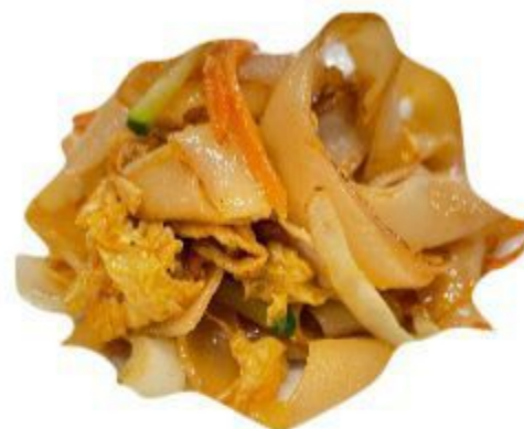
134 VERMICELLI DI RISO (Vermicelli di riso,uovo,verdure) 6,00 EURO