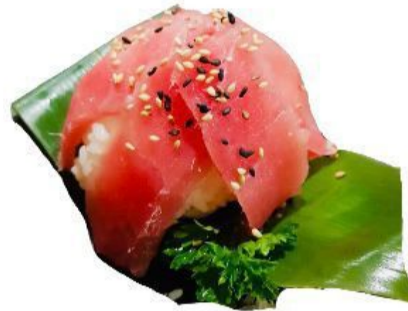
78 CHIRASHI SALMONE (Riso, tonno, sesamo) 8,00 EURO