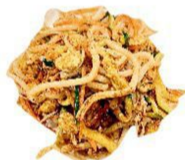
124 UDON CON VERDURE (Spaghetti, uovo, verdura) 5,00 EURO