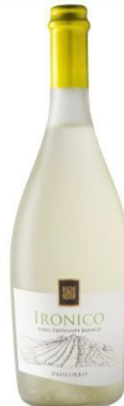
IRONICO FRIZZANTE PAOLOLEO 13,00 EURO