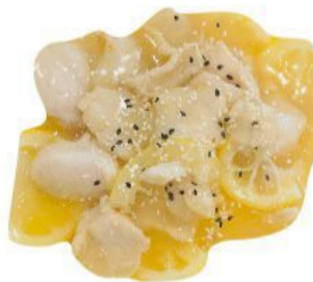
133 POLLO AL LIMONE 7,00 EURO