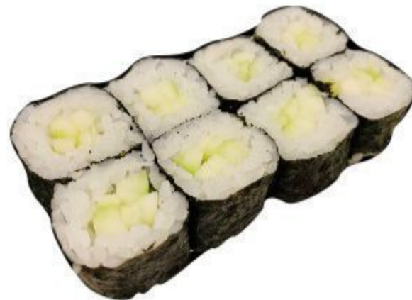
15 HOSOMAKI CETRIOLO (Riso, alga, cetriolo) 8PZ 3,50 EURO