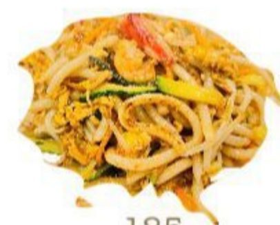
125 UDON CON FRUTTI DI MARE (Spaghetti, uovo, frutti di mare) 6,00 EURO