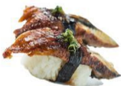
(CENA) 64 NIGIRI ANQUILLA (Riso,anguilla) 2PZ 4,00 EURO