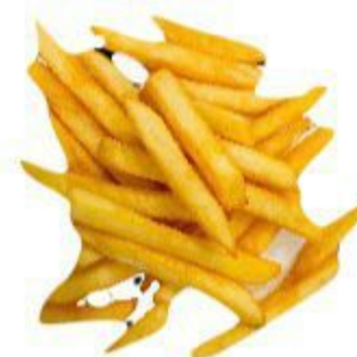
108 PATATINE FRITTE 4,00 EURO