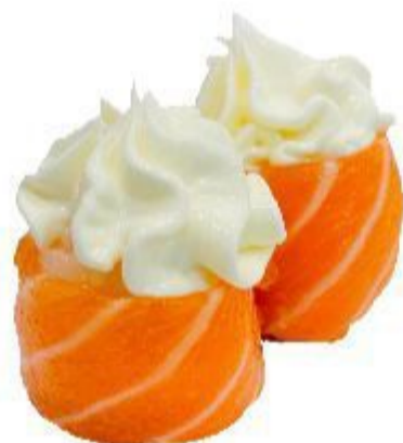
71 GUNKAN PHILADELPHIA (Riso,salmone,philadelphia) 2PZ 5,00 EURO