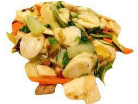
149 GNOCCHI DI RISO CON LE VERDURE 5,00 EURO