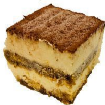
N604 TIRAMISÙ 3,50 EURO