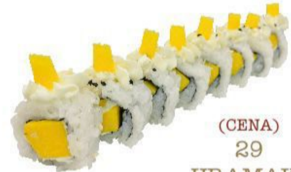
(CENA) 29 URAMAKI FANTASIA (Riso,alga,mango,philadelphia,sesamo) 8PZ 12,00 EURO