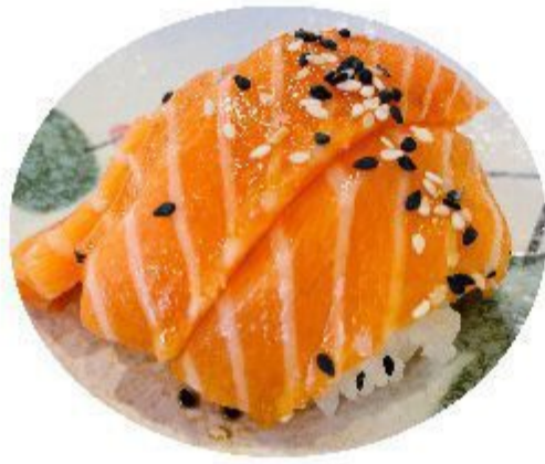
77 CHIRASHI SALMONE (Riso, salmone, sesamo) 7,00 EURO