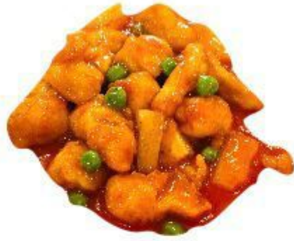
(CENA) 142 POLLO ALL'AGRODOLCE 6,00 EURO