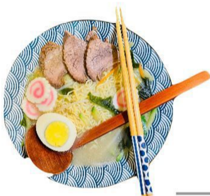
121 RAMEN (Spaghetti, alga, manzo Uovo) 6,00 EURO