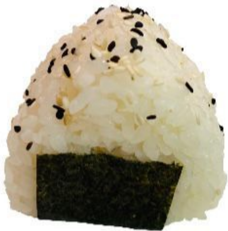
54 ORIGINI TONNO (Riso,alga,tonno,avocado) 4,00 EURO