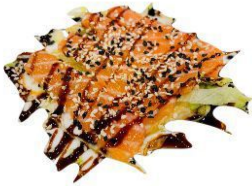
140 TATAKI SALMONE 7,00 EURO