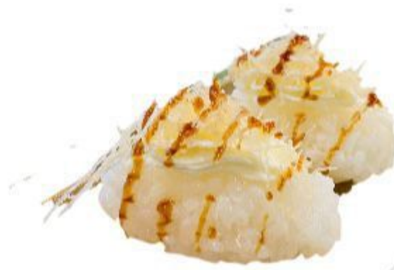
(CENA) 66 NIGIRI PHILADELPHIA (Riso,philadelphia,crispy) 2PZ 3,00 EURO