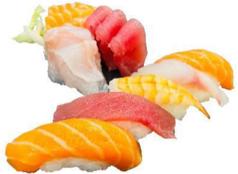
(CENA) 97 SUSHI SASHIMI (5 nigiri, 9 sashimi) 12,00 EURO