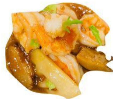
137 GAMBERETTI CON FUNGHI E BAMBOO 8,00 EURO