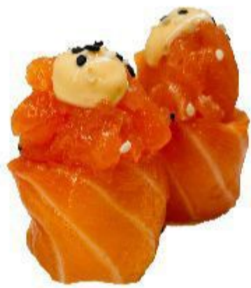
69 GUNKAN SALMONE (Riso,salmone,sesamo) 2PZ 4,00 EURO