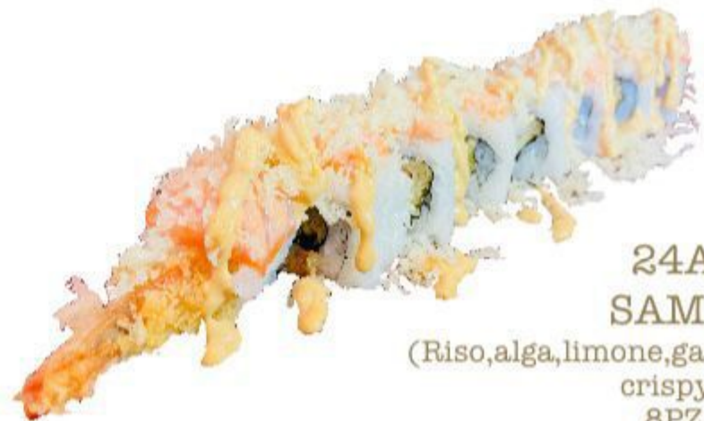
24A SAMA (Riso, alga, limone, gambero, salmone, crispy) 8PZ 10,00 EURO