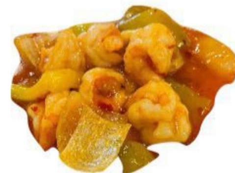
(CENA) 138 GAMBERETTI PICCANTI 8,00 EURO