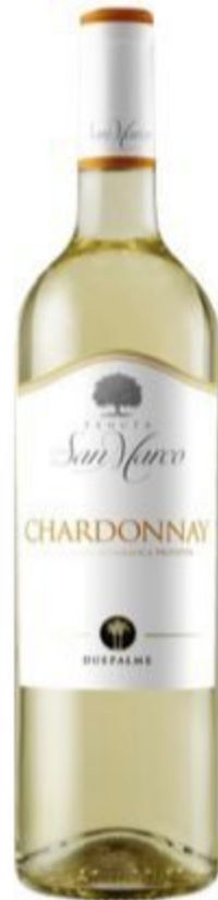
CHARDONNAY CANTINE DUE PALME 12,00 EURO