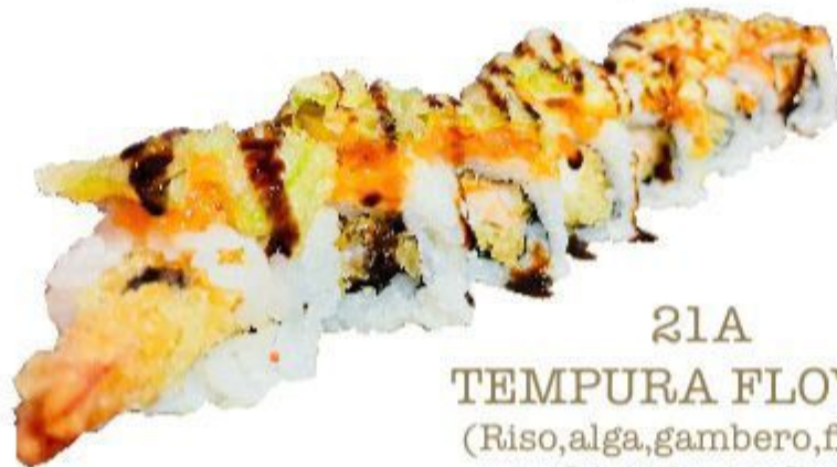
21A TEMPURA FLOWER (Riso, alga, gambero, fiori di zucchini, tartari salmone) 8PZ 10,00 EURO