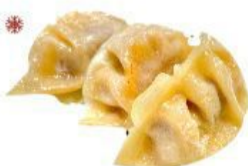
(CENA) 03A RAVIOLI ALLA PIASTRA (Maiale) 3PZ 3,50 EURO