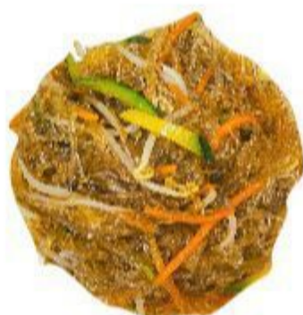
126A SPAGHETTI DI SOIA CON VERDURE (Germogli di fagiolo) 5,00 EURO