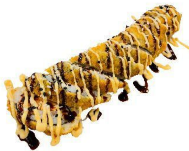
18 HOSOMAKI FRITTO (Riso, alga, salmone, salsa piccante, teriyaki, sesamo) 8PZ 5,00 EURO