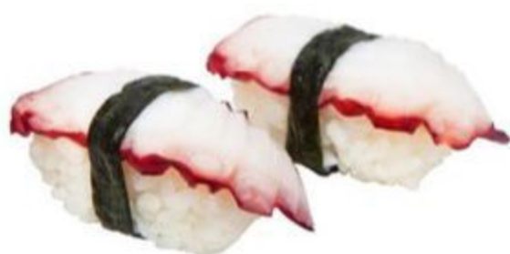
63 NIGIRI POLPO (Riso,polpo) 2PZ 3,50 EURO