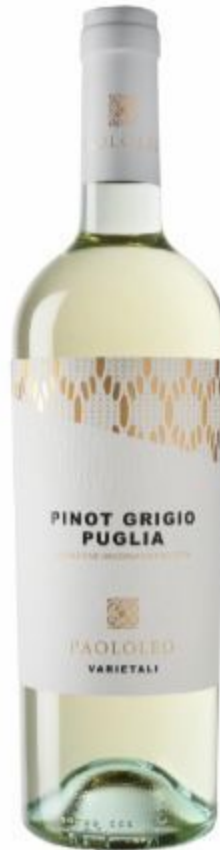
PIONT GRIGIO PAOLOLEO 12,00 EURO