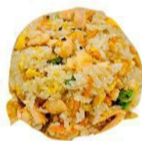
116 RISO AL SALMONE (Riso, salmone, uovo, verdura) 6,00 EURO