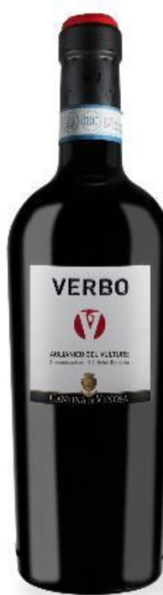
VERBO ROSSO CANTINA DI VENOSA 18,00 EURO