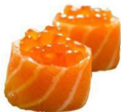
72 GUNKAN IKURA (Riso,ikura,salmone) 2PZ 6,00 EURO