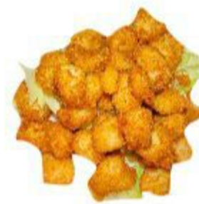
104 POLLO FRITTO 7,00 EURO