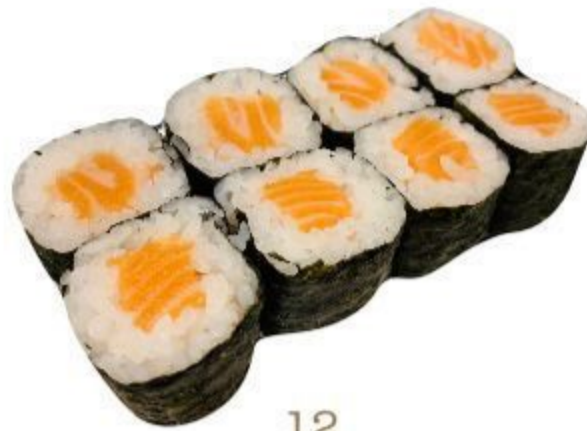
12 HOSOMAKI SALMONE (Riso, alga, salmone) 8PZ 3,50 EURO