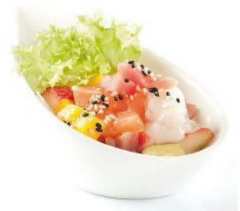
84 TARTARE MISTO (Sashimi, sesa mo, insalata) 8,00 EURO