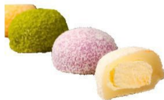
N607 DAFU 2 GUSTI DA SCEGLIERE MATCHA/FRAGOLA/SESAMO NERO/COCCO/CIOCCOLATO 4,00 EURO