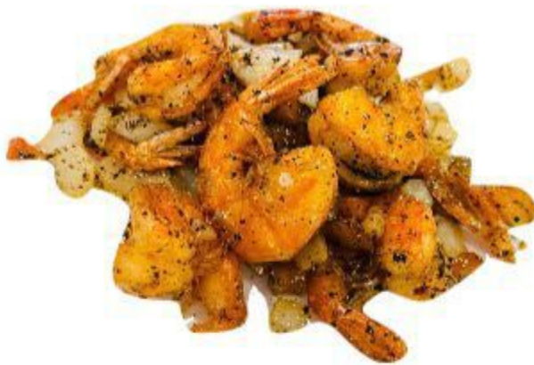
(CENA) 136 GAMBERETTI SALE E PEPE 8,00 EURO