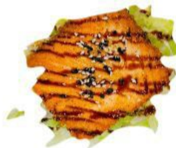
112 SALMONE GRIGLIATO 8,00 EURO