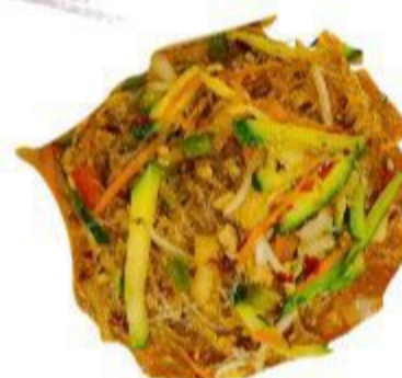
126 SPAGHETTI DI SOIA PICCANTI (Spaghetti, maiale, verdura, germo gli di fagiolo) 5,00 EURO