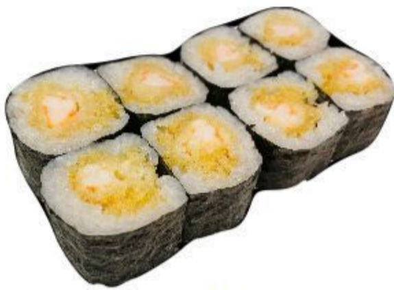
11 HOSOMAKI GAMBERO FRITTO (Riso, alga, gambero) 8PZ 8,00 EURO