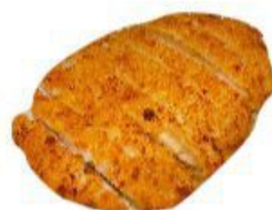
150 CROCHETTE DI POLLO 5,00 EURO