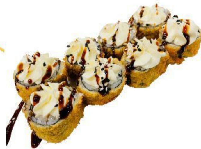
(CENA) 19 HOSOMAKI SPECIALE (Riso, alga, salmone, philadelphia, sesamo) 8PZ 8,00 EURO