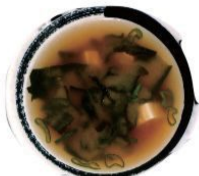
10 ZUPPA DI MISO (Miso, alga, tofu) 4,00 EURO