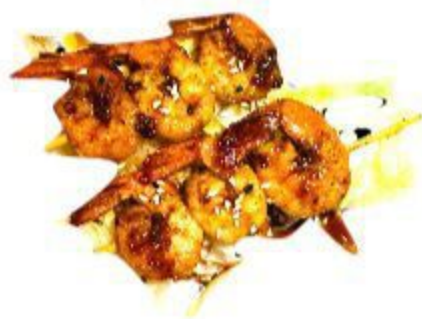
110 SPIEDINI DI GAMBERI 5,00 EURO