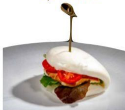
(CENA) 151 BAO CHICKEN (pane conchiglia a vapore con pollo grigliato insalata e salsa) 5,00 EURO SOLO UNA VOLTA