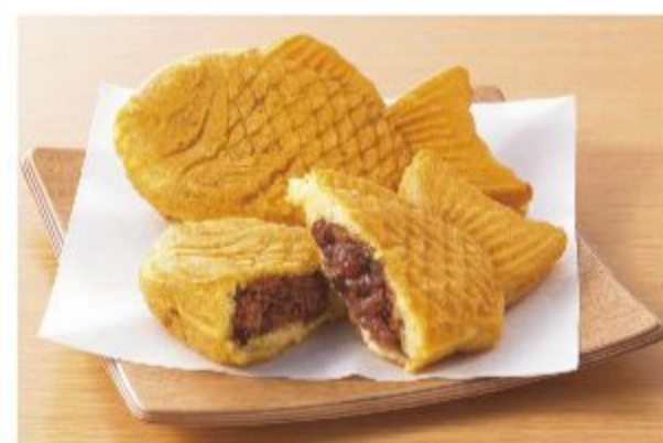
N610 TAIYAKI 1PZ 2,50 EURO