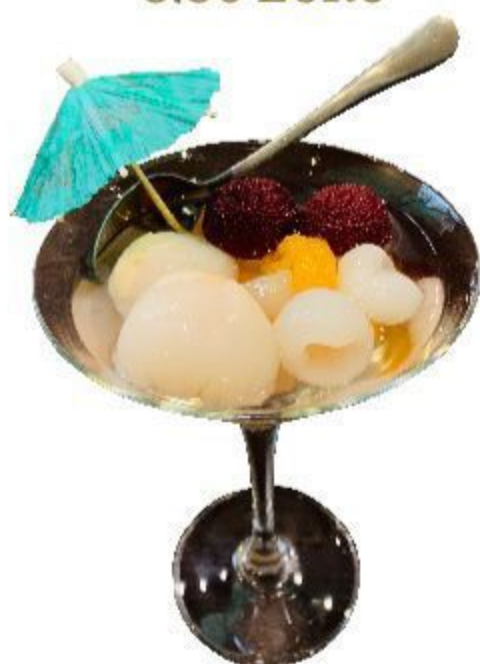
N609 FRUTTA ALLA STAGIONE CINESE 3,50EURO