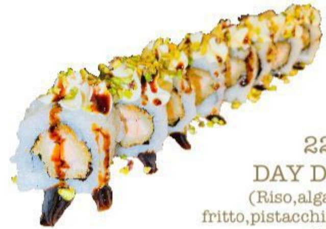
22A DAY DREAM (Riso, alga, salmone fritto, pistacchio, Philadelphia) 8PZ 10,00 EURO