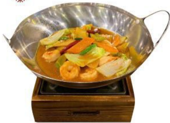
(CENA) 145 SCODELLA DI FUOCO AI GAMBERETTI (Gamberetti,carota,peperoni, bamboo) 8,00 EURO