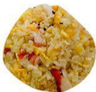
(CENA) 118 RISO SPECIALE AI FRUTTI DI MARE (Riso, frutti di mare, uovo, verdura) 7,00 EURO