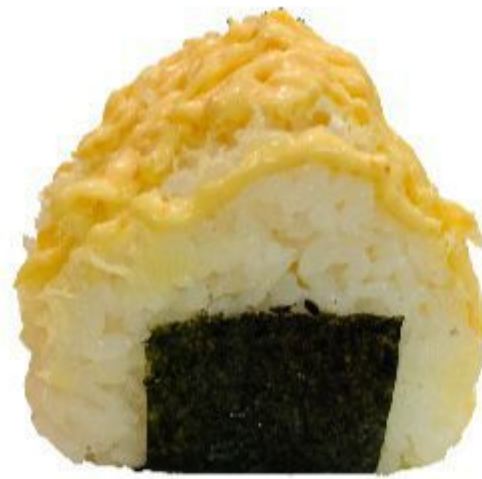
56 ORIGINI SPICY SALMONE (Riso,alga,salmone,crispy,salsa) 4,00 EURO