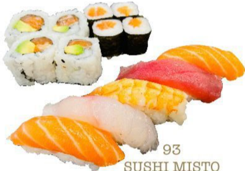
93 SUSHI MISTO (7 nigiri, 4 hosomaki, 4 uramaki) 12,00 EURO