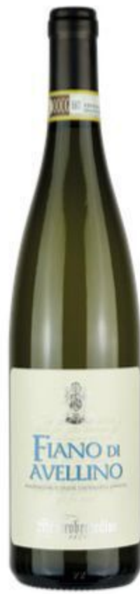
FIANO DI AVELLINO 18,00 EURO