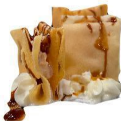
(CENA) 74 MILLE FOGLIE (salmone,philadelphia,) 2PZ 4,00 EURO SOLO UNA VOLTA