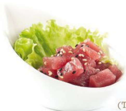
83 TARTARE TONNO (Tonno, sesamo, insalata) 6,00 EURO