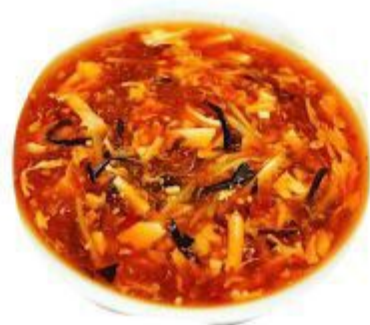
09 ZUPPA AGRO PICCANTE (Verdura, pollo, uovo) 4,00 EURO