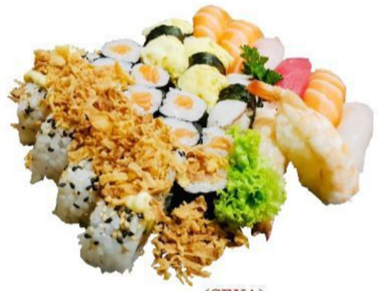
(CENA) 96 SUSHI SPECIALE (10 nigiri, 16 maki) 15,00 EURO