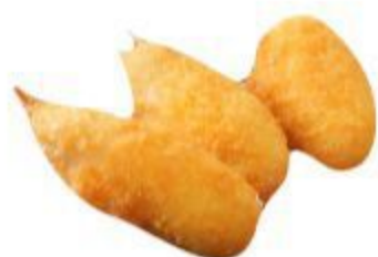
(CENA) 111 CHELE DI GRANCHIO 5,00 EURO