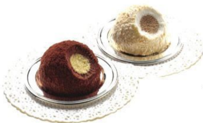
N603 TARTUFO NERO 3,50 EURO