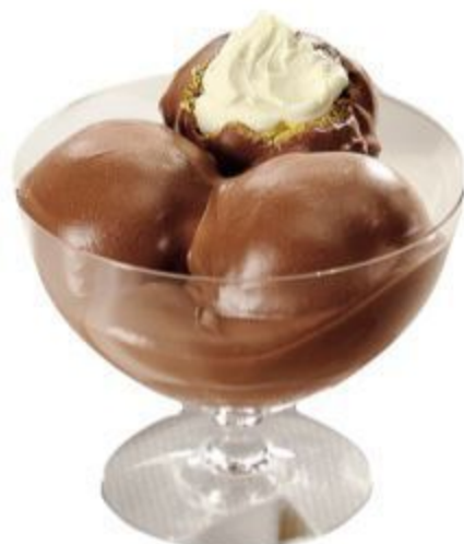
N608 PROFITEROLES CACAO/ CIOCCOLATO FONDENTE 3,50 EURO