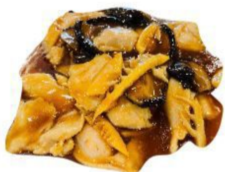
131 POLLO CON FUNGHI E BAMBOO 7,00 EURO