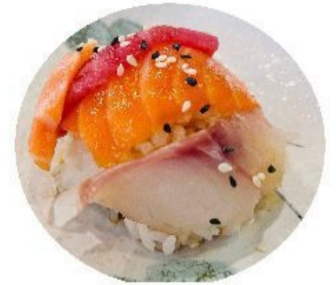
(CENA) 79 CHIRASHI MISTO (Sashimi, riso, sesamo) 10,00 EURO