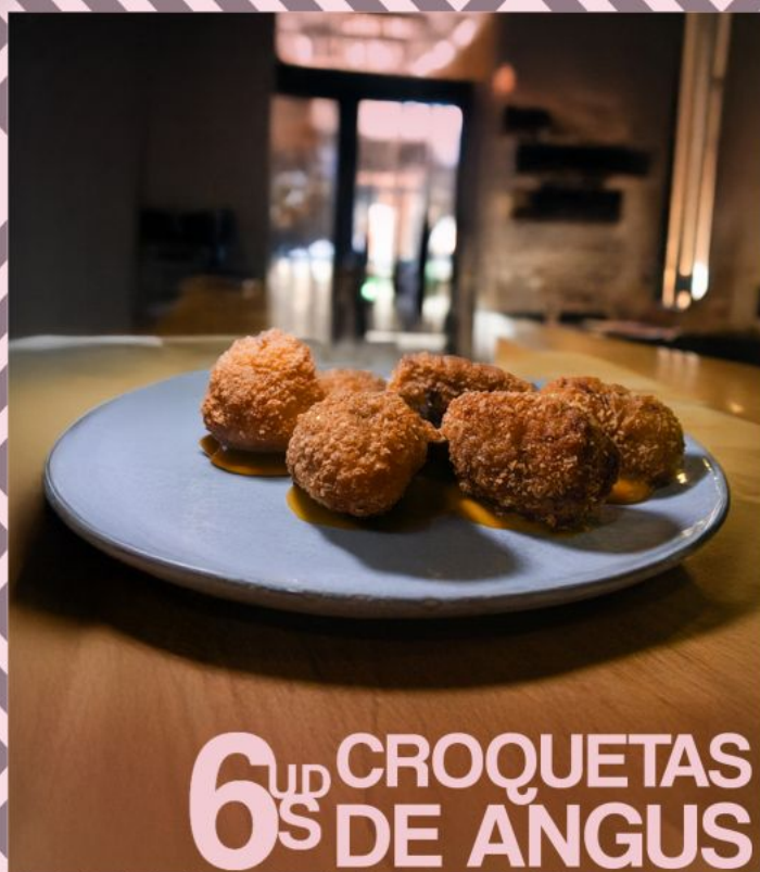
6 UP CROQUETAS S DE ANGUS