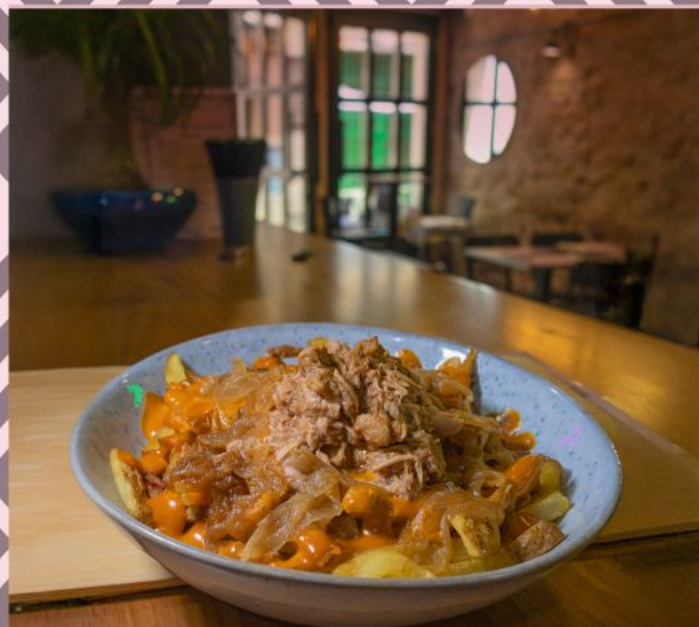
PATATAS SALVAXES XL

CRUJIENTES PATATAS FRITAS BAÑADAS EN NUESTRA SALSA INSTINTO, PULLED PORK Y UNA CAPA DE CEBOLLA CARAMELIZADA