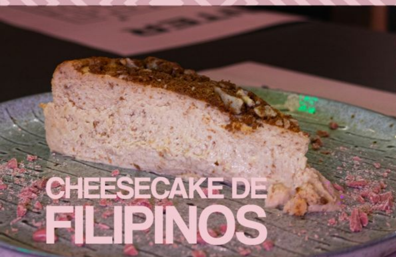
CHEESECAKE DE FILIPINOS