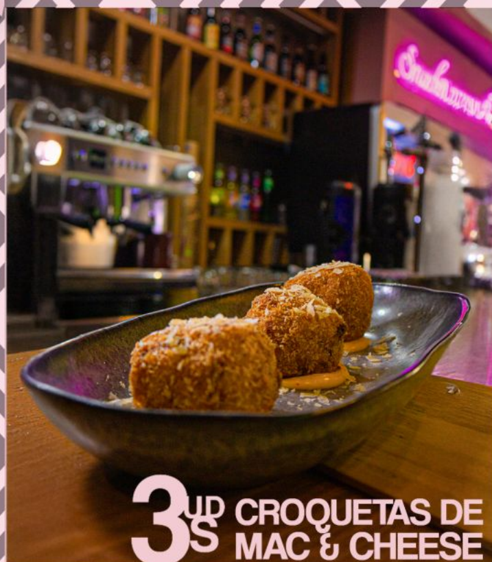
3 UD S CROQUETAS DE MAC & CHEESE