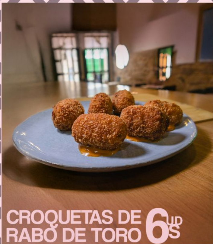
CROQUETAS DE RABO DE TORO 6 UP S

CROQUETAS DE RABO DE TORO CREMOSAS ACOMPAÑADAS CON LA SALSA INSTINTO.