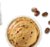
Café pur Arabica