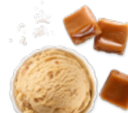
Caramel au beurre salé