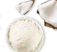
Noix de coco