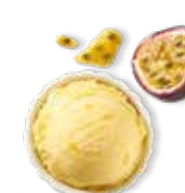
Fruit de la passion