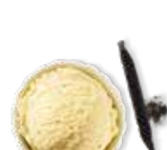
Vanille de Madagascar