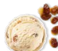
Rhum* raisins macérés