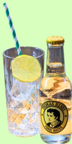
Roku Gin Set