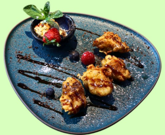
N10 Knusprige Bananen mit Eis (4 Stk.) (A,G)/ Crispy Bananas with ice cream (4 pcs.) 6,90 €