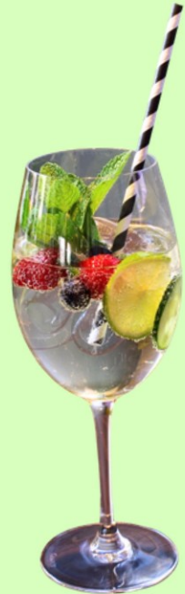
Lillet Rose Spritz