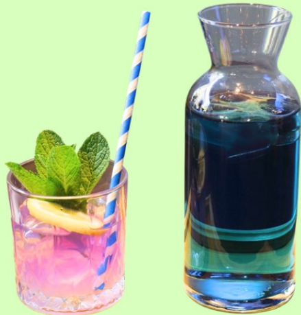
Magic Flower Ice Tea