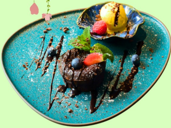
N9 Chocolate Lava Cake with Ice Cream (A,G) 7,90 €