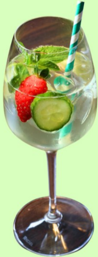
Special Shangri La Spritz