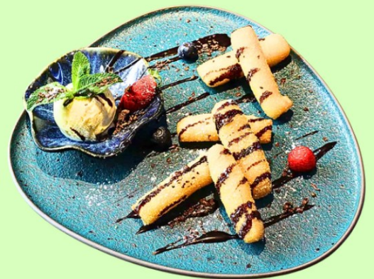
N12 Klebreis mit Schokoladesauce (A,G)/ Sticky Rice with Chocolate Sauce (A,G) 6,90 €