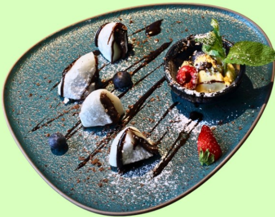
N11 Classic Mochi with Ice cream (A,G) 6,90 €