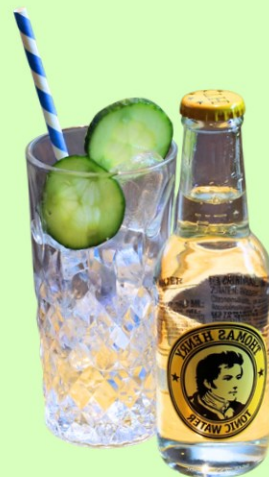
Smirnoff Vodka Set