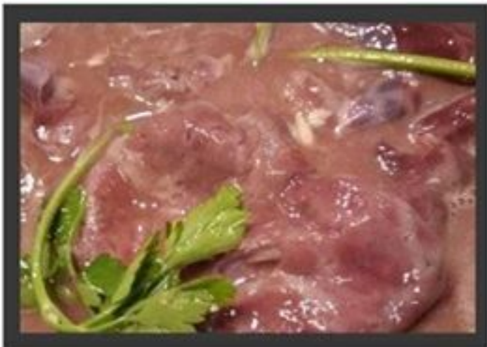
Iscas de vitela