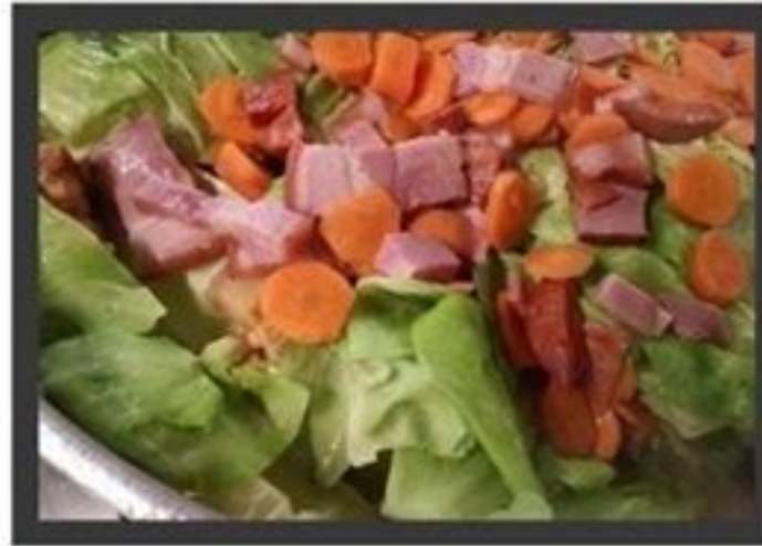
Feijoada á lavrador