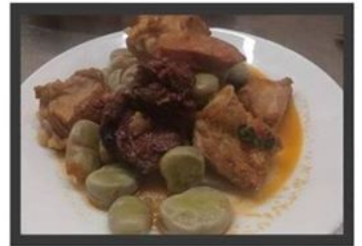
Favas com entrecosto