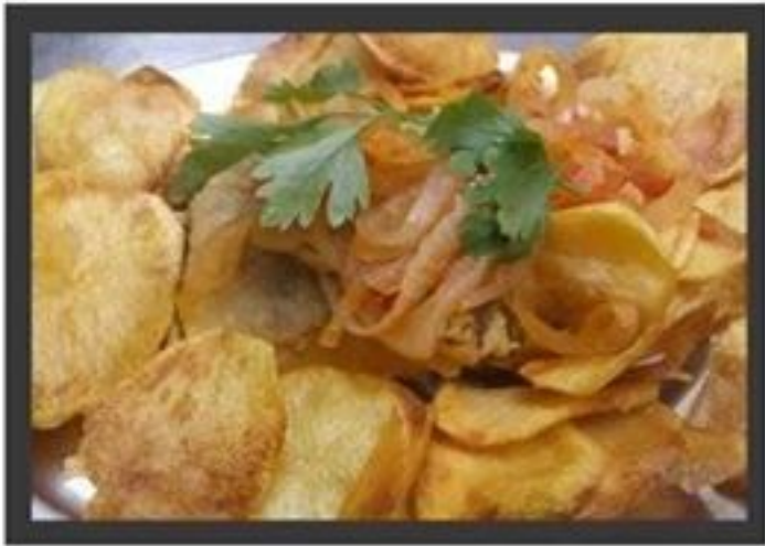
Bacalhau a minhota