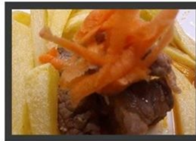
Vitela á portuguesa