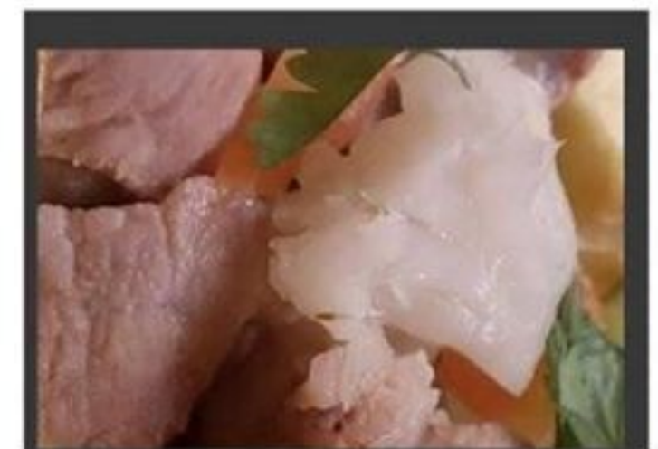
Carne Porco á