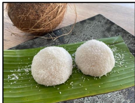
Perle de coco

Ces 2 desserts sont disponibles certains jours 8,90€