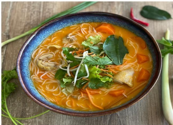
Soupe Khao Poun

Pho Soup chicken rice pasta, soy, chives onion and coriander, light spicy