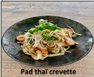
Pad thaï crevette

-stir fried wheat noodles with meat of your choice