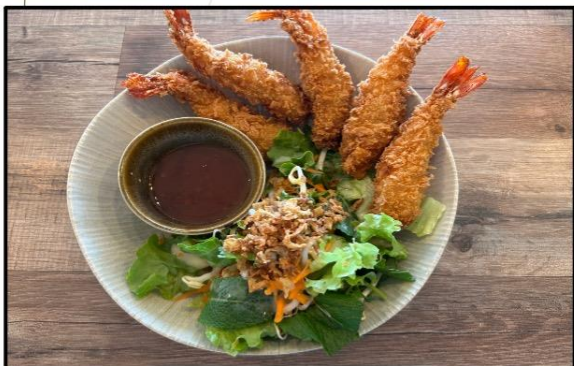
Tempuras de crevettes 11,90€