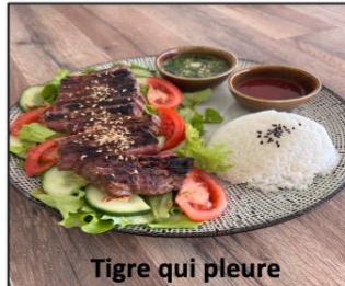
Tigre qui pleure