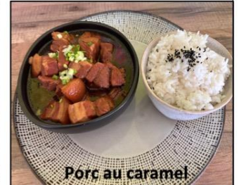
Porc au caramel