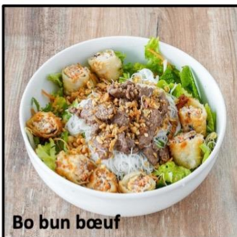
Bo bun bœuf