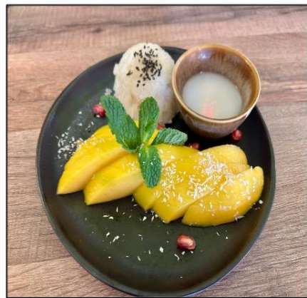
Riz gluant à la mangue