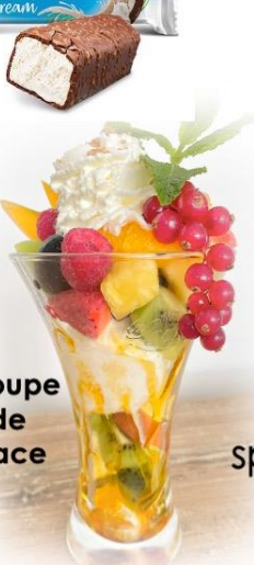
Coupe de glace

Coupe de glace 2 boules de glace avec des fruits frais 10,50€