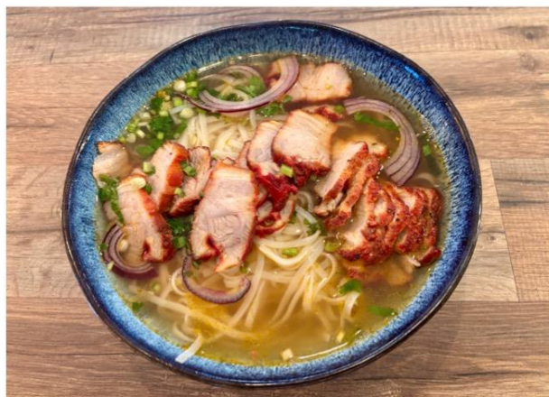
Soupe de Porc Laqué

Pho Soup lacquered pork rice pasta, soy, chives onion and coriander