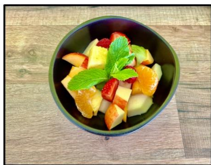
Salade de fruits frais