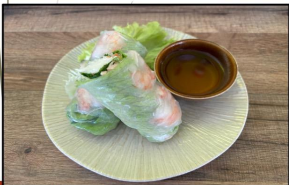
Rouleaux de printemps 5,90€

crevette, pâté de porc, soja carotte, coriandre, menthe, vermicelle de riz