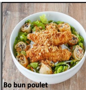
Bo bun poulet