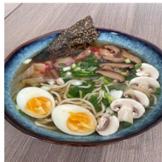
Soupe Ramen au porc

Origine de notre viande: porc, bœuf, poulet /Française (pork, beef and chicken of French origin)