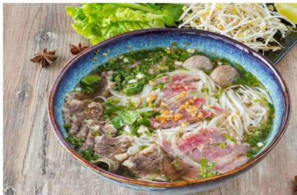
Soupe Phô Bœuf

Pho Soup beef rice pasta, soy, chives onion and coriander