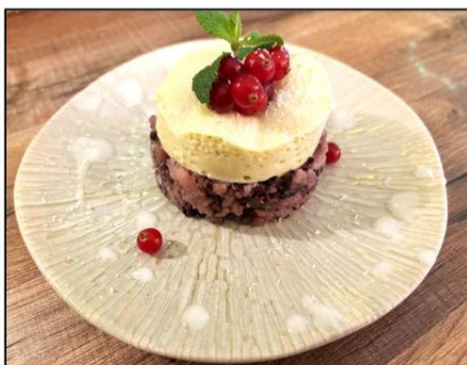
Riz noir à la crème de coco