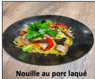
Nouille au porc laqué