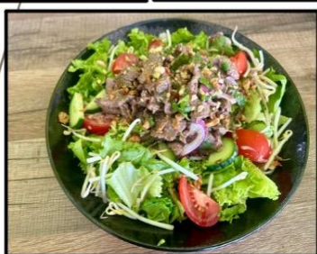
Salade thaï bœuf