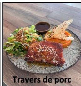
Travers de porc