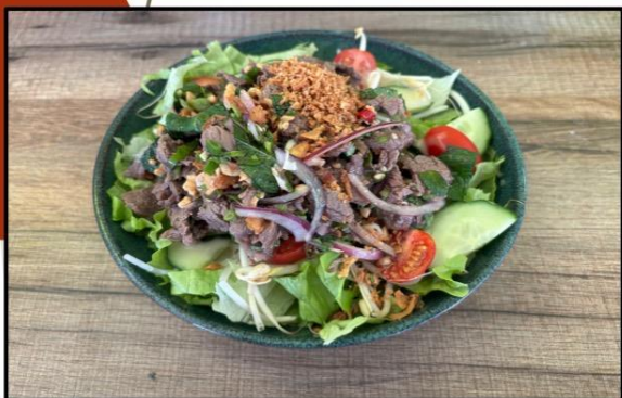
Salade thaï au bœuf épicée 12,90€

Spring rolls salad with Shrimp and pork)