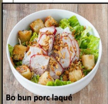
Bo bun porc laqué

-Bo Bun (cold rice noodle , pork eggrolls, carrots, bean sprouts, mint, peanuts, fried onions)