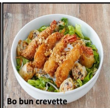
Bo bun crevette