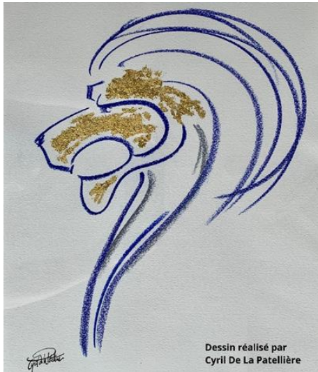
Dessin réalisé par Cyril De La Patellière