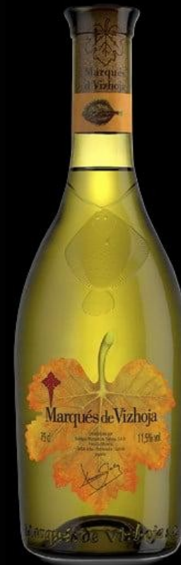
Marquez de Vizhojas, 15,00 €