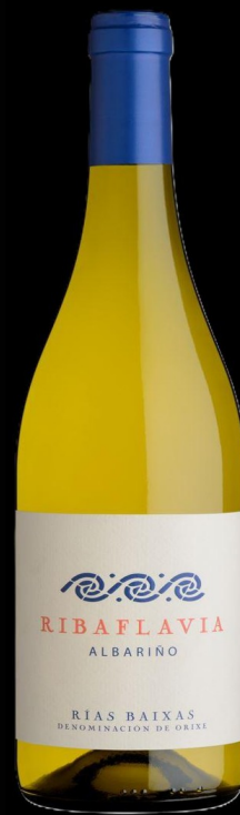
RIBAFLOVIA 17,00 €