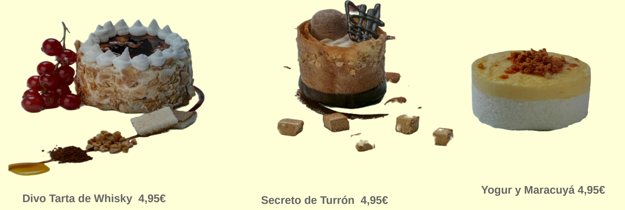
Divo Tarta de Whisky 4,95€