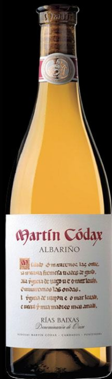
MARTIN CODAX 25,00 €