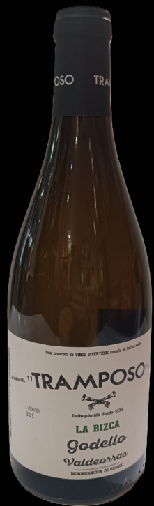
Tramposo - 28,00 € Godello - Valdeorras (Ourense)