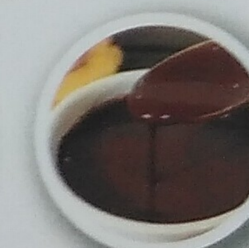
Molho de Chocolate Chocolate Sauce

COMPLEMENTOS .....0,70€ Amêndoa Laminada; Smarties; Mel; choco crispies; mini suspiros; marshmallows Almonds; smarties; honey; choco crispies; meringue