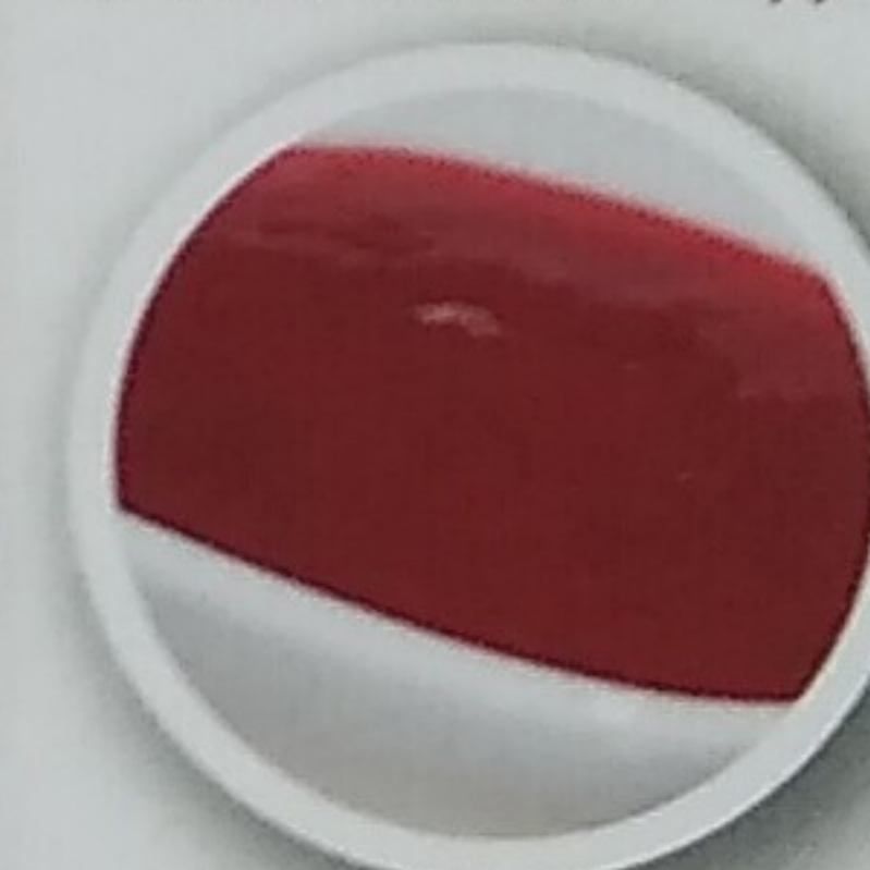
Molho de Frutos Vermelhos Frescos Fresh Red Fruit Sauce

NUTELLA .....1,50€ TOPPINGS .....1,30€ Chantilly; chocolate quente; doce de leite; molho de frutos vermelhos frescos Cream; chocolate topping; dulce de leche; fresh red fruit sauce