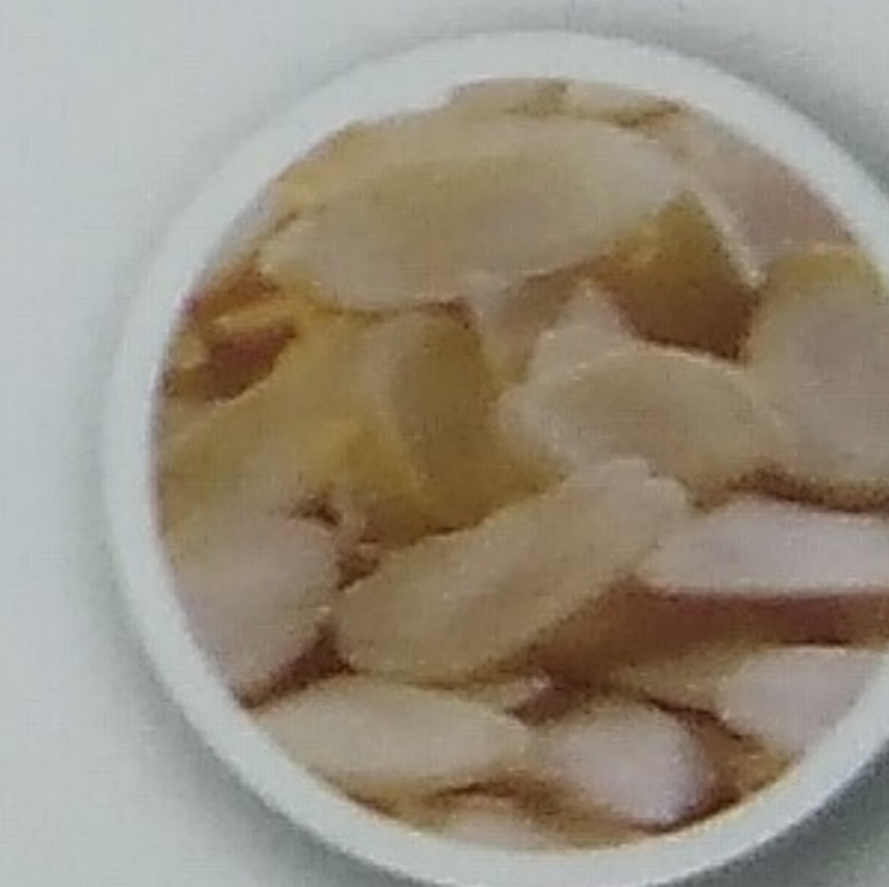
Amêndoas Torradas Toasted Almonds