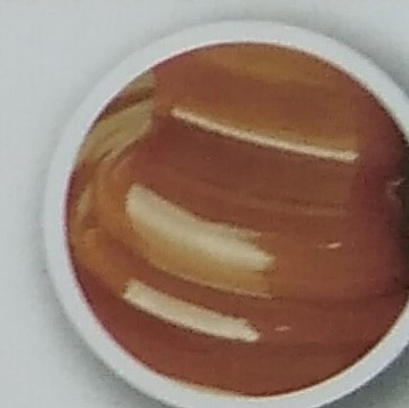
Doce de Leite Sweet Condensed Milk