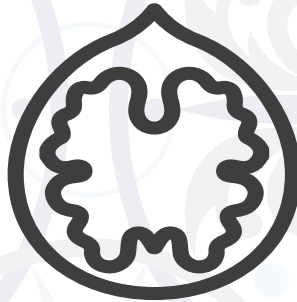
8. Frutos Secos