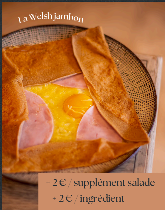
La Welsh jambon

+ 2€ / supplément salade + 2€ / ingrédient