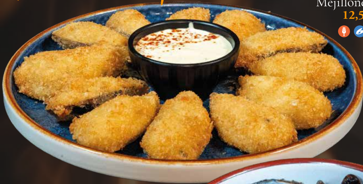
Mejillones Tigre 12,50€