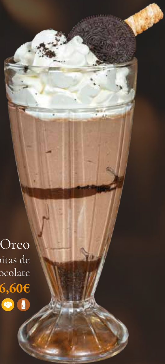
Copa Oreo con pepitas de chocolate