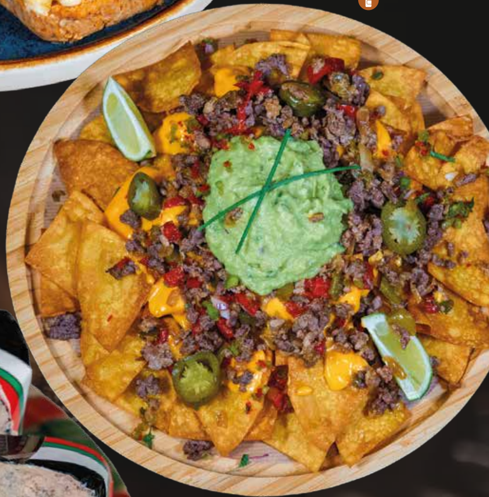
Queso Cabrales Campeón