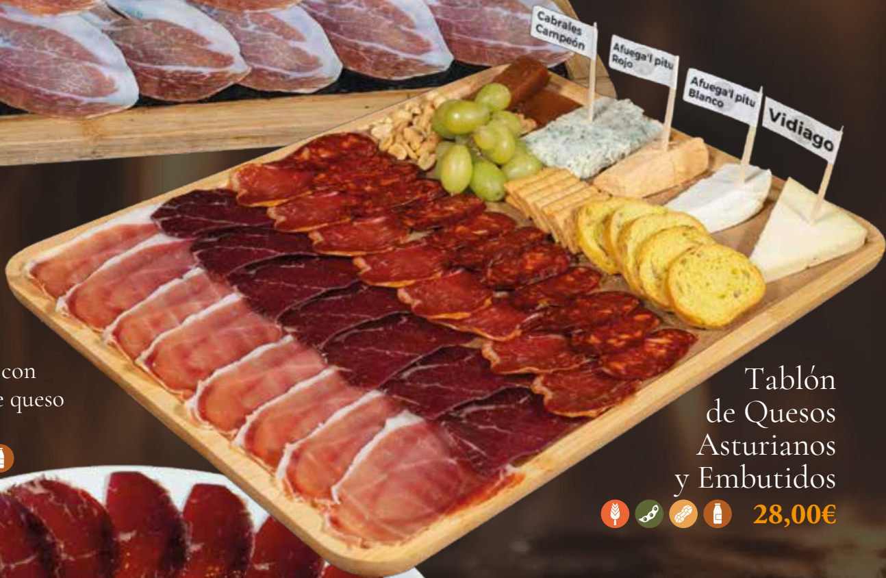
Cecina de Ezequiel con medallón de queso de cabra