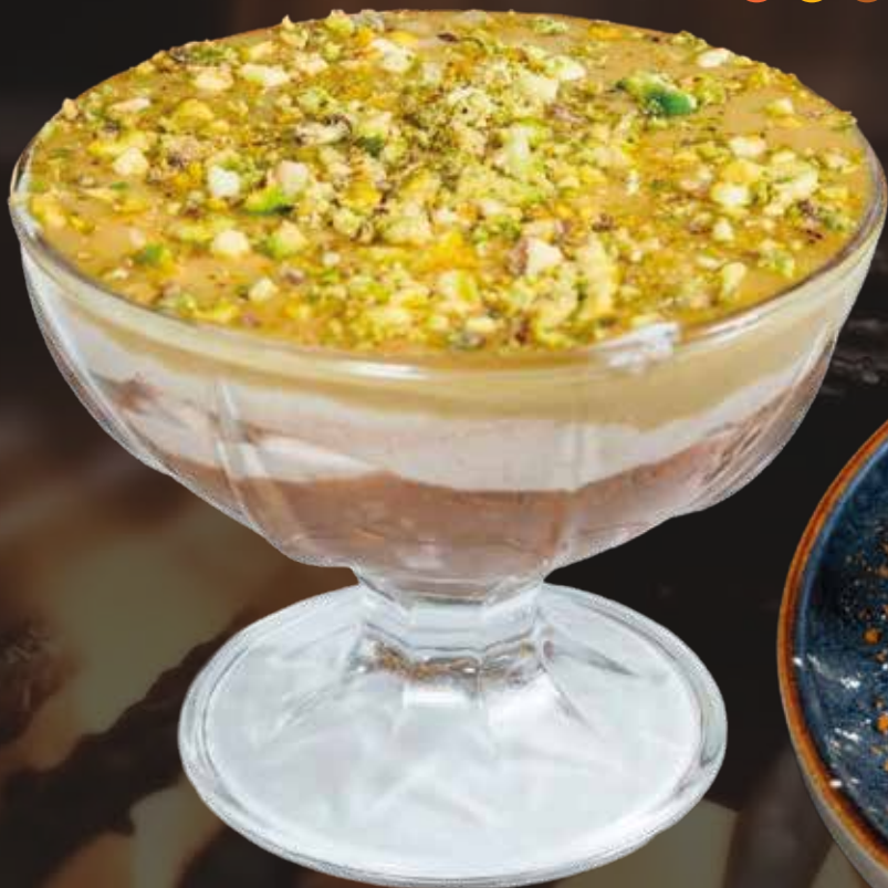
Tiramisú de Pistacho