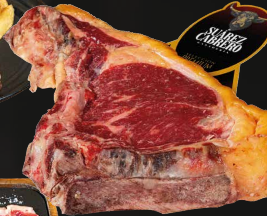
Chuletón de Vaca Rubia Asturiana 65,00€/kg