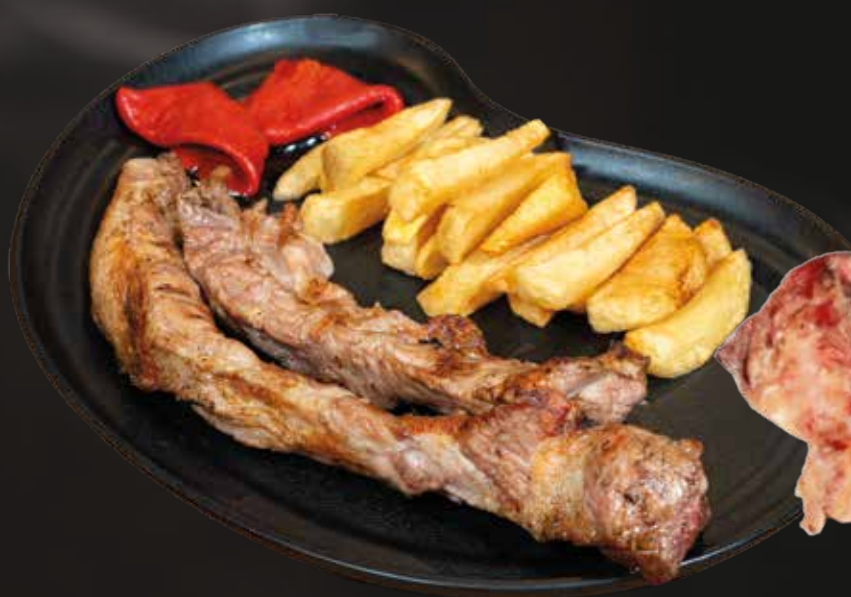
Lagarto Ibérico a la brasa con patatas y piquillos 18,50€