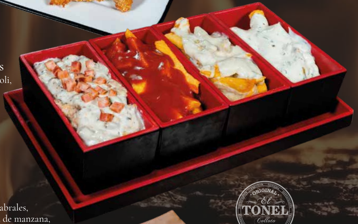
Tabla de Tortos picadillo con queso Cabrales, morcilla con compota de manzana, jamón con huevo frito y lacón con puré de patata 20,00€