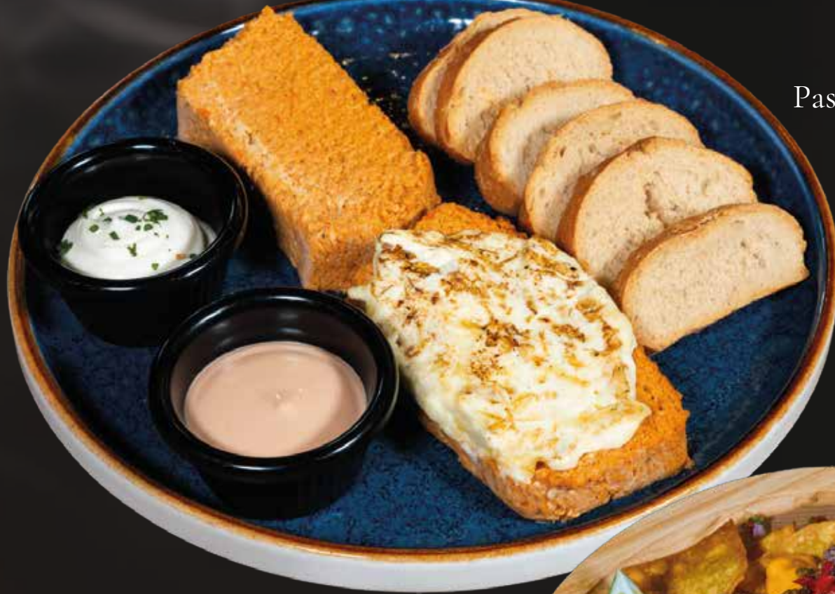
Pastel de Cabracho