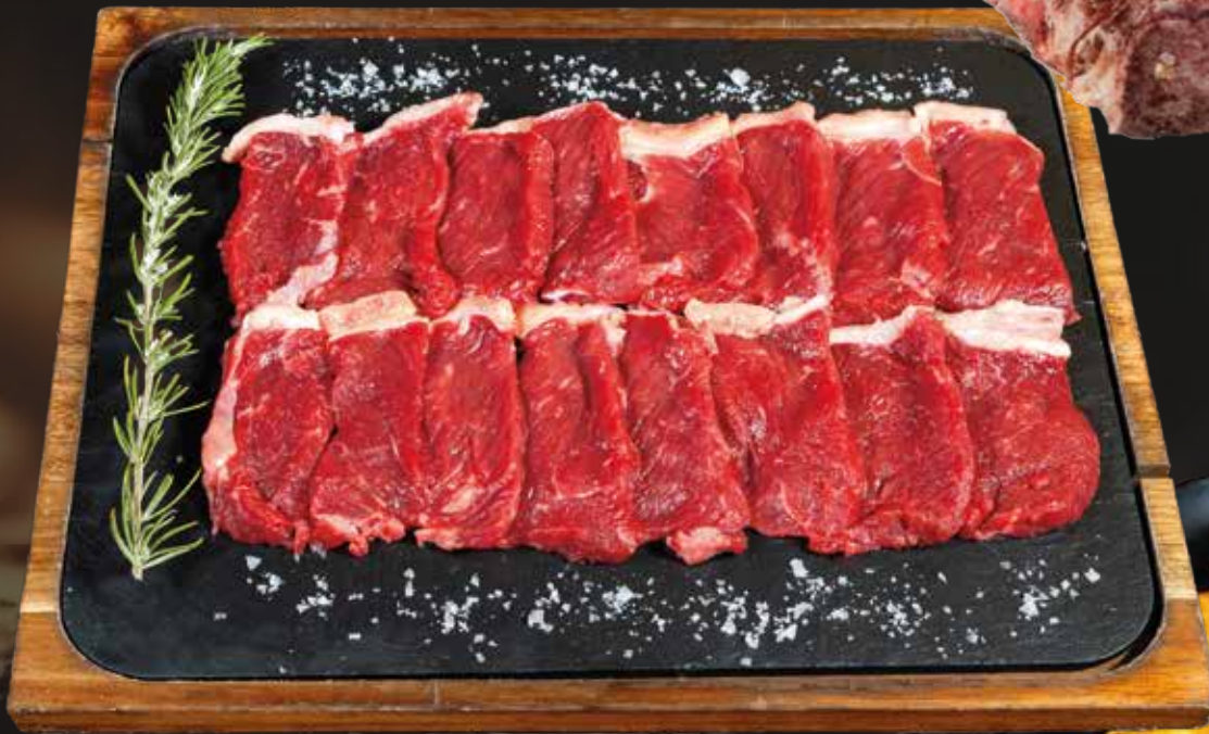
Carne a la Piedra 35,00€