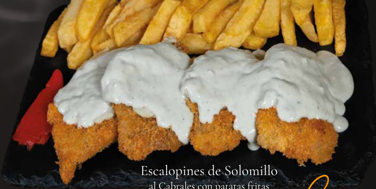
Escalopines de Solomillo al Cabrales con patatas fritas