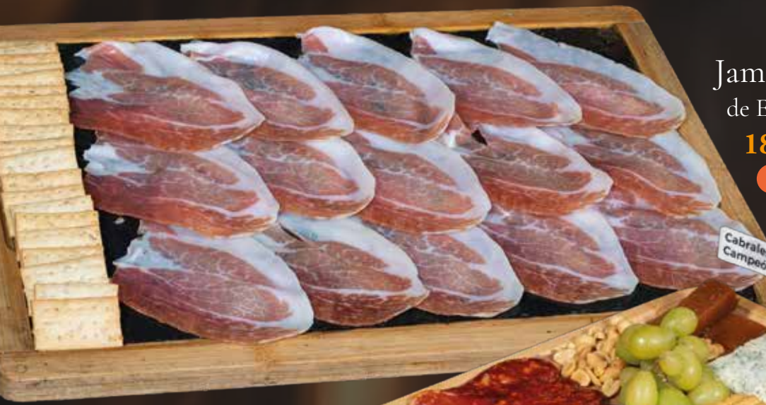
Jamón Ahumado de Ezequiel