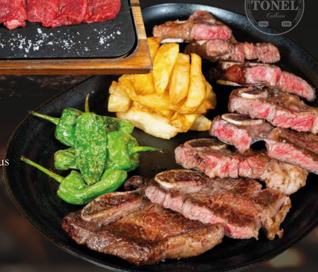
Churrasco de Angus con patatas fritas 35,00€