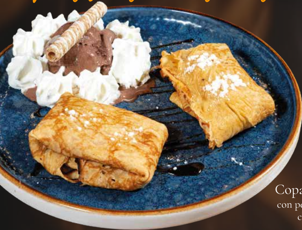
Rabioli de Frixuelos reellenos de crema de turrón y helado de chocolate