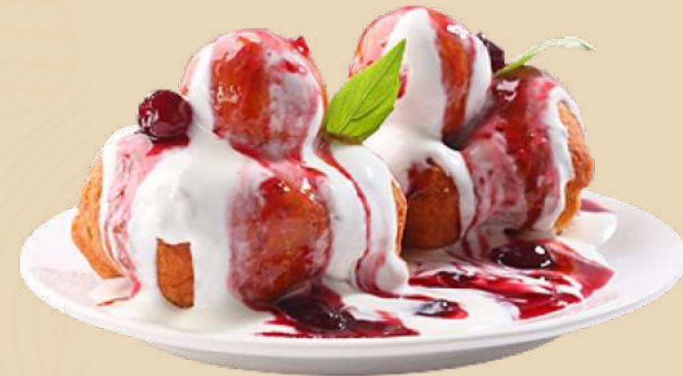
PAPANAȘI CU DULCEAȚĂ