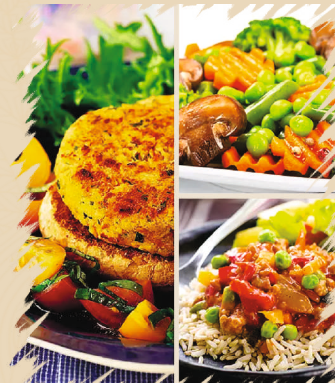
Imagine preluata cu titlu de prezentare