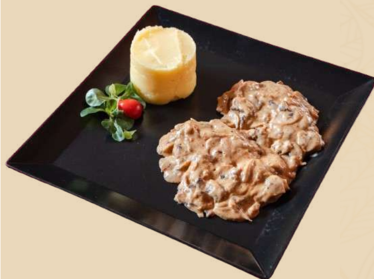
ESCALOP DE PORC CU CIUPERCI