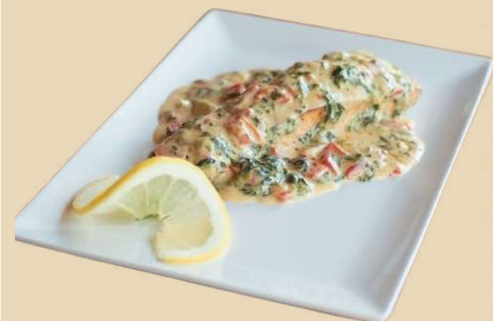
SOMON CREMOS ÎN STIL TOSCAN