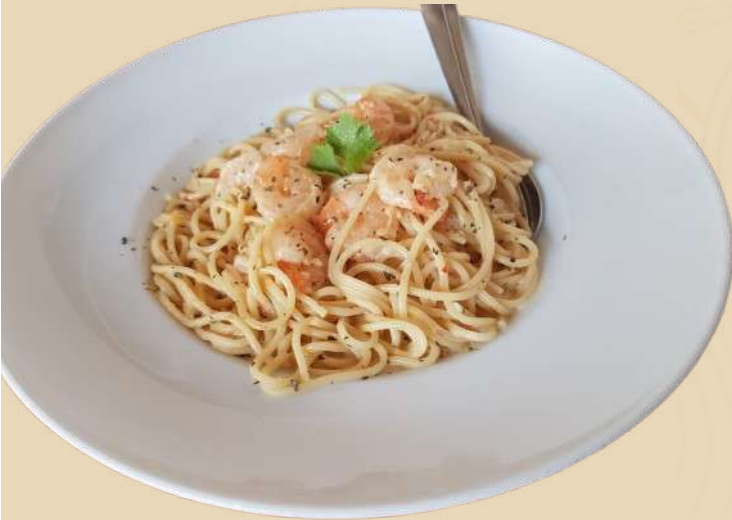
SPAGHETTI CU CREVEȚI* ÎN SOS ALB

PENNE ALL' ARABIATA -sos de roșii picant, parmesan Alergeni: 1,7