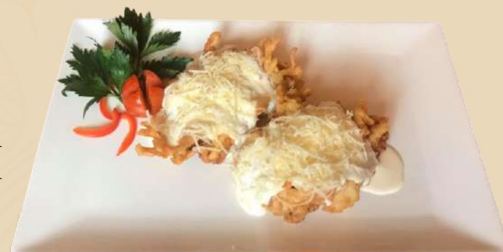
SNITEL 'BORZASKA' - 'CIUFULICI'