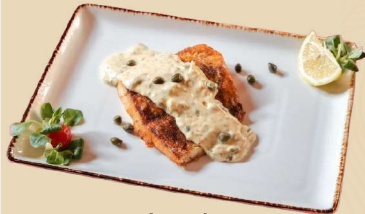
FILE DE SALĂU* LA GRĂTAR CU SOS DE CAPERE