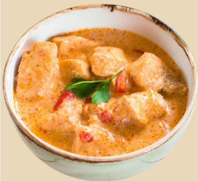
Imagine preluata cu titlu de prezentare