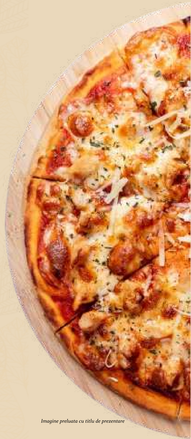
Imagine preluata cu titlu de prezentare