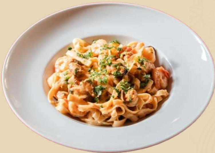
TAGLIATELLE CU FRUCTE DE MARE