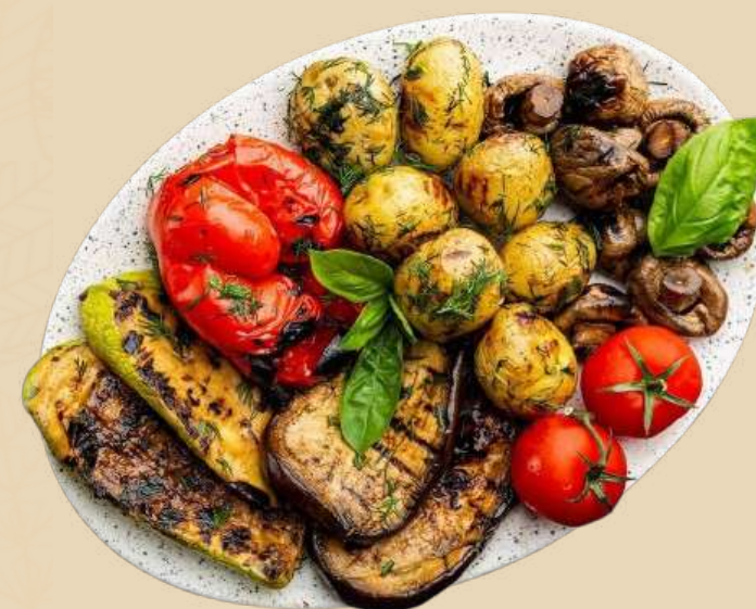
Imagine preluata cu titlu de prezentare