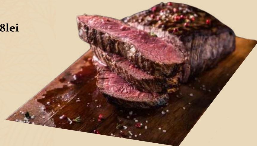
Imagine preluata cu titlu de prezentare