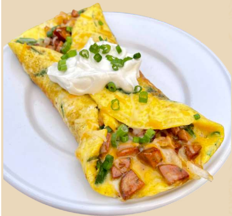
Imagine preluata cu titlu de prezentare