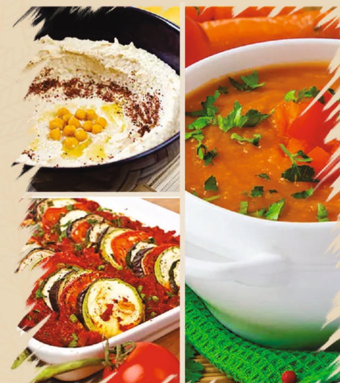
Imagine preluata cu titlu de prezentare