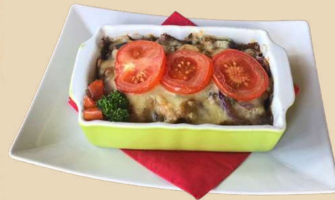
PIEPT DE PUI MADEIRA