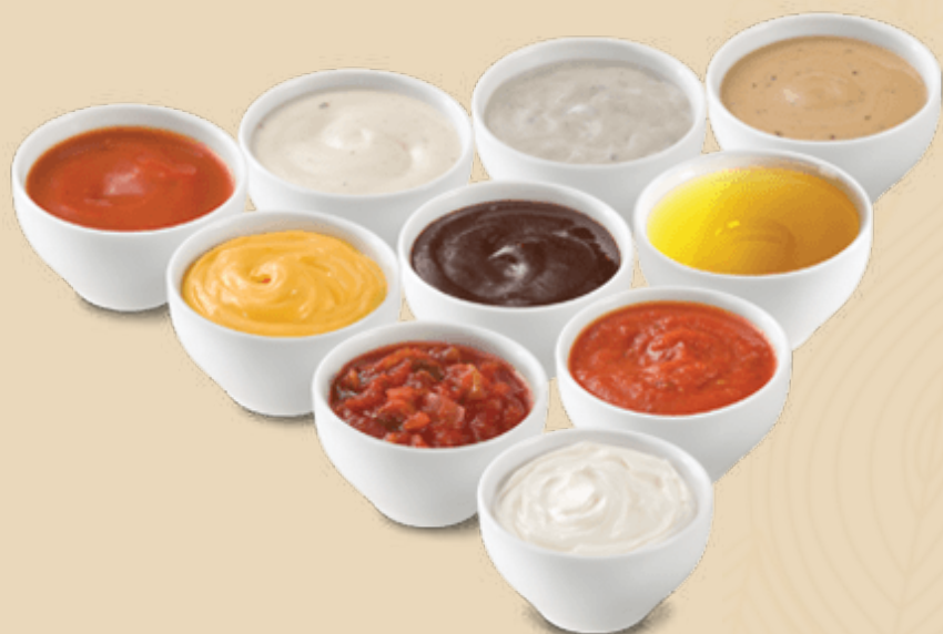
Imagine preluata cu titlu de prezentare