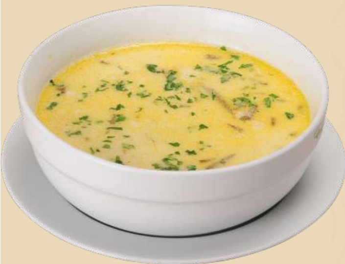
Imagine preluata cu titlu de prezentare