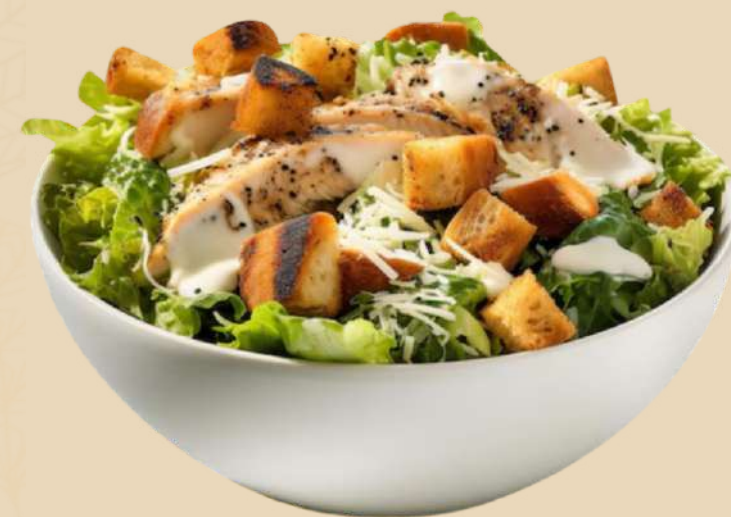
Imagine preluata cu titlu de prezentare