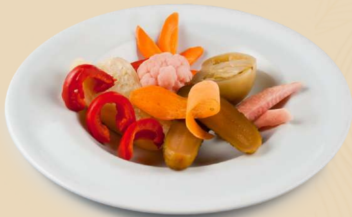
Imagine preluata cu titlu de prezentare