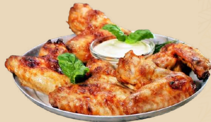
ĂRIPIOARE DE PUI CROCANTE CU SOS DE USTUROI