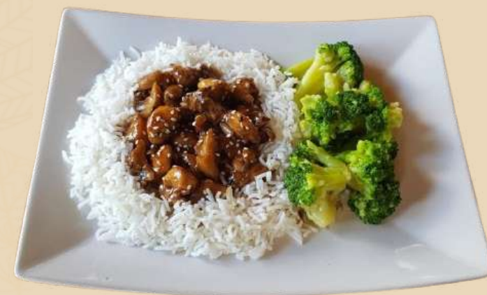
PUI TERIYAKI CU BROCOLI SI OREZ BASMATI