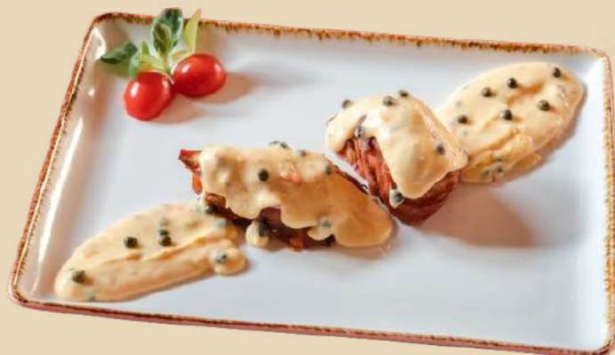
PIEPT DE PUI INVELIT IN BACON CU SOS DE PIPER VERDE