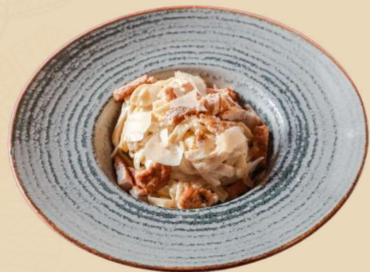
TAGLIATELLE CU SOS ALFREDO ȘI PUI