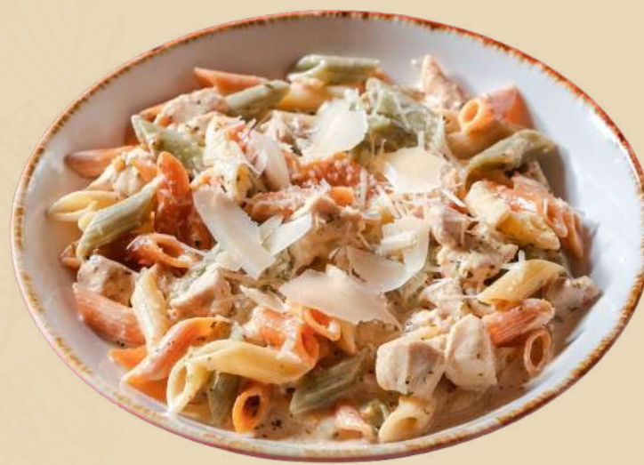
PENNE COLORATE CU PUI