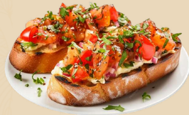
Imagine preluata cu titlu de prezentare