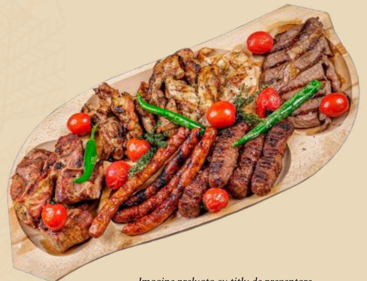
Imagine preluata cu titlu de prezentare