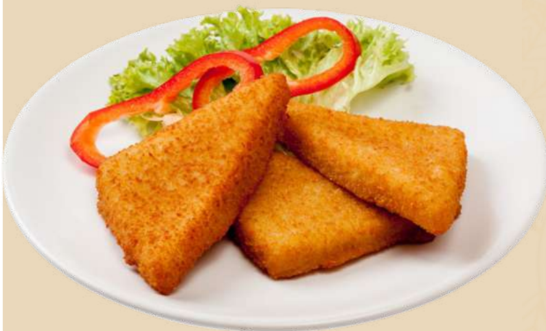
Imagine preluata cu titlu de prezentare