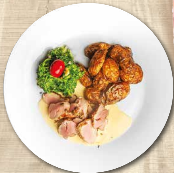
Vepřová panenka na grilu s pepřovou omáčkou, listový špenát Grilled pork tenderloin with pepper sauce, leaf spinach