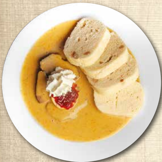
Svíčková na smetaně, houskové knedlíky, brusinky Boiled fillet of beef in cream sauce, bread dumplings, cranberries