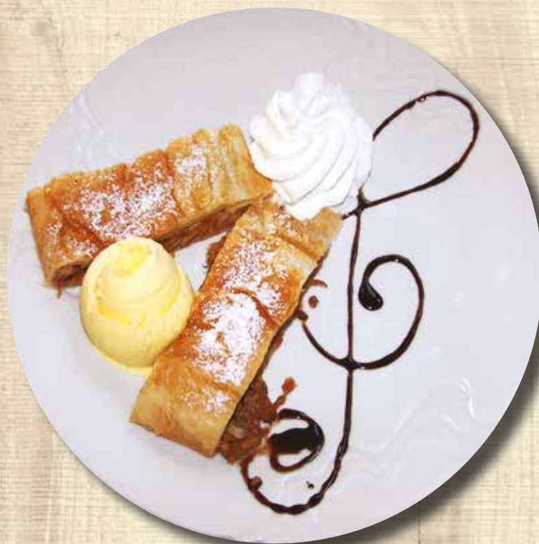
Čerstvý jablečný závin s vanilkovou zmrzlinou Fresh apple strudel with vanilla ice-cream