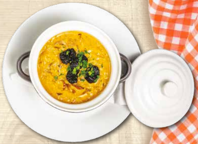
Slovenská kapustnice s houbami, sušenými švestkami a klobásou Slovak cabbage soup with mushrooms, dried plums and sausage