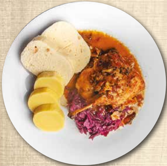
Konfitované kachní stehýnko, variace knedlíků, červené zelí Confit duck leg, variations of dumplings, red cabbage