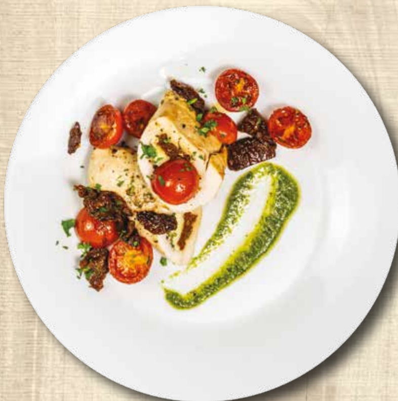
Kuřecí prsa s mozzarelou Chicken breast with mozzarella

Спагетти с чесноком, маслом и чили (чеснок, чили, пармезан)