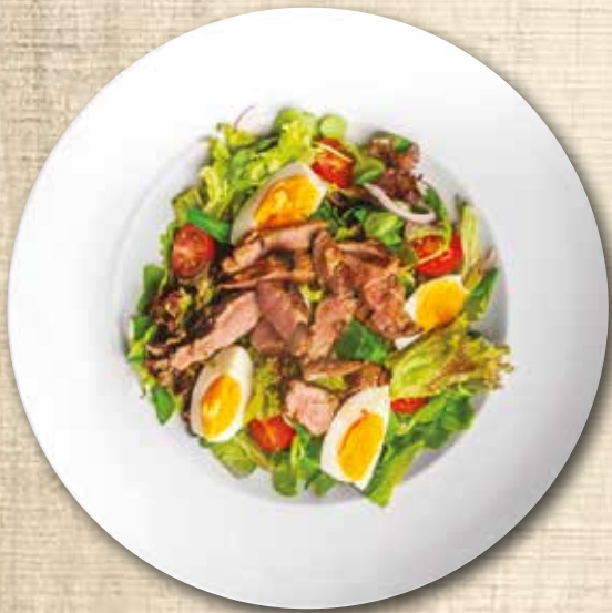
Listový salát s grilovanou vepřovou panenkou, vejce, medovo-hořčičný dresing Varied leaf salad with grilled pork tenderloin, egg, honey-mustard dressing