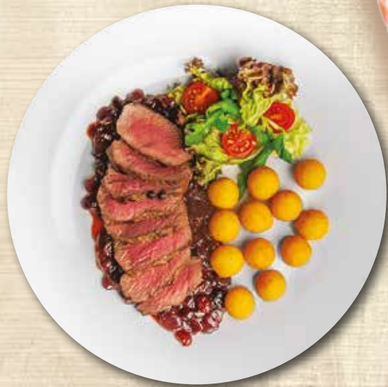
Dančí medajlonky s brusinkovou omáčkou, bramborové krokety Medallions of fallow deer with cranberry sauce, potato croquettes