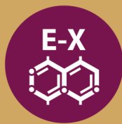
Dióxido de azufre y sulfitos 12