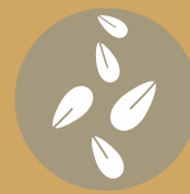
Granos de sésamo 11