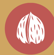
Frutos de cáscara 8