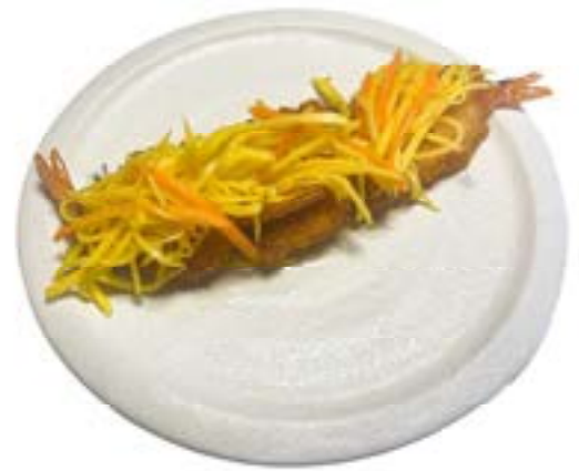
2. Gamberi mango 2pz Gamberi*, mango, carote .. 3.50 euro 🦑 🍌