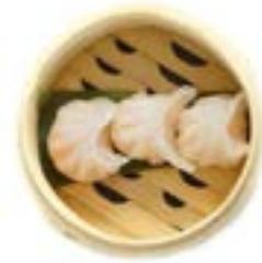
28. Dinsu (3pz)