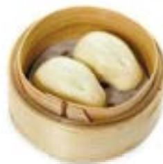
7. Pane dolce 2pz Con crema di tuorlo .. 3.50 euro 🍞 🥚