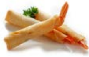
14. Ebi stick (3pz) Gamberi* e verdure .. 4.00 euro 🍳 🌿 🍷