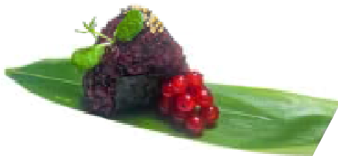
99. Onighiri nero Salmone, pistacchio, salsa rucola