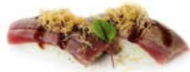
175. Nigiri tonno flambe'

Riso con tonno scottato guarnito con salsa spicy, teriyaki, mandorle e erba cipollina