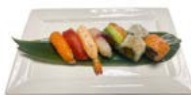
178. Sushi combo 4pz nighiri, 4pz uramaki