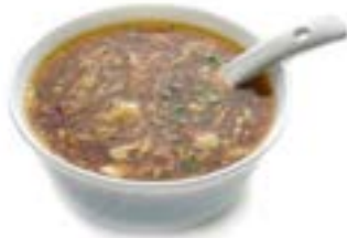
10. Zuppa agropiccante 🌶️ Zuppa con funghi, bambu', granchio*, verdura mista e uovo .. 3.50 euro 🍳 🌿