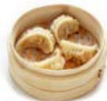
25. Gyoza al vapore (3pz)