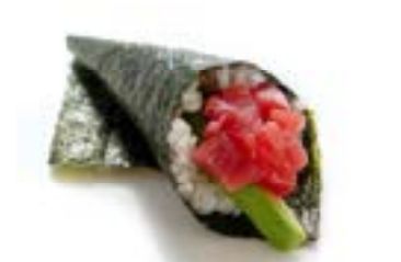
158. Temaki maguro Tonno* e avocado .. 5.00 euro 🐟