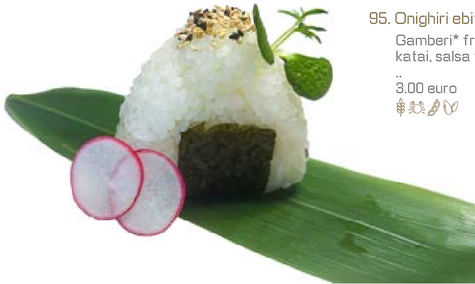
95. Onighiri ebiten Gamberi* fritto, katai, salsa teriyaky