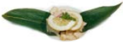
56. Pollo al limone Pollo* e limone .. 5.00 euro