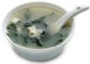
9. Zuppa di miso Zuppa con miso, tofu e alghe .. 2.50 euro 🌿