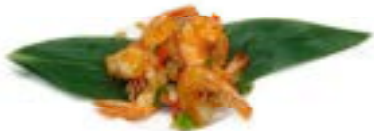
62. Gamberetti sale e pepe Gamberetti*, peperoni, pepe nero e cipolla .. 6.00 euro 🍴