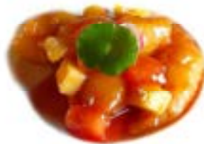
66. Maiale in salsa agrodolce Maiale*, ananas e pomodoro .. 5.00 euro