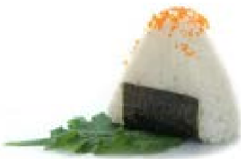
96. Onighiri tobiko Polpa di granchio*, maionese e uova di pesce