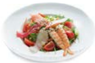
6. Insalata ai frutti di mare Insalata, frutti di mare*, salsa maya .. 5.00 euro 🦑 🍤 🌿