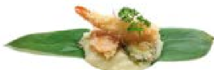
24. Creme tempura mista

Pure' di patate, tartufo, gamberoni* e verdure