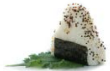
98. Onigiri sake cotto Salmone* cotto, philadelphia e sesamo