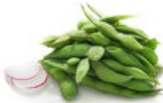
4. Edamame Fagioli di soia* .. 3.00 euro 🌱