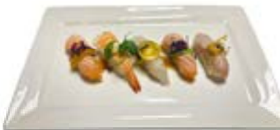
177. Nigiri omakase 5pz Nighiri misto al fuoco, e salsa dello chef