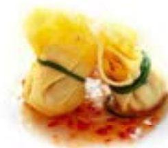
13. Fagottino di gamberi (2pz) Gamberi*, cipolla e carote .. 4.00 euro 🍳 🌿