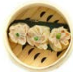
27. Shaomai (3pz)