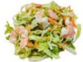
5. Insalata cinese Gamberetti*, insalata mix, salsa maionese cinese .. 5.00 euro 🦑 🍋