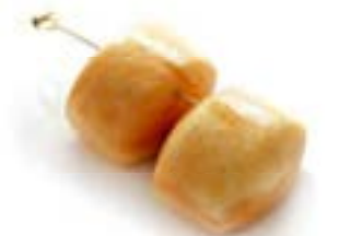
15. Pane fritto (2pz) Farina di grano .. 3.00 euro 🌿