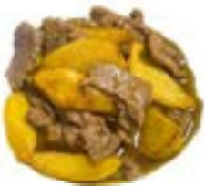
77. Manzo patate Manzo, patate fritto