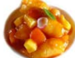
67. Gamberi in salsa agrodolce Gamberi*, ananas e pomodoro .. 6.00 euro 🍴