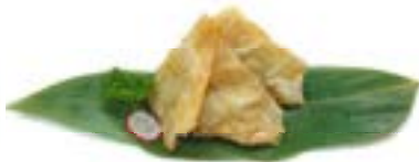
21. Wanton fritto (2pz)