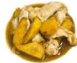
76. Pollo patate Pollo, patate fritto