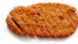
17. Tonkasu Cotoletta di maiale* .. 5.00 euro 🌿