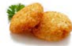
16. Korokke (3pz) patate e cipolla .. 3.50 euro 🍳 🌿