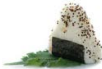
97. Onigiri sake spicy 🌶️ Spicy salmon* e sesamo