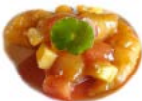
65. Pollo in salsa agrodolce Pollo*, ananas e pomodoro .. 5.00 euro