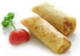
12. Involcini primavera (2pz) Verdura .. 3.00 euro 🌿