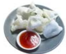
8. Nuvole di drago .. 2.00 euro 🦑 🌿