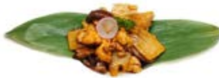
75. Pollo con funghi e bambu' pollo*, funghi e bambu'