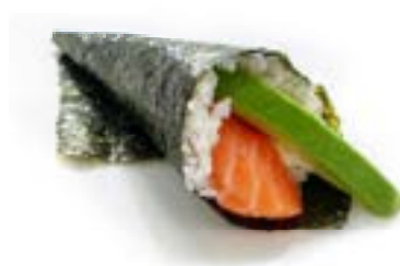
155. Temaki sake Salmone* e avocado .. 4.00 euro 🐟