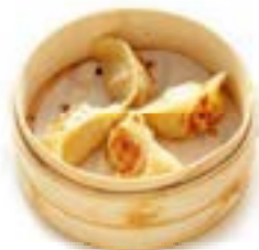
26. Gyoza alla griglia (3pz)