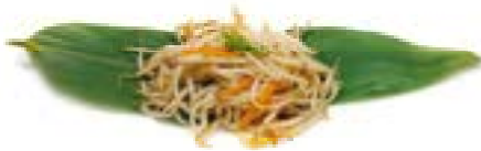
74. Germogli di soia saltati Germoglio di soia, carote e cipollina