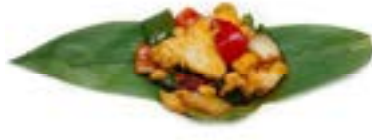
58. Pollo "gongbao" 🌶️ Pollo*, peperoni, arachidi e cipolla .. 5.00 euro 🍴