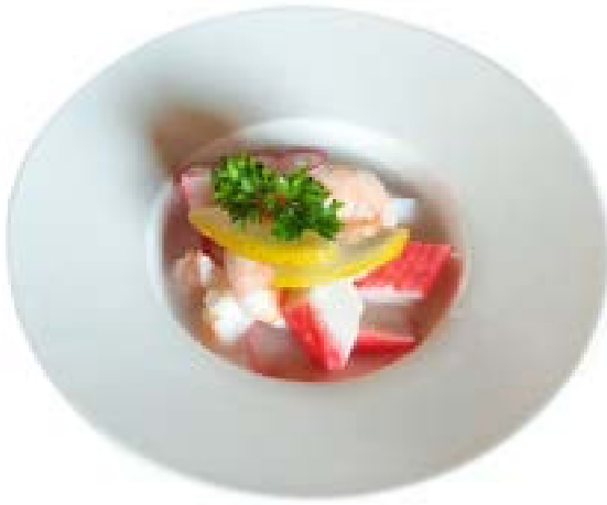
1. Antipasto di mare Polpo*, surimi*, gamberetti*, maionese, aceto e limone .. 6.00 euro 🦑 🍤 🍋