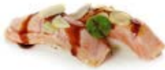
174. Nigiri salmone flambe' Riso con salmone scottato guarnito con salsa miso, teriyaki e pistacchio