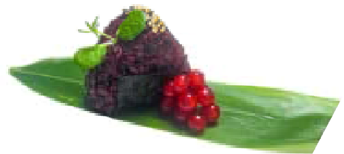
100. Onighiri nero ebi Gamberi* cotto, philadelphia, salsa teriyaky, katai