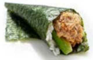
156. Temaki miura Philadelphia, salmone* cotto e salsa teriyaki .. 4.00 euro 🍷🐟🥑