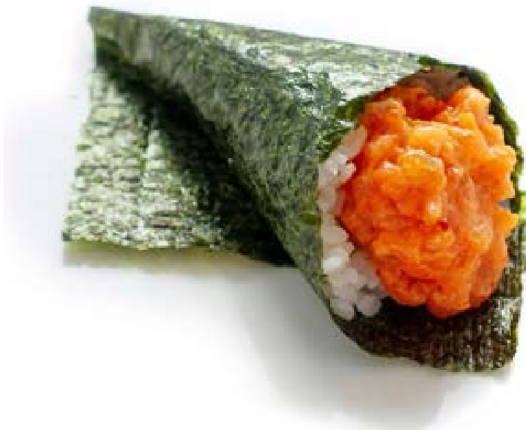
153. Temaki spicy sake 🌶️ Spicy salmon* e avocado .. 4.00 euro 🐟