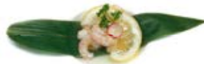
63. Gamberetti al limone Gamberetti* e limone .. 6.00 euro 🍴