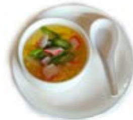
11. Zuppa di granchio Granchio*, asparagi e uovo .. 3.50 euro 🍳 🍷 🌿