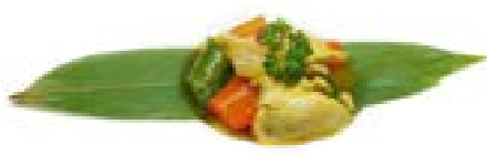
57. Pollo al curry Pollo*, salsa al curry, piselli, cipolla .. 5.00 euro