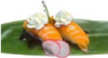
173. Nigiri phila salmone Salmone, philadelphia