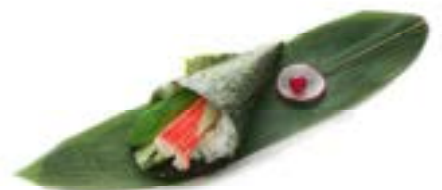
159. Temaki california Surimi*, avocado e maionese .. 4.00 euro 🍷🥚