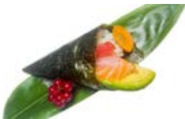
157. Temaki mix Salmone, branzino, tonno, avocado .. 5.00 euro 🐟