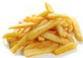
23. Patatine fritte*