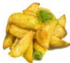
19. Patate sale pepe Patate fritto, erba cipollina .. 4.00 euro 🌿