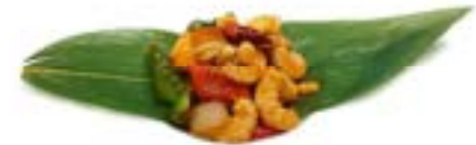
64. Gamberetti "gongbao" piccanti 🌶️ Gamberetti*, peperoni, arachidi e cipolla .. 6.00 euro 🍴 🍴