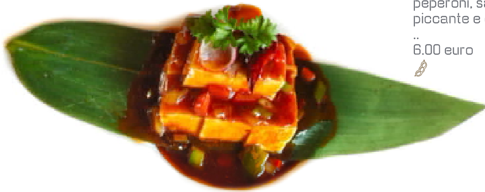
73. Tofu mapo 🌶️ Tofu, carne*, peperoni, salsa piccante e cipolla