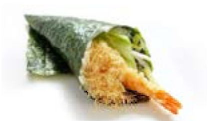
154. Temaki ebiten Gamberoni* fritti, maionese e salsa teriyaki .. 5.00 euro 🍷🌾🥚🥑