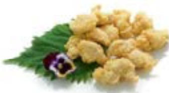
18. Pollo fritto Pollo* .. 4.00 euro 🌿