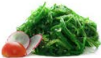
3. Goma wakame Alghe verdi* .. 4.00 euro 🌿