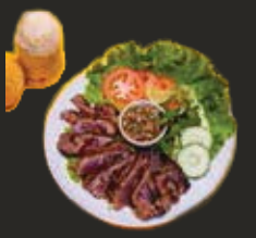
Tigre qui pleure et son riz Gluant