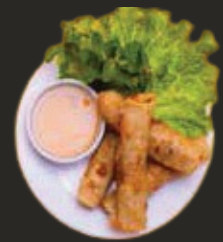
Nems au Porc