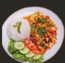
Poulet aux Noix de Cajou