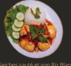
Seiches sauté et son Riz Blanc