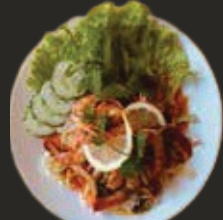
Salade Thai aux Crevettes