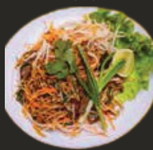
Nouilles au Boeuf