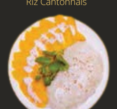
Khao niew ma mouang