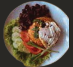
Riz Loc Lac

TARIF NET SERVICE COMPRIS. Viandes françaises nées, élevées, abattues, et transformées en France. Nos plats sont susceptibles de contenir des allergènes majeurs tel que ; les céréales contenant du gluten, crustacés, oeufs, poissons, soja, lait, fruits à coques, céleri, moutarde, graines de sésame, anhybride sulfureux et sulfites, lupin, mollusque, arachide. Les crustacés et poissons sont surgelés.