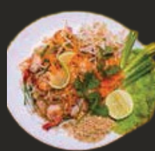
Pad Thai aux Crevettes