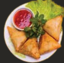
Samoussas au Boeuf