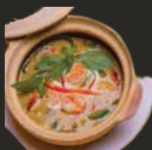
Soupe Tum Yam Kung