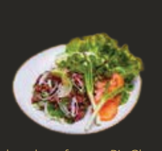
Lab au boeuf et son Riz Gluant