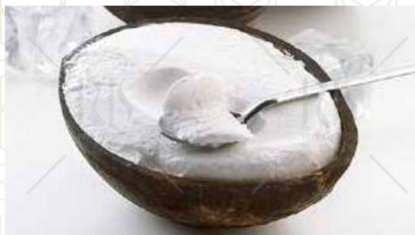
COCCO RIPIENO € 6.00