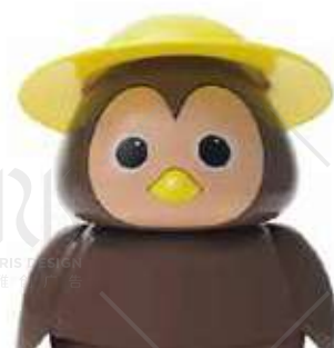
CIP CIOK € 4.50