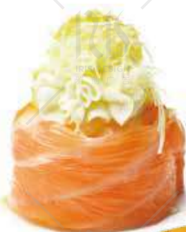
183 PHILADELPHIA salmone philadelphia €5.00