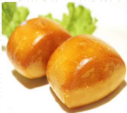
19 BAO FRITTO Pane orientale fritto €4.00