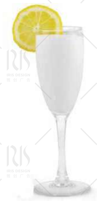
GELATO MISTO €5.00