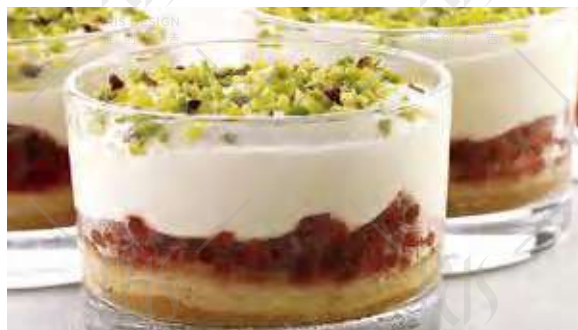
COPPA MASCARPONE E LAMPONI