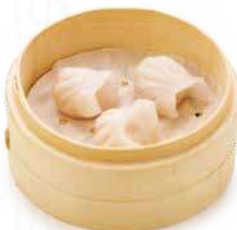
22 GYOZA GAMBERO (4pz) Sfoglia al riso glutinoso con ripieno di gamberetti e pesce bianco al vapore €6.50