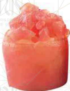
181 TUNA Tonno €5.50