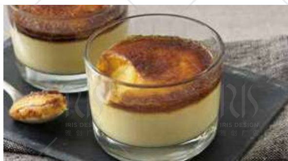
COPPA CREMA CATALANA