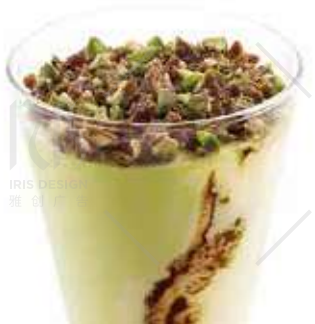
COPPA CREMA E PISTACCHIO € 6.00