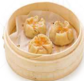
23 RAVIOLI SHUMAI (4pz) Ravioli con gamberi, carne, verdure e lardo €6.00