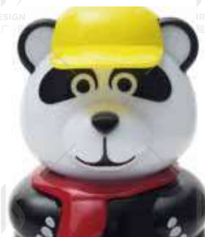
PANDAN € 4.50