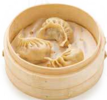
21 RAVIOLI NIKU (4pz) Ravioli con carne e verdure €5.50