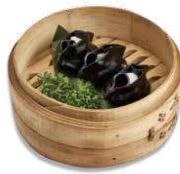
26 IKA GYOZA (4pz) Sfoglia al nero di seppia con ripieno di calamaro al vapore €6.50