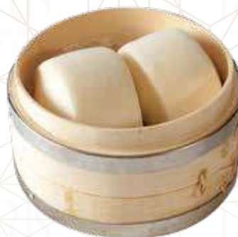
20 BAO (2pz) Pane orientale €4.00