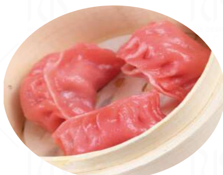
25 RAVIOLI DI MANZO (4pz) Sfoglia rosso barbabietola con ripieno di manzo al vapore €6.50