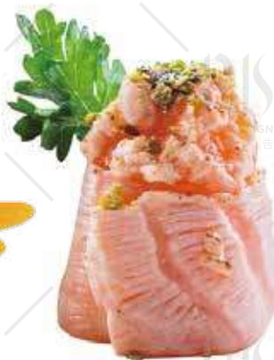
185 SAKE FLAMBE salmone flambè, teriyaki, pistacchio, piccante €5.50