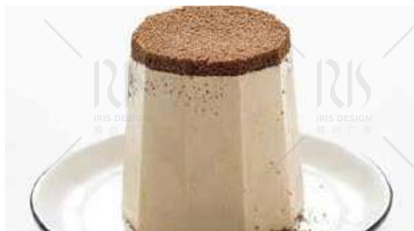
SEMIFREDDO AL CAFFÈ