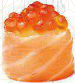
182 IKURA Uova di salmone €5.50