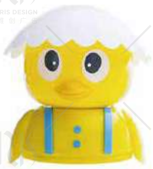
TWITTY € 4.50