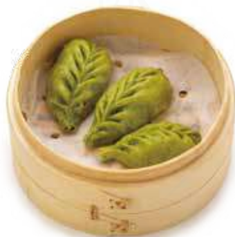
24 GREEN GYOZA (4pz) ravioli con verdure miste €5.00