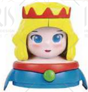
PRINCIPESSA € 4.50