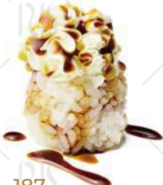
187 NIDO PHILA Philadelphia, salsa teriyaki €3.00