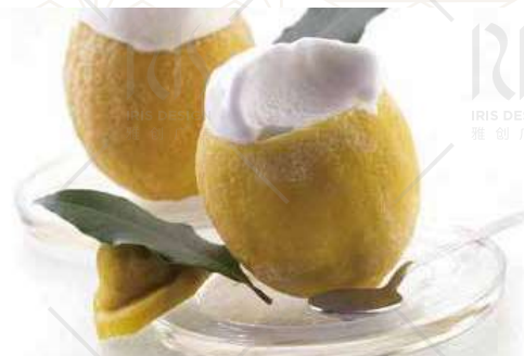
LIMONE RIPIENO € 6.00