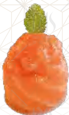
180 SAKE Salmone €5.00