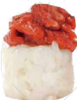
186 NIDO SAKE Salmone, salsa teriyaki €3.50