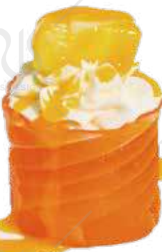
184 SAKE MANGO salmone philadelphia, mango €5.50