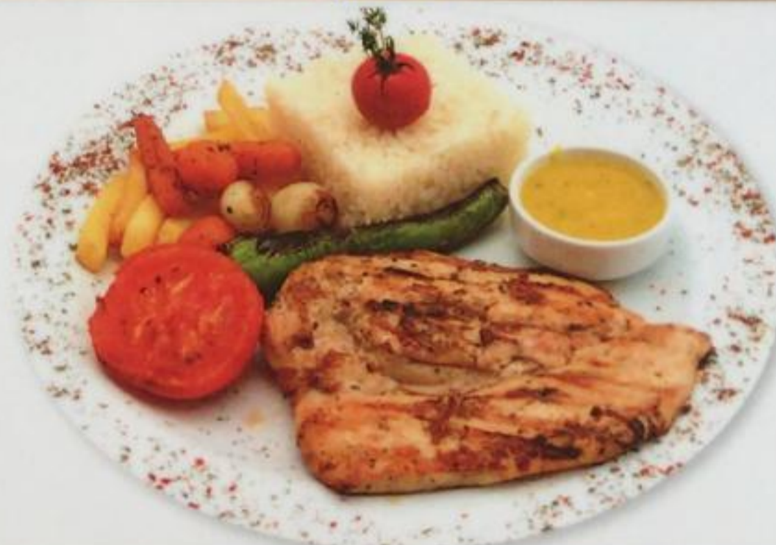
Chicken Steak / Tavuk Biftek Куриный Стейк