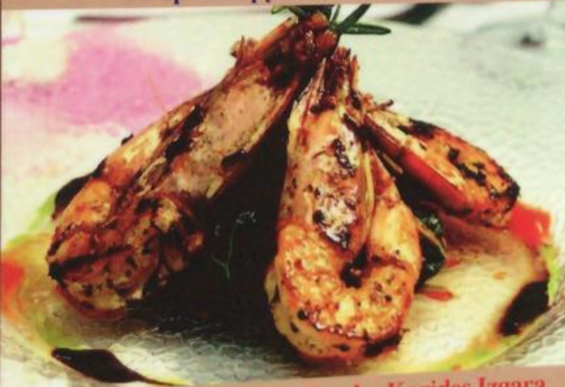
Grilled Jumbo Shrimp / Jumbo Karides Izgara Гигантские креветки на гриле