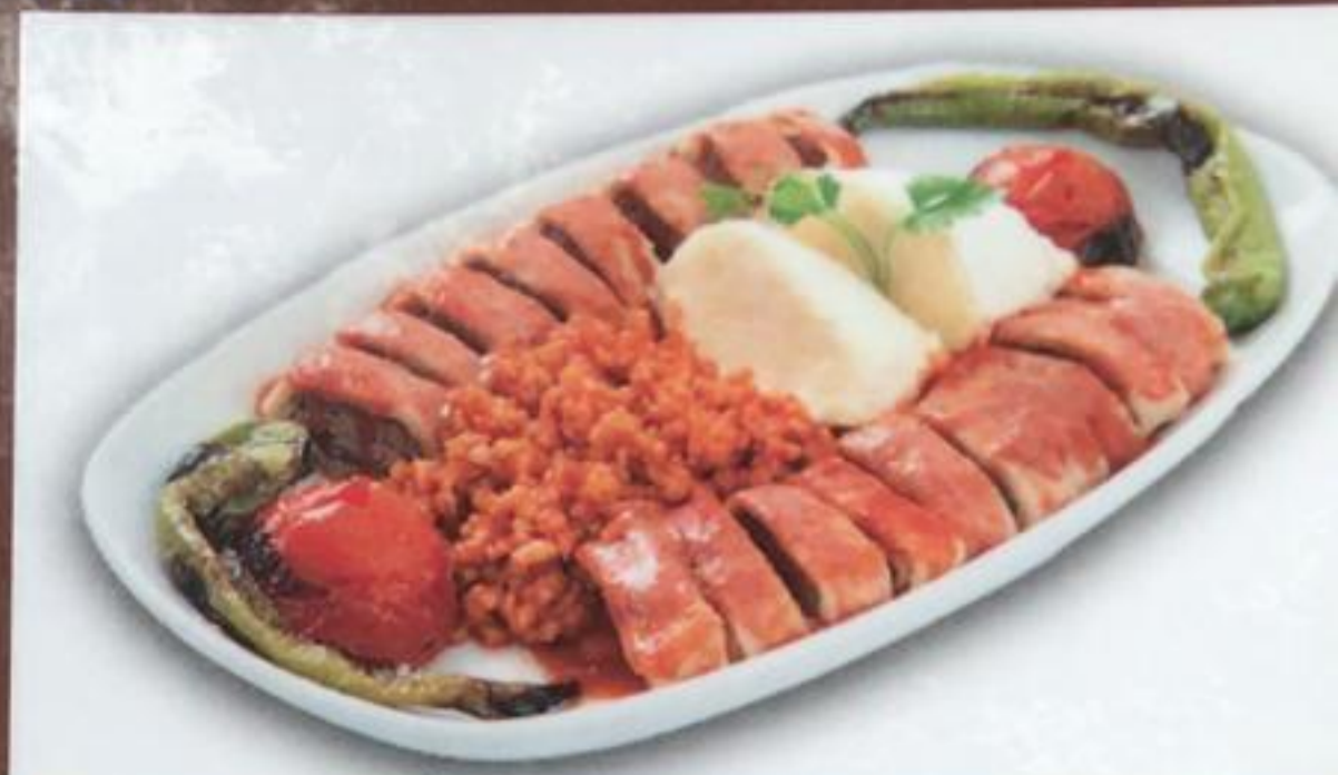
Beyti Kebab / Beyti Kebab «Бейти» кебаб