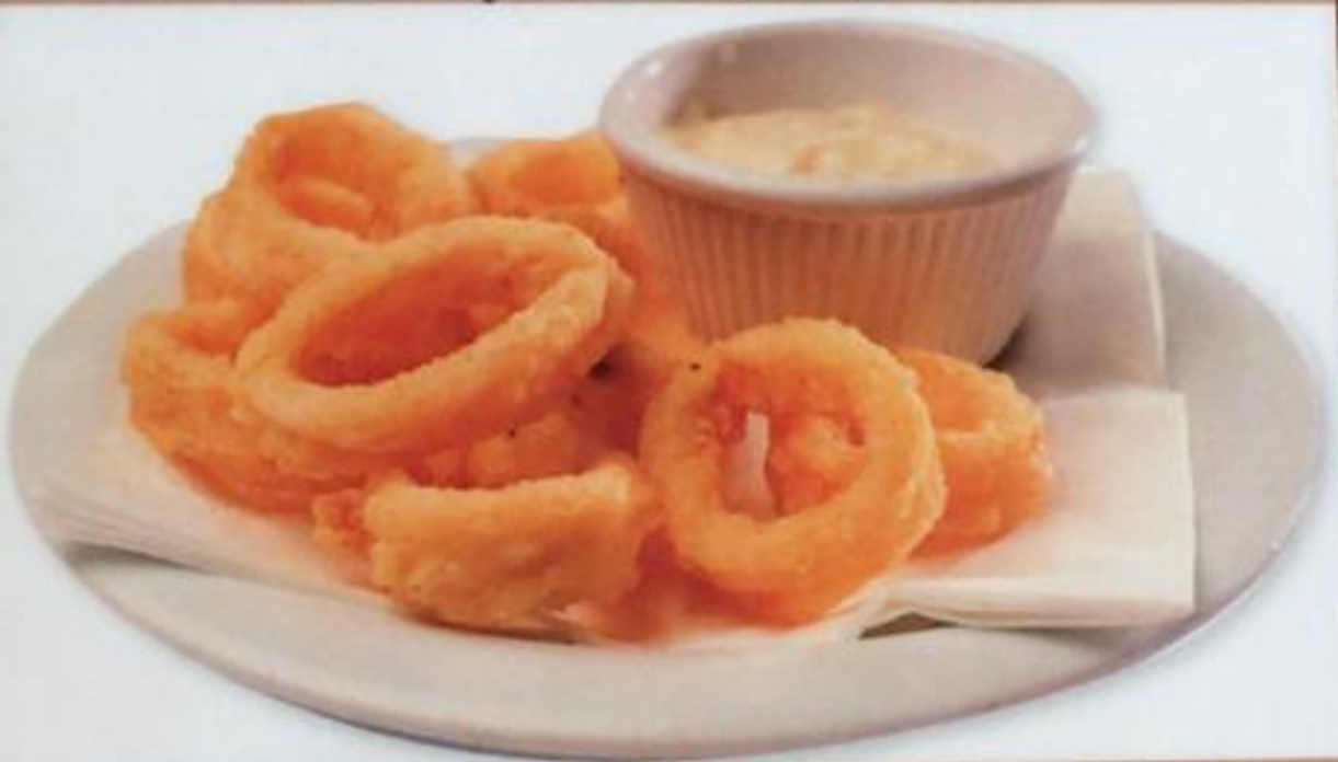
Calamari / Kalamar Кальмары