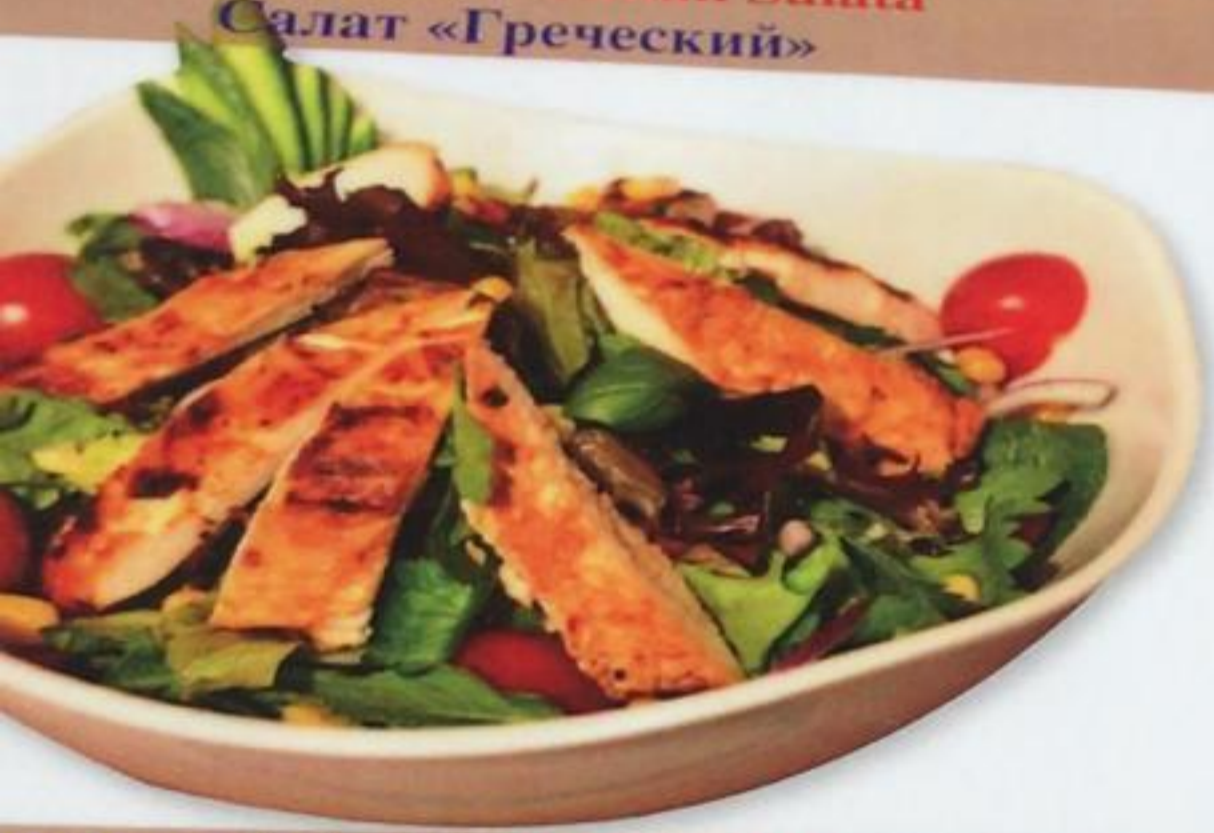
Chicken Salad / Tavuk Salata Куриный салат