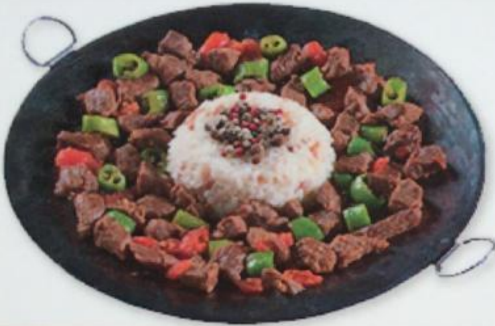
Lamb Wok / Kuzu Kavurma Тушеное мясо «Чобан»