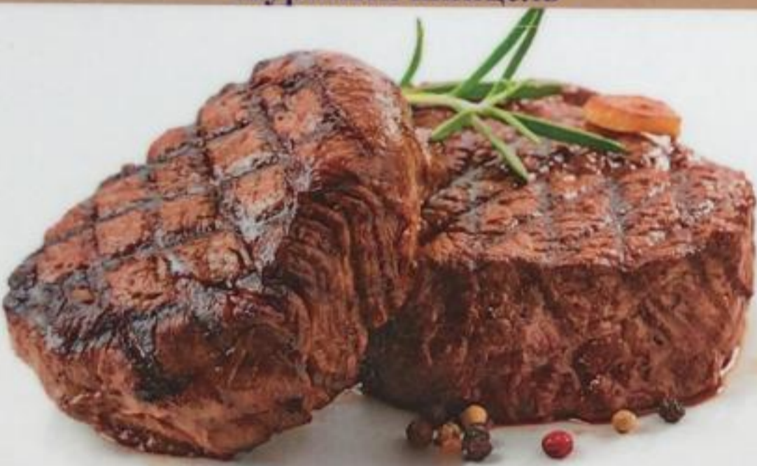
Special Marble Steak / Mermer Biftek Специальный мраморный стейк