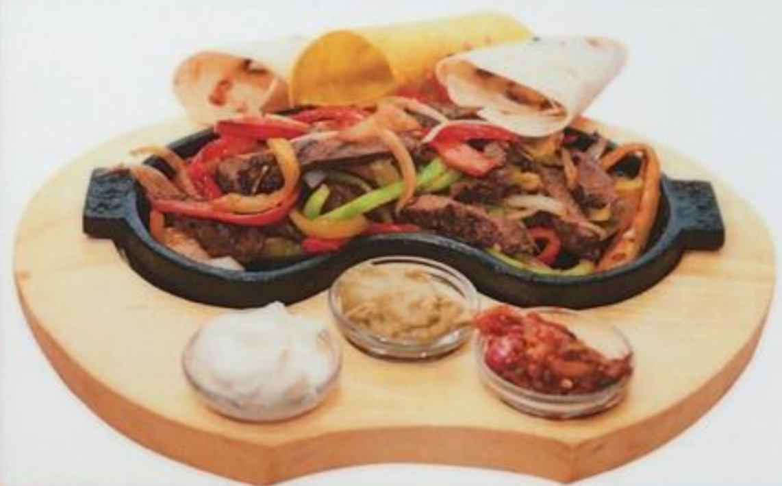
Fajitas / Fajitalar фахитас