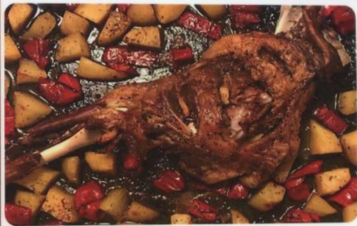
Lamb Limb / Kuzu Kol Баранья рулька / Kuzu Kol