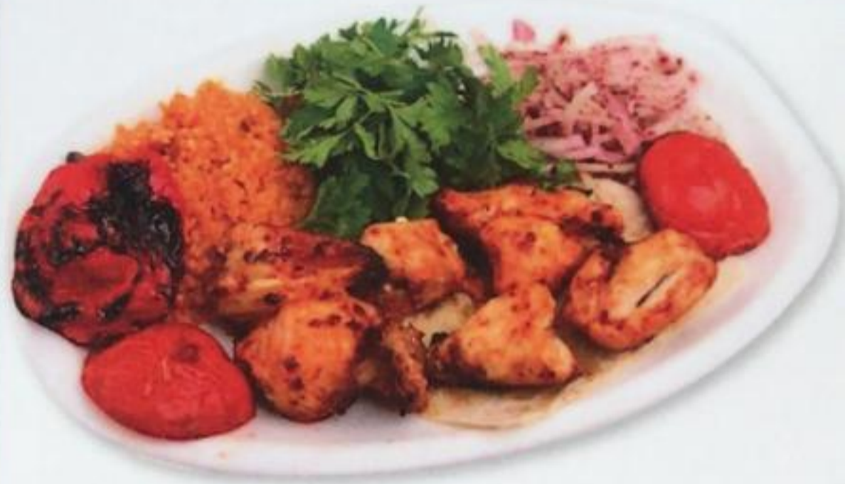
Chicken Shish / Tavuk Şiş Куриный шашлык