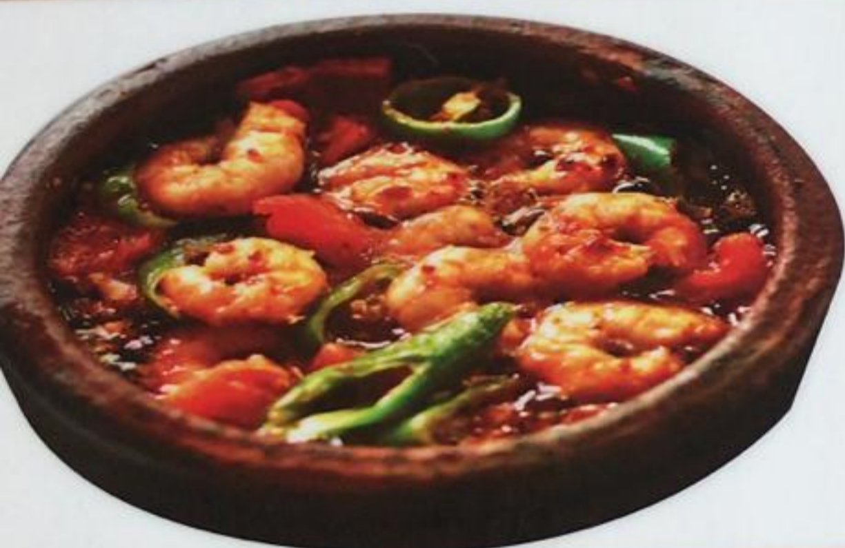
Shrimp Casserole / Karides Güveç Креветки, запеченные в глиняной посуде