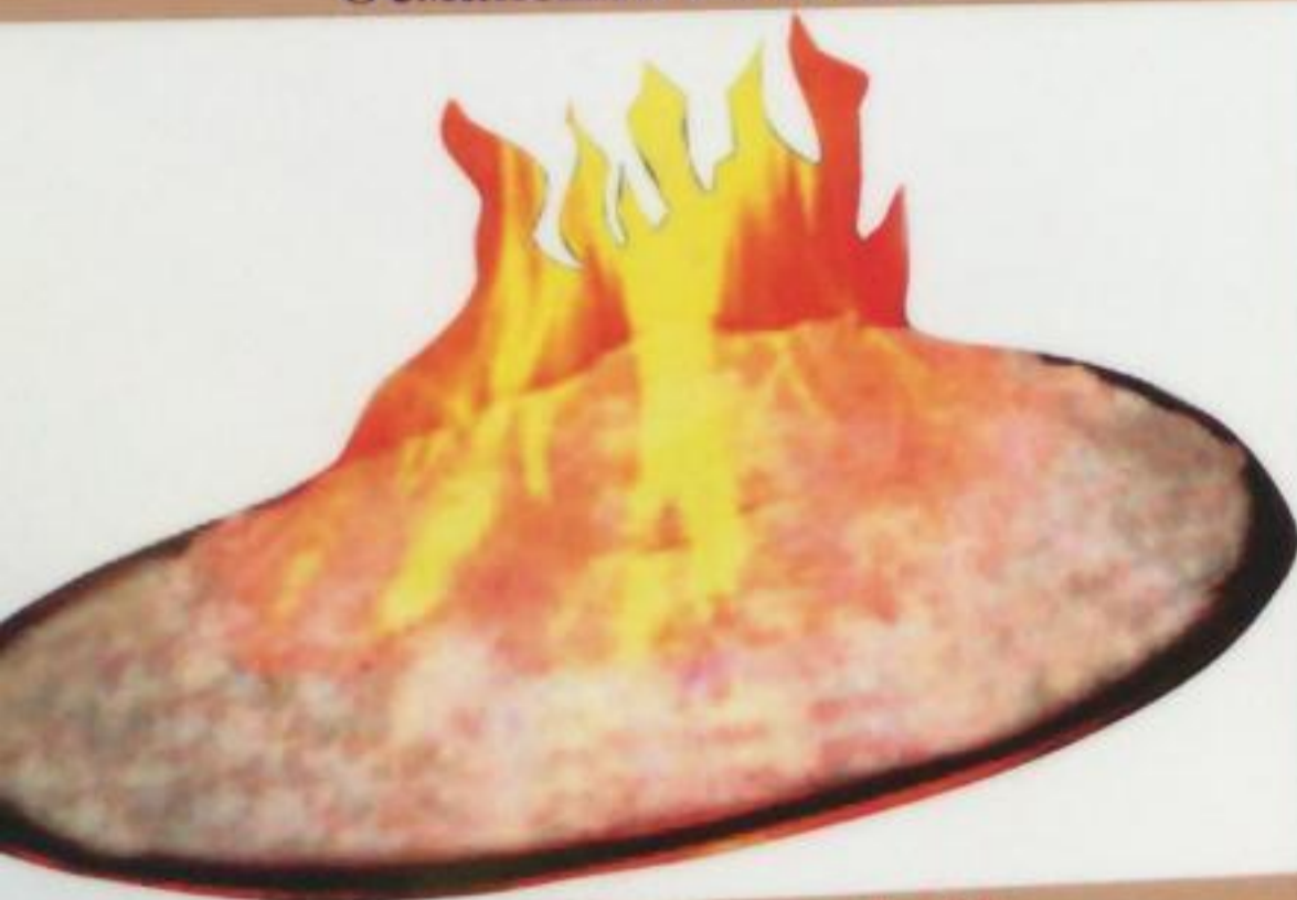
Fish in Salt / Tuzda Balık Рыба, запеченная в соли