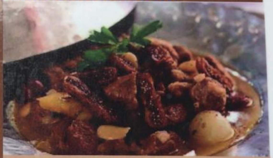
Mutancana Мутанджана (баранина)