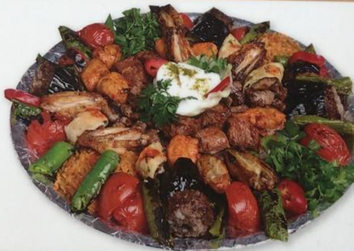
Mixed Kebab / Karışık Kebab Смешанный кебаб