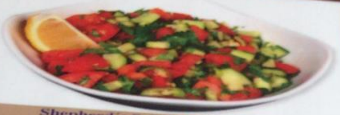
Shepherd's Salad / Çoban Salata Чобан салат