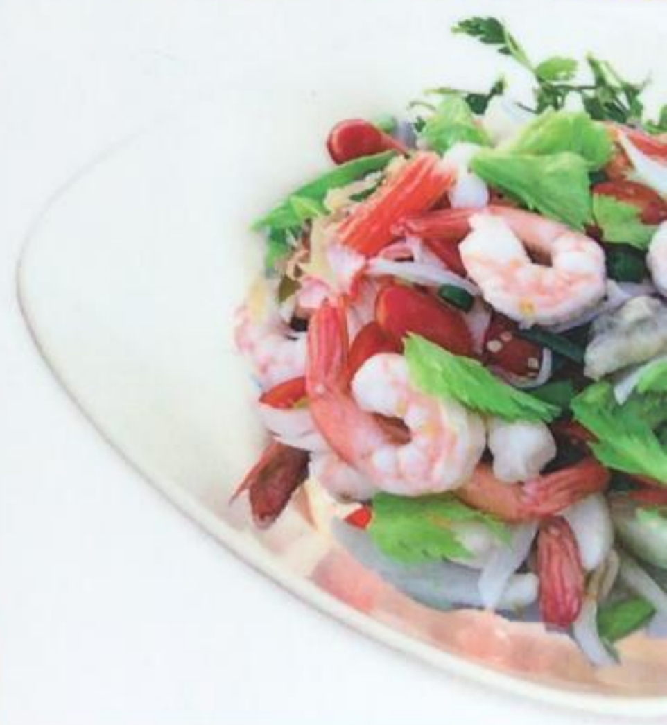
Sea Food Salad / Deniz Salata Салат из морепродуктов