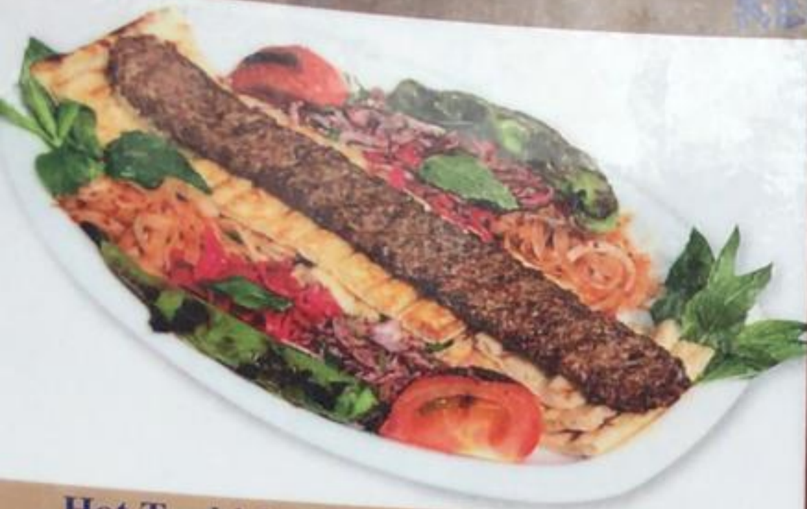
Hot Turkish Kebab / Adana Kebab «Адана» кебаб (Пряный турецкий кебаб)