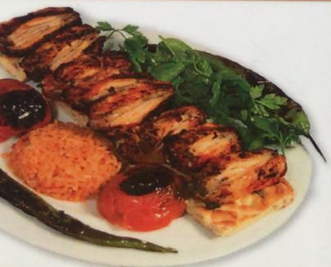
Chicken Wings / Tavuk Kanat Куриные крылышки