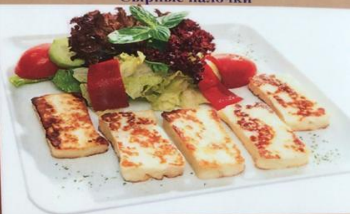
Grilled Hellim Cheese / Izgara Hellim Pe сыр Hellim на гриле