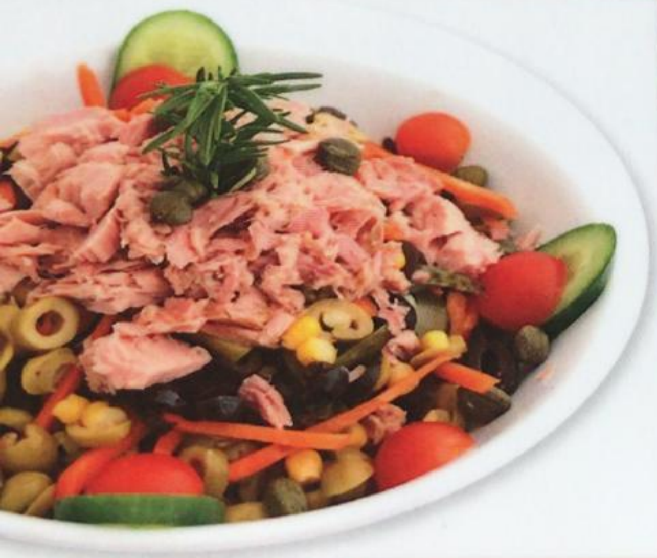
Tuna Salad / Ton Balikli Salata Салат с тунцом