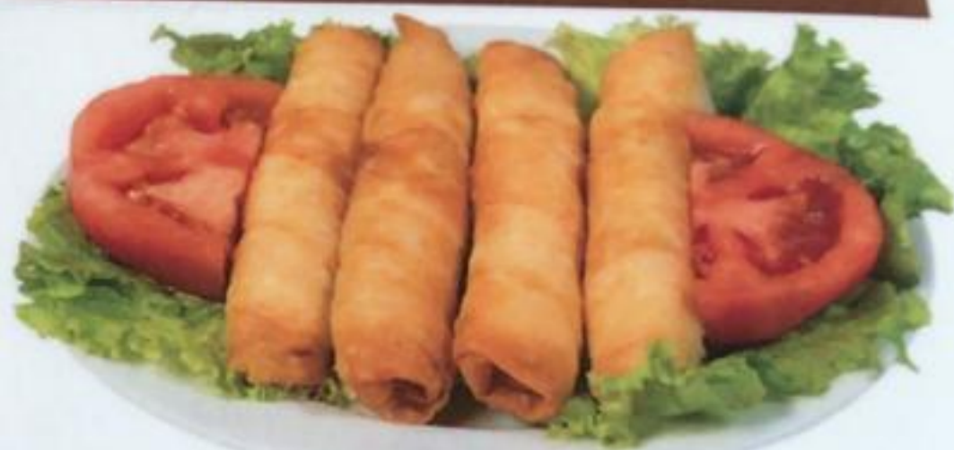
Cheese Rolls / Sigara Böreği Сырные палочки