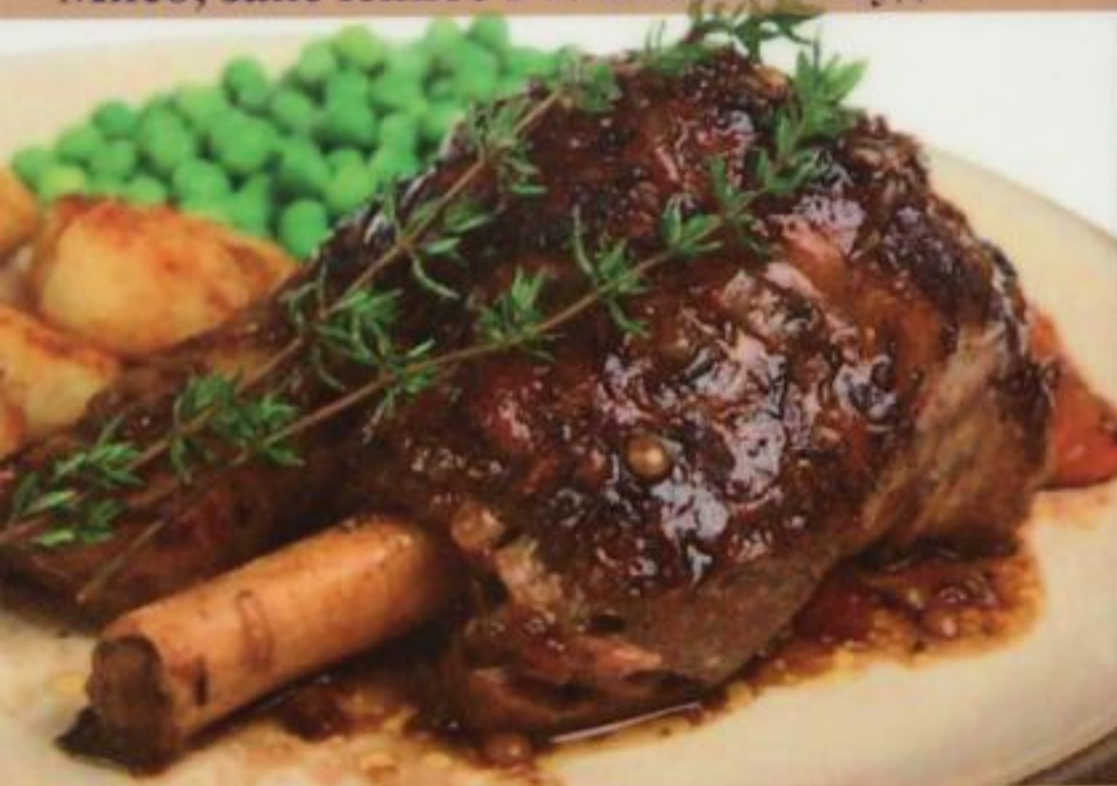
Lamb Tandoori / Kuzu Tandır Ягненок в тандыре