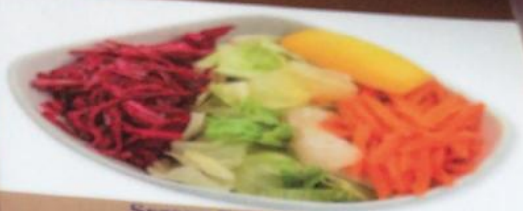
Season Salad / Mevsim Salata Салат «Сезонный»