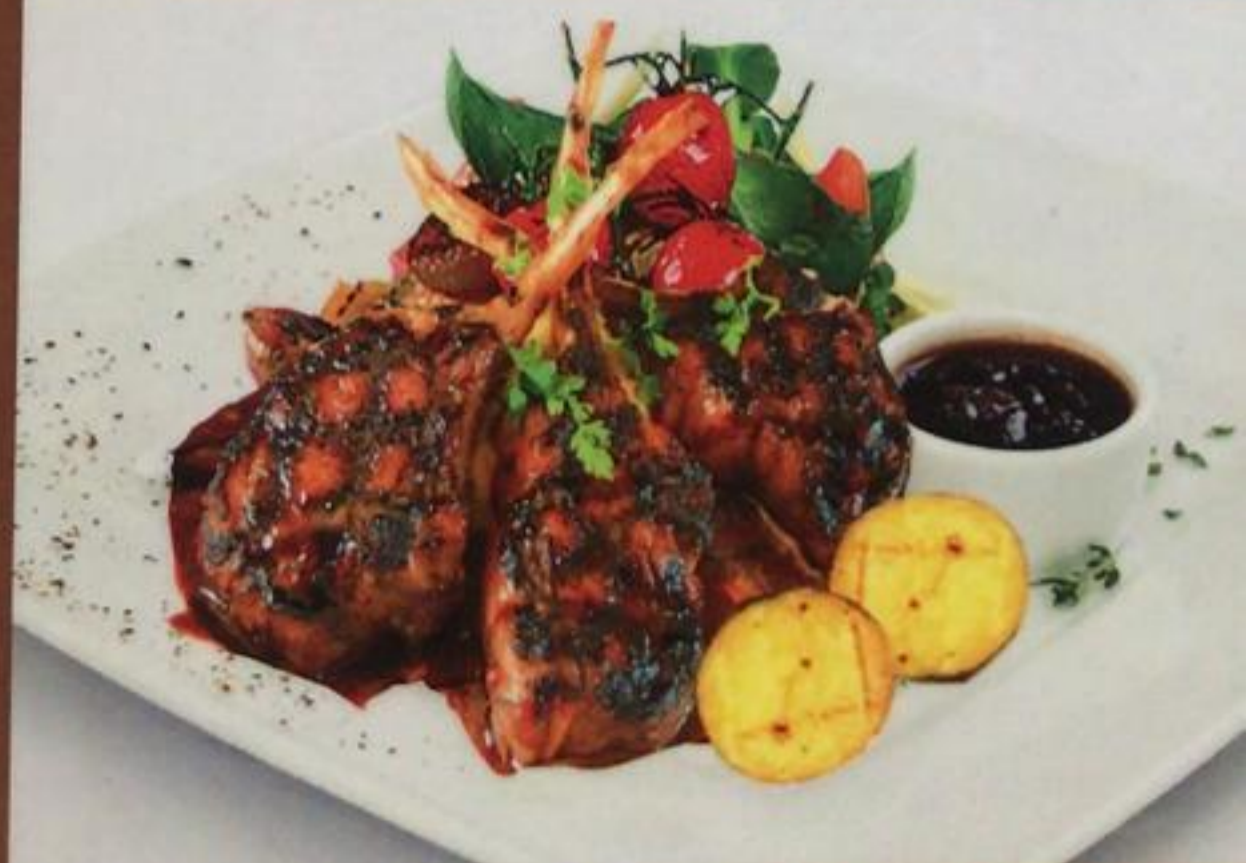
Lamb Chops / Kuzu Pirzola Баранья отбивная