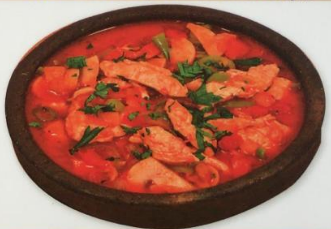
Casserole Chicken / Güveç Tavuk Курица с овощами в глиняной посуде