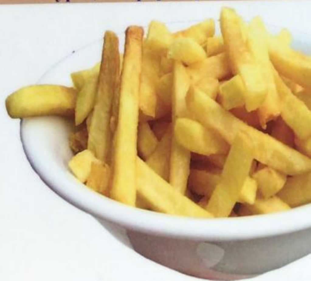
French Fries / Patates Kız Картошка-фри