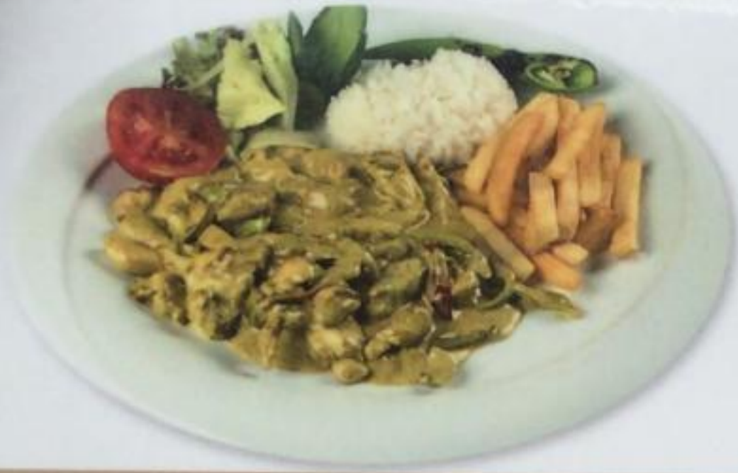
Chicken Curry / Tavuk Köri Курица карри