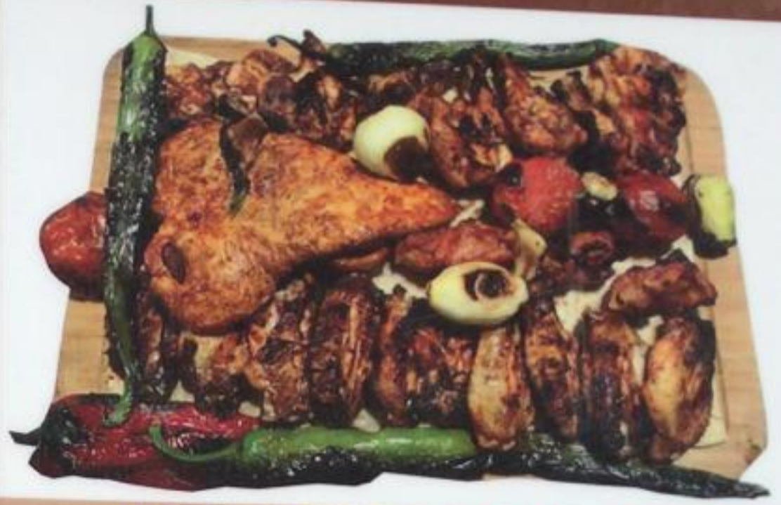
Babylonia Chicken / Babylonia Tavuk Babylonia курица