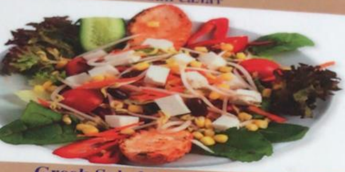
Greek Salad / Yunan Salata Салат «Греческий»