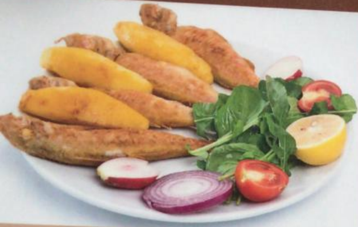
Red Mullet / Barbun Барабулька