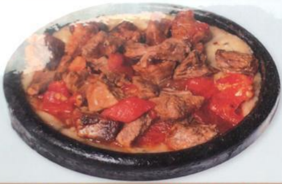
Sultan Favorite / Hünkar Beğend «Хюнкяр бегенди»

TRADITIONAL TURKISH & OTTOMAN CUISINE ТРАДИЦИОННАЯ ТУРКСКАЯ И ОСМАНСКАЯ КУХНЯ