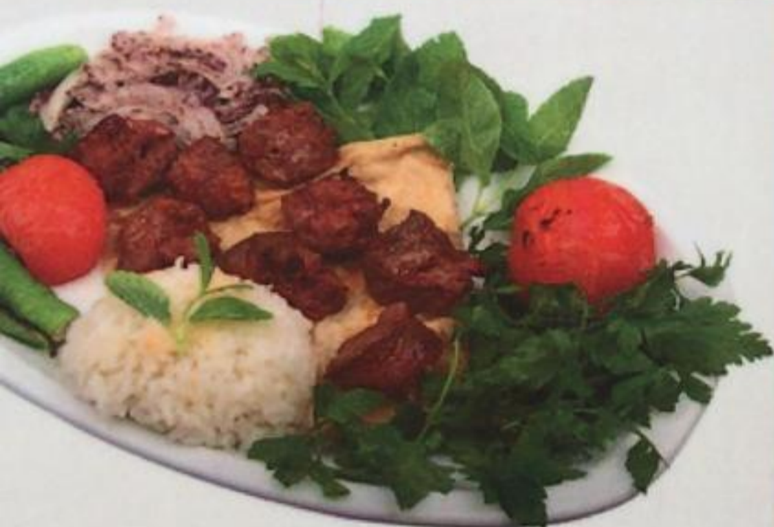
Lamb Shish / Kuzu Şiş Шашлык из ягнятины