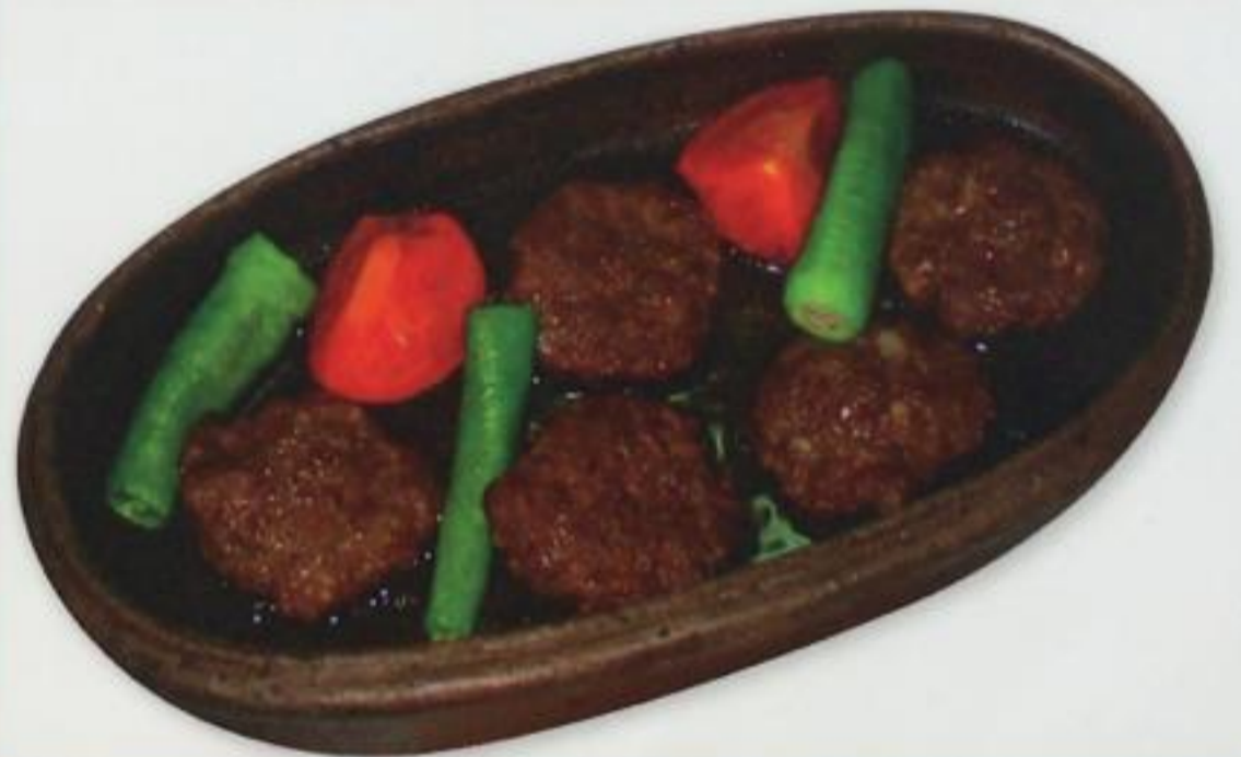
Casserole Meatball / Güveç Köfte Котлеты с овощами в глиняной посуде