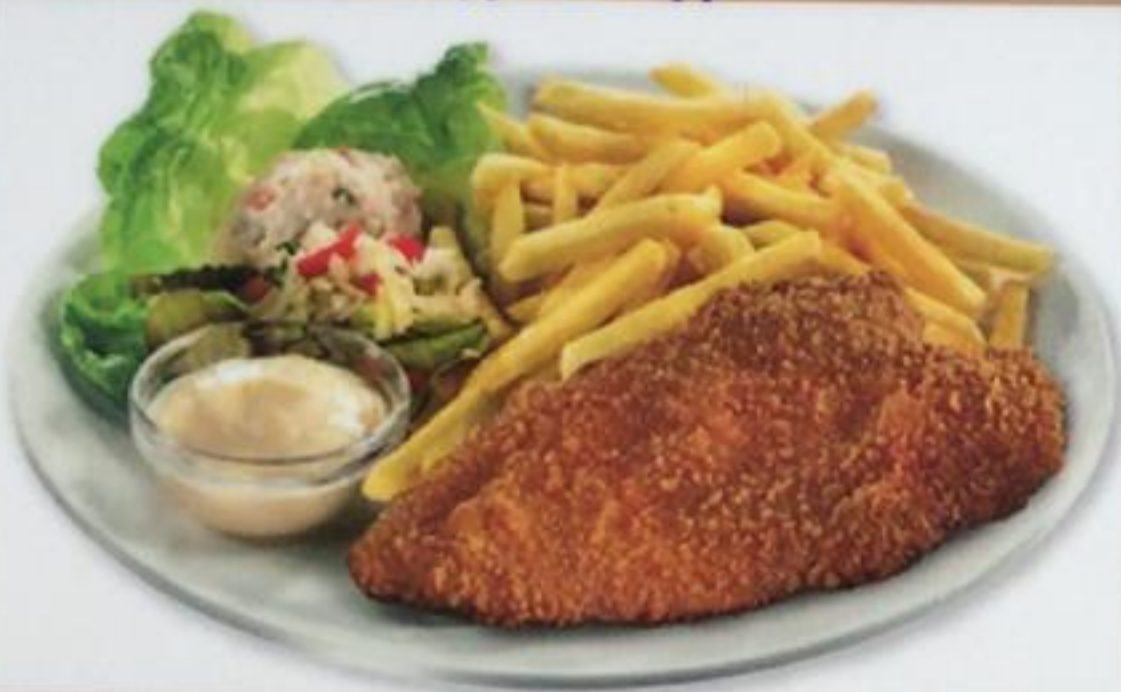
Chicken Schnitzel / Tavuk Şnitzel Куриный шницель