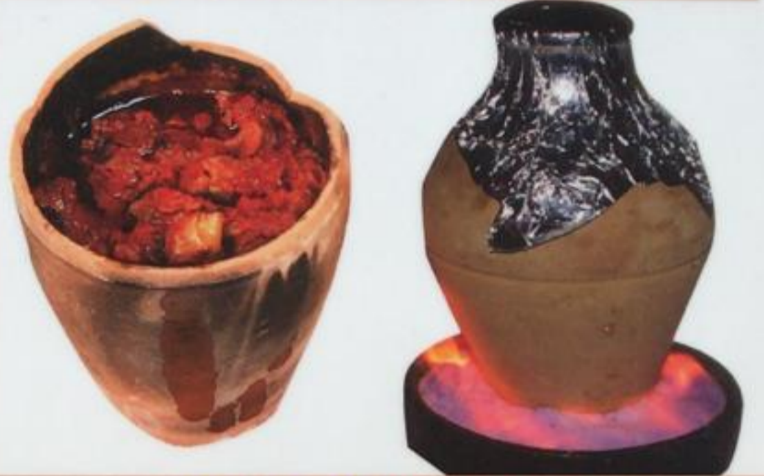
Testi Kebab / Testi kebab Мясо с овощами в глиняной посуде