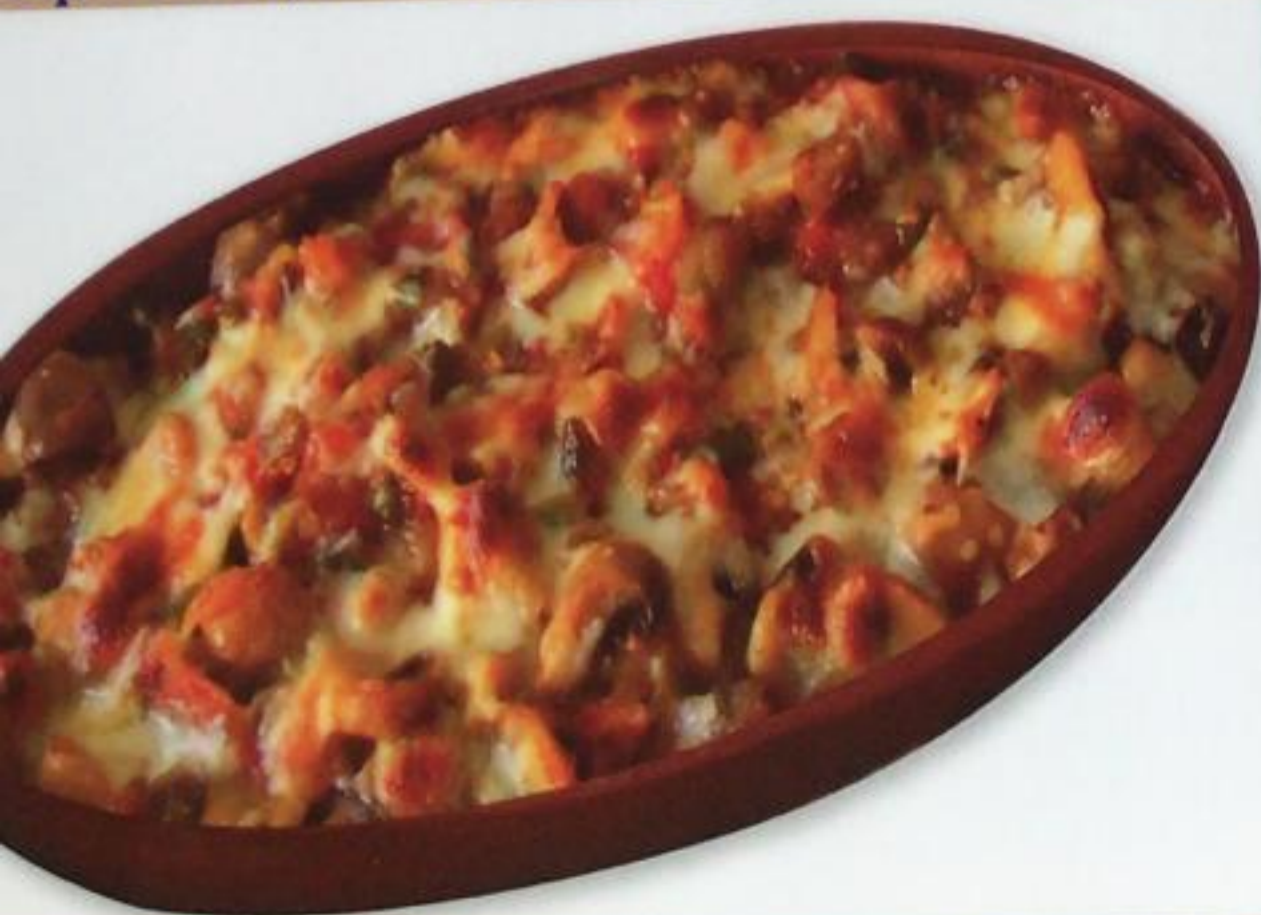
Mushroom Casserole / Mantar Güveç Грибы, запеченные в глиняной посуде