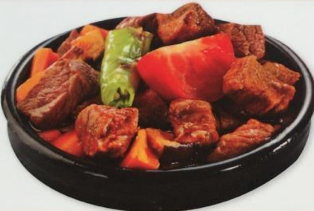
Casserole Lamb / Güveç Et Мясо, запеченное в глиняной посуде