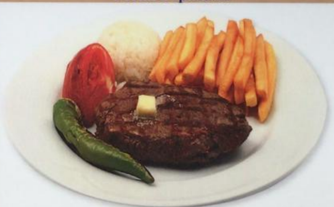
Pepper Steak / Biberli Biftek Стейк с перцем