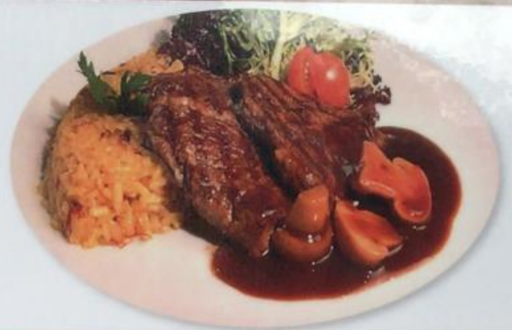
Mushroom Steak / Mantarlı Biftek Стейк с грибами