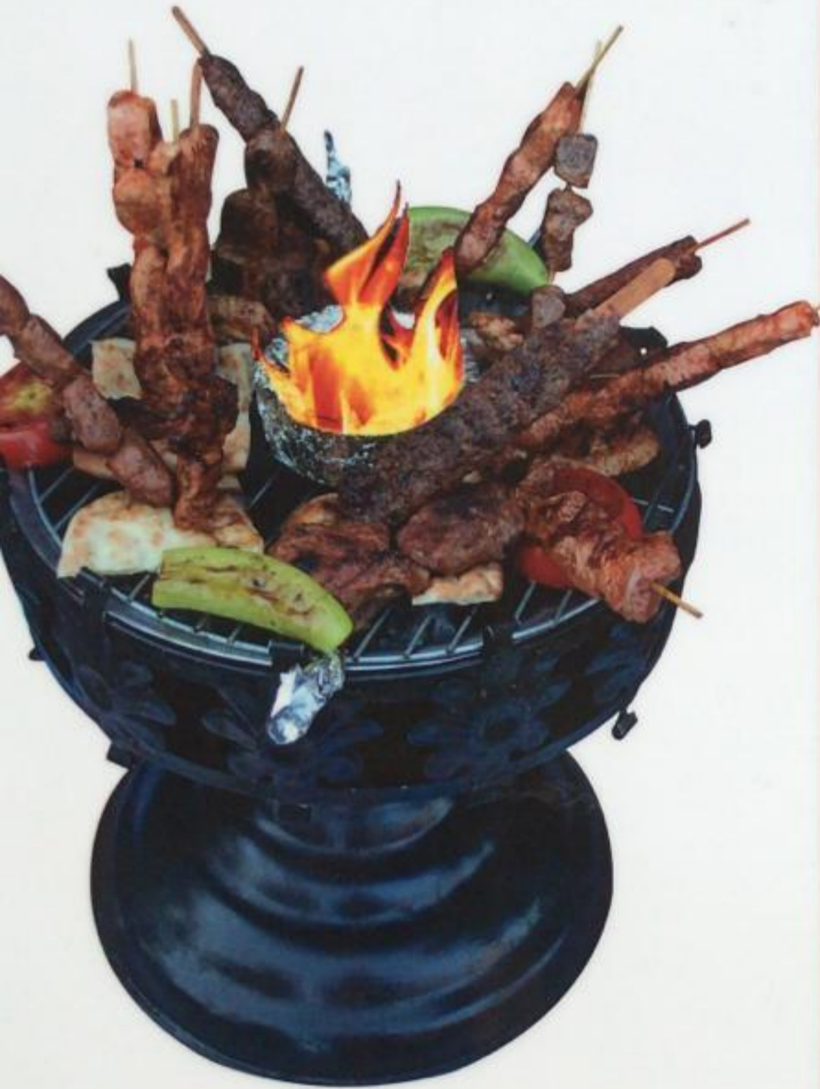
Ottoman Kebab / Osmanlı Kebap Османский шашлык