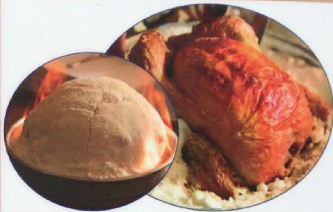
Salt in Chicken / Tuzda Tavuk Курица, запеченная в соли