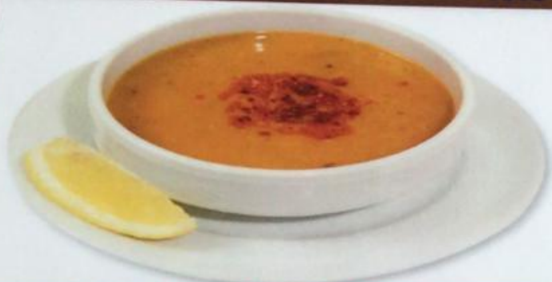
Lentil Soup / Mercimek Çorbasi Суп из чечевицы