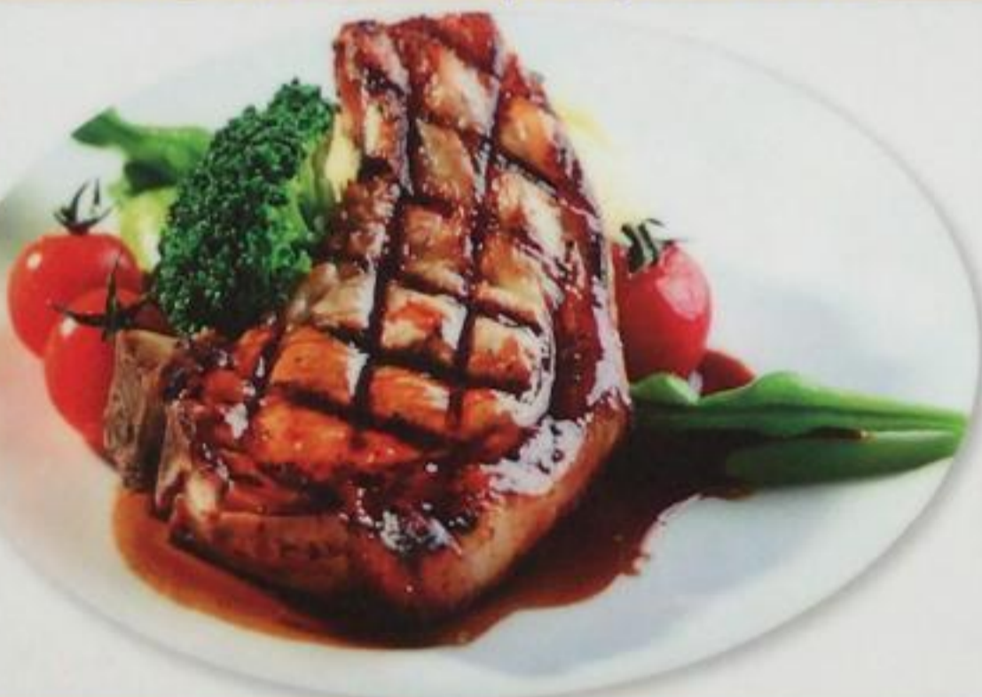
Mexican Steak / Meksikan Biftek Стейк по-мексикански