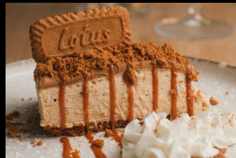
Tarta galletas Lotus € 5.50