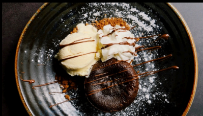
Coulant de chocolate € 5.50