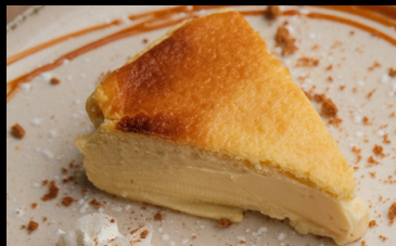
Tarta queso horno € 5.50