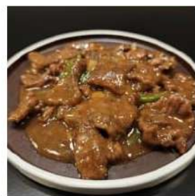
103 € 5,50 MANZO PEPE NERO manzo,peperoncino,pepe nero