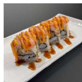
182 € 10,00 U.STELLA

maionese,gambero fritto, sopra spicy salmone,salsa piccante