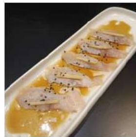
259.3 € 4,00 CARPACCIO BRANZINO AFFUMICATO sesamo,olio,salsa carpaccio