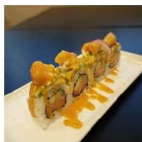
184 € 12,00 U.DAIFUKU

maionese sopra salmone affumicato, salsa piccante e teriyaki