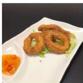
114 € 4,50