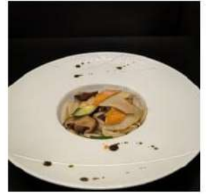
73 € 5,00 GNOCCHI DI RISO

spaghetti di soba saltato, verdure ,pollo,uova