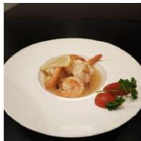
91 € 5,50 GAMBERI LIMONE gamberi,limone