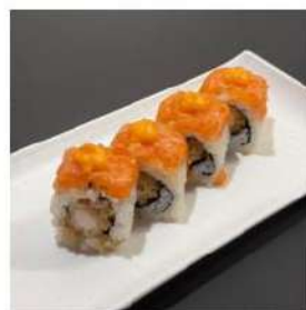
181 € 10,00 U.VULCANO

avocado,salmone,sopra salmone, tonno, branzino,avocado