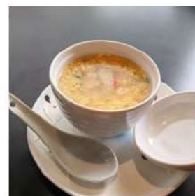
41 € 3,00 ZUPPA FRUTTI MARE