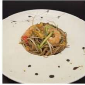
70 € 6,00 SOBA FRUTTI DI MARE

spaghetti di soba saltato, verdure,gamberi