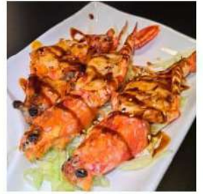
135 € 6,00 GAMBERONI gamberoni,pepe,teriyaki,sesamo