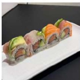
180 € 10,00 U.RAINBOW

maionese , gambero fritto , zucchine fritto, salmone , salsa teriyaki