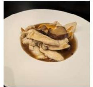
83 € 5,50 POLLO FUNGHI E BAMBU