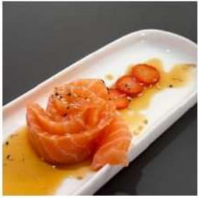
256 € 4,00 CARPACCIO SALMONE salmone,salsa carpaccio,sesamo