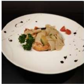
74 € 6,00 GNOCCHI DI RISO GAMBERI

gnocchi riso saltato,verdure, gamberi,uova