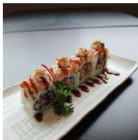
176 € 9,00 U.SAKE COTTO

Salmon e avocado ,phila crema tartufo e salsa teriyaki