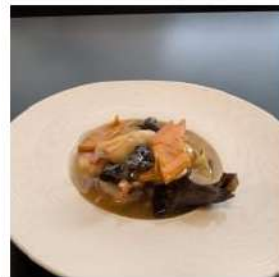
92 € 5,50 GAMBERI VERDURE gamberi,zucchine,carote