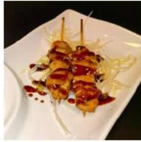
131 € 5,00 SPIEDINI POLLO pollo piastra,pepe,teriyaki, sesamo