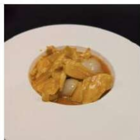
85 € 5,50 POLLO CURRY