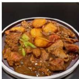
104 € 5,50 MANZO PATATE manzo,patate