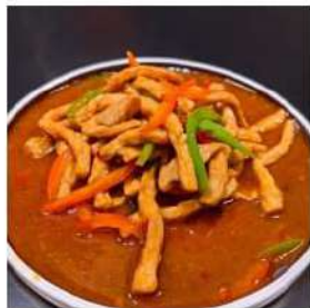
88 € 4,50 MAIALE SALTATO maiale,peperoncini,piccante