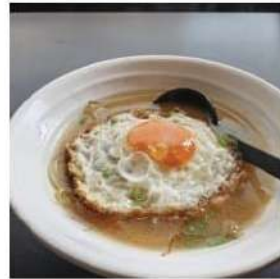
77 € 6,50 RAMEN BRODO FRUTTI DI MARE

ramen in brodo con verdure, frutti di mare,uova