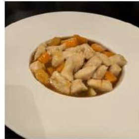
82 € 5,50 POLLO MANDORLE