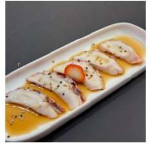
259 € 4,00 CARPACCIO POLIPO polipo,salsa carpaccio,sesamo