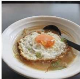
76 € 6,50 RAMEN BRODO MANZO

gnocchi riso saltato,verdure, gamberi,uova