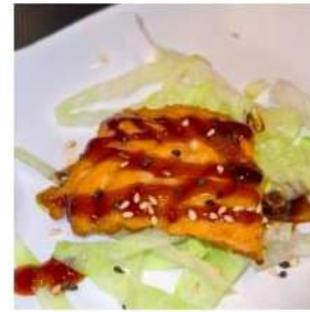
137 € 6,00 SALMONE salmone piastra,pepe,teriyaki, sesamo