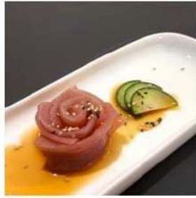
257 € 4,00 CARPACCIO TONNO tonno,salsa carpaccio,sesamo