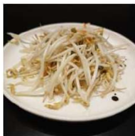
106 € 3,50 GERMOGLI DI SOIA germogli soia saltati