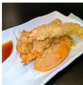
112 € 4,50