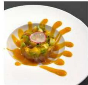
265 € 6,00 TARTARE SUZUKI branzino,avocado,salsa mango,sesamo