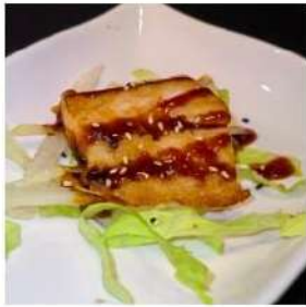
136 € 6,00 BRANZINO branzino piastra,pepe,teriyaki, sesamo