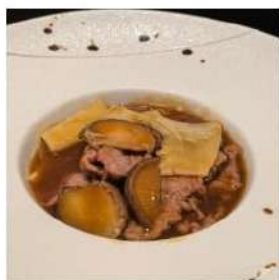
100 € 5,50 MANZO FUNGHI E BAMBU manzo,funghi,bambu