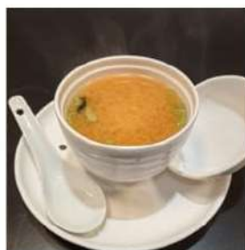
40 € 3,00 ZUPPA MISO