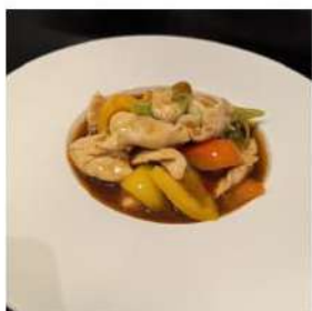
84 € 5,50 POLLO PICCANTE