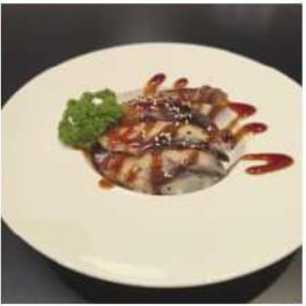
262 € 6,00 CHIRASHI ANAGO anago,sesamo,teriyaki