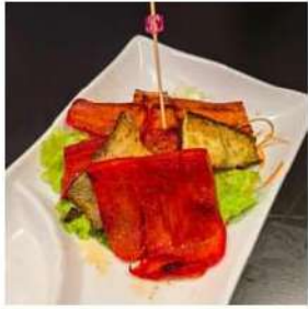
130 € 3,00 VERDURE PIASTRA peperoncini,zucchine,carote