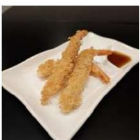
111 € 4,50