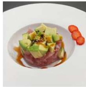
264 € 6,00 TARTARE MAGURO tonno,avocado,salsa tartar,sesamo