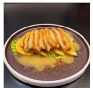
87 € 5,50 ANATRA ARANCIA