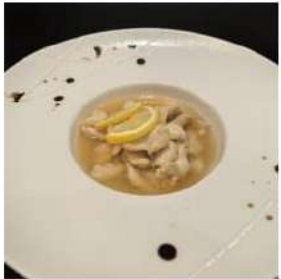
80 € 5,50 POLLO LIMONE