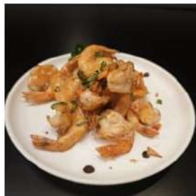
90 € 5,50 GAMBERI SALE E PEPE gamberi,sale,pepe