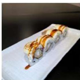
185 € 8,00 U.CHEESE

avocado, sopra mozzarella di bufala , amacbi, salsa mango