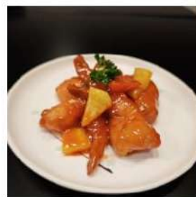
96 € 5,50 GAMBERI AGRODOLCE gamberi,salsa agrodolce