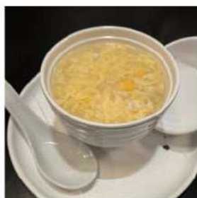
39 € 3,00 ZUPPA DI POLLO