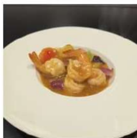
94 € 5,50 GAMBERI PICCANTE gamberi,salsa piccante, peperoni,cipolla