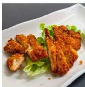
116 € 5,50