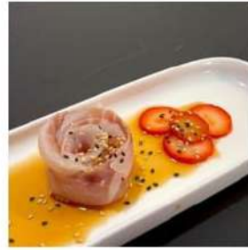
258 € 4,00 CARPACCIO SUZUKI branzino,salsa carpaccio,sesamo