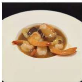
93 € 5,50 GAMBERI FUNGHI E BAMBU gamberi,funghi,bambu