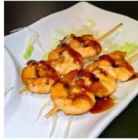
132 € 5,00 SPIEDINI GAMBERI gamberi piastra,pepe,teriyaki, sesamo