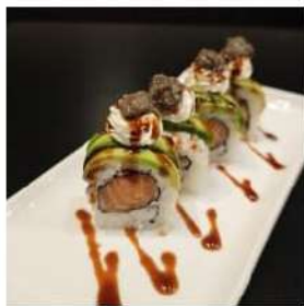
175 € 10,00 U.CREMA TARTUFO

Salmon e avocado ,phila crema tartufo e salsa teriyaki