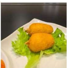
115 € 3,50