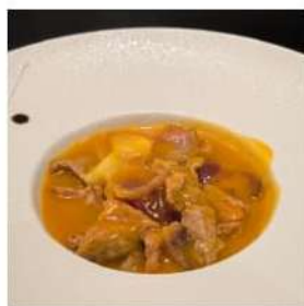
102 € 5,50 MANZO CURRY manzo curry,cipolla,carote