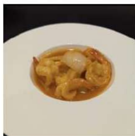
95 € 5,50 GAMBERI CURRY gamberi al curry,cipolla,bambu