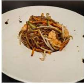
68 € 6,00 SOBA GAMBERI

spaghetti di soba saltato, verdure,gamberi