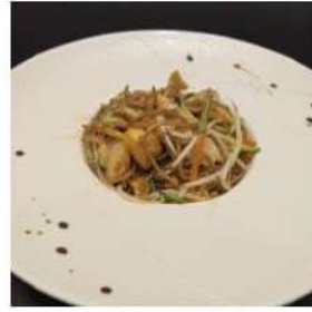
71 € 6,00 SOBA POLLO

spaghetti di soba saltato,frutti di mare,verdure,uova