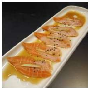
259.1 € 4,00 CARPACCIO SAKE AFFUMICATO sesamo,olio,salsa carpaccio