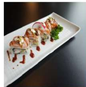
178 € 10,00 U.PISTACCHIO

mango,salmone,philadelphia, sopra mango e salsa speciale