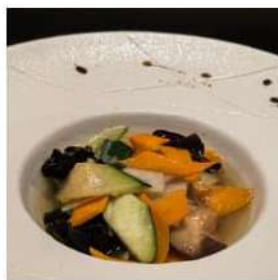
105 € 3,50 VERDURE MISTE verdure,saltate