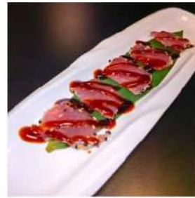
138 € 7,00 TATAKI TONNO tonno scottato,sesamo,teriyaki