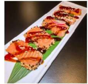
139 € 6,00 TATAKI SALMONE salmone scottato,sesamo,teriyaki