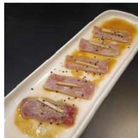
259.2 € 4,00 CARPACCIO TONNO AFFUMICATO sesamo,olio,salsa carpaccio