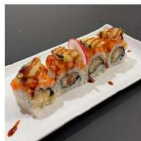
179 € 10,00 U.FLOWER

gamberoni in tempura, avocado,sopra salmone scottato, philadelphia,pistacchio,salsa ter