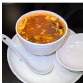
38 € 3,00 ZUPPA AGROPICCANTE