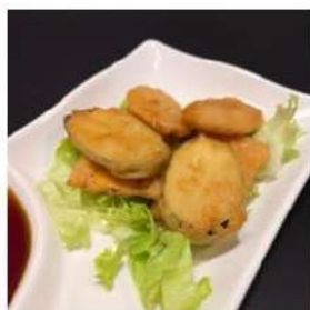
110 € 3,00