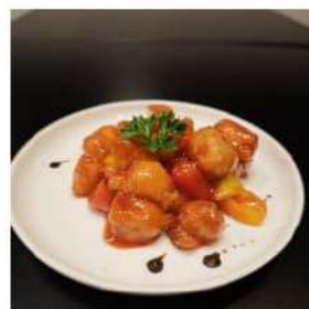
86 € 5,50 POLLO AGRODOLCE