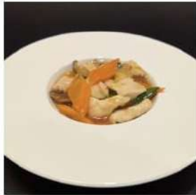
81 € 5,50 POLLO VERDURE