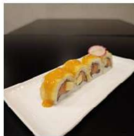
177 € 9,00 U.ORO

salmone alla piastra,avocado, salmone,philadelphia, mandorle,salsa teriyaki