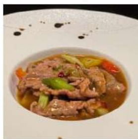
101 € 5,50 MANZO SALSA PICCANTE manzo,salsa piccante,peperoni, cipolla