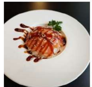
260 € 6,00 CHIRASHI SAKE salmone,sesamo,teriyaki