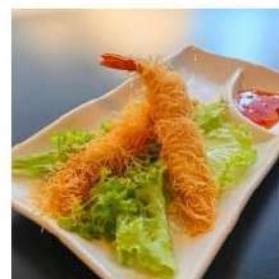
113 € 3,50