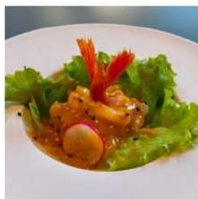
266 € 4,50 TARTAR AMAEBI amaebi,salsa mango