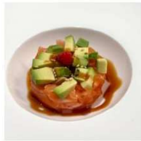
263 € 6,00 TARTARE SAKE salmone,avocado,salsa tartar,sesamo