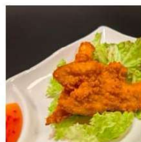
117 € 4,00