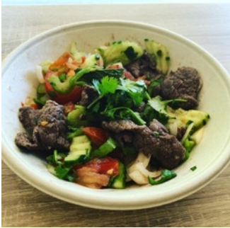
Salade de bœuf grillé à la plancha (plat mi-chaud)

Tomates, oignons, céleri, menthe, coriandre, concombres