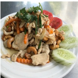
Poulet Sauté au noix de cajou

Sauté avec légumes frais et servi avec du riz parfumé au jasmin