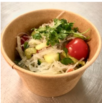
Salade de vermicelle végétal

Salade de poulet (ou haché de porc) aux épices thaï épicée