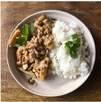
Poulet sauté au basilic thaï

Effiloché de porc caramélisés aux 5 parfums et servi avec du riz parfumé au jasmin