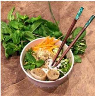
Bo Bun (Plat mi-chaud)

Tomates, oignons, céleri, menthe, coriandre, concombres