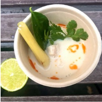
Tom Kha Kai

Soupe de poulet au lait de coco aromatisée à la citronnelle et aux herbes thaï (Choix Tofu possible pour une version végétarienne)