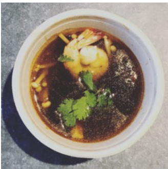
Tom Yam Koong

Soupe de poulet au lait de coco aromatisée à la citronnelle et aux herbes thaï (Choix Tofu possible pour une version végétarienne)