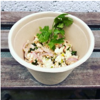
Laab Kai ou Laab Moo

Salade de mangue fraîche et carottes râpées aux herbes thaï et aux cacahuètes épicée