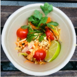
Salade de mangue

Salade de mangue fraîche et carottes râpées aux herbes thaï et aux cacahuètes épicée