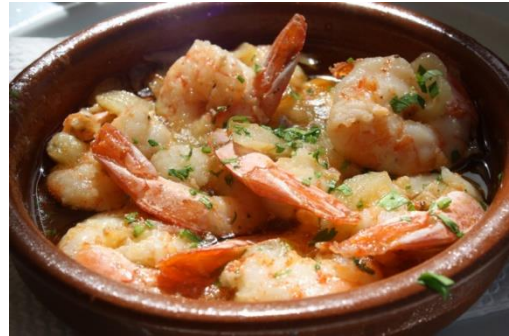
Gambas met look