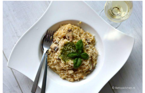
Risotto met champignons