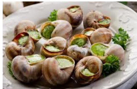
Escargots de bourgogne