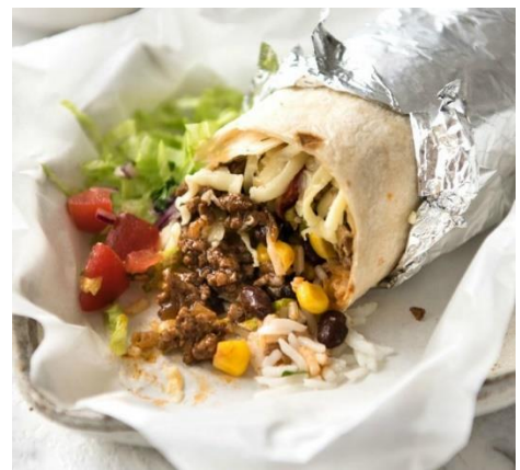
Burittos met gehakt en groenten