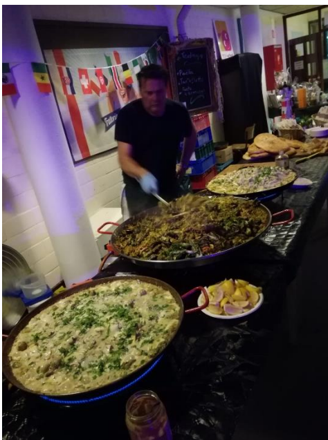
Meditarenean big pan buffet