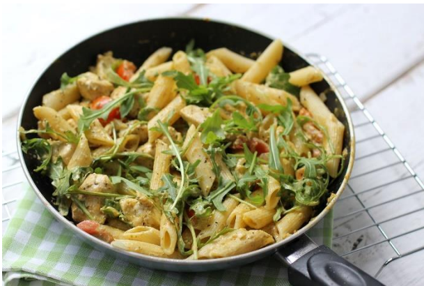
Pasta kip pesto