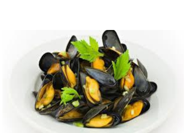
Mosseltjes à la plancha