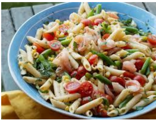
Macaroni shrimp salade