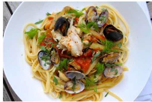
Pasta met zeevruchten