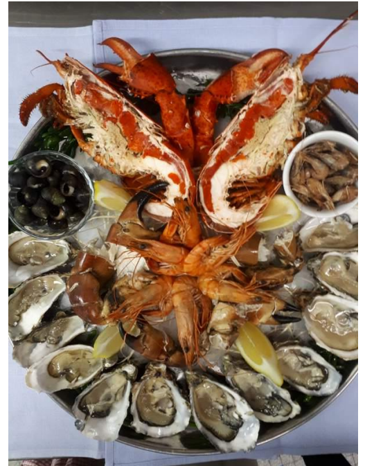
Plateau fruits de mer