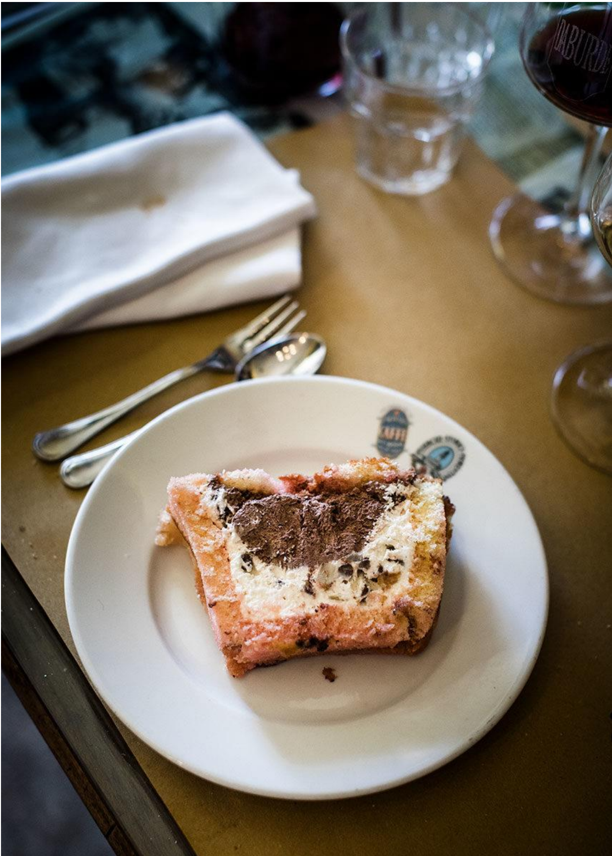
Torta di Mele, Schiacciata con l'uva (da Settembre a Novembre), Zuppa inglese Schiacciata con lo zibibbo, Schiacciata alla Fiorentina (durante Carnevale), Crostate di frutta fresca, Crostate con confettura Chiaverini (albicocca, frutti di bosco, ciliegia), Crostata di pere e nocciole, Crostata fichi e mandorle (Ottobre e Novembre), Creme Caramel €4,50