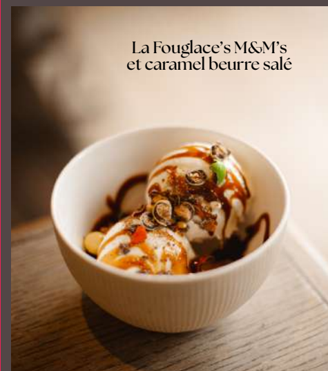
La Fouglacé's M&M's et caramel beurre salé

Fruits au choix : pommes, poires, melon, bananes, ananas, fraises Sauce maison au choix : caramel beurre salé, chocolat noir, chocolat blanc, coulis de fruits rouges