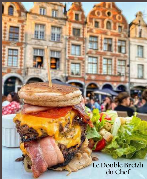
Le Double Breizh du Chef