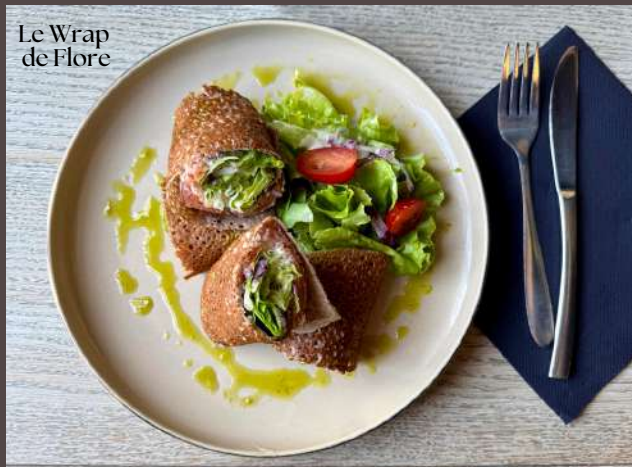
Le Wrap de Flore