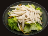
A1. Salade Poulet 4,70€ Salade, carottes, soja, poulet, sauce maison