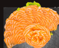
S1. Saumon 20,00€ 20 pièces OU 10 pièces (10,00€)