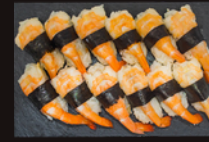
P19 22,00€ 12 Sushi crevette OU par 6 (11,00€)