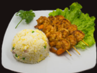
A11. Crevettes Satay 14,50€ Brochettes de crevettes au satay, riz cantonnais ou nature ou nouilles