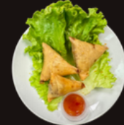
Q1. Samoussas boeuf 4,00€ Q2. Beignets de calamar 4,90€ 3 pièces