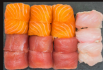
P14 33,00€ 6 Las Vegas saumon 6 Las Vegas thon 4 Las Vegas daurade