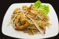
A4. Nouilles Sautées 13,50€ CREVETTES OU POULET Nouilles fines de blé tendre, légumes