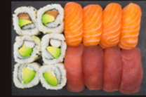
P29 17,60€ 6 Californiens: avocat saumon, avocat surimi, avocat fromage 8 Sushi: saumon, thon