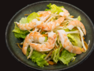
A2. Salade Crevettes 4,90€ Salade, carottes, soja, crevettes, sauce maison