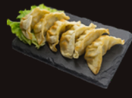
E7. Gyoza Poulet 6,90€ E8. Gyoza Légumes 6,90€ (Gyoza: ravioli japonais)