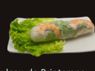
E15. Rouleau de Printemps 3,50€