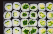
P8 14,80€ 8 Maki avocat 8 Maki concombre 8 Maki Wakame