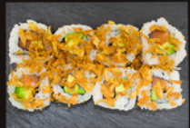
P3 8,80€ 8 Maki californiens oignons frits saumon, avocat