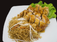
A9. Poulet Croustillant 13,50€ Poulet croustillant, sauce yakitori maison, nouilles ou riz