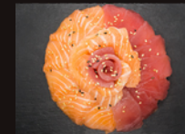
C3. Thon Saumon 19,50€ Chirachi thon & saumon et grand bol de riz vinaigré