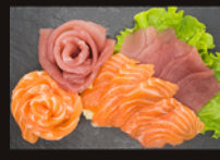
S2. Thon & Saumon 22,00€ 20 pièces OU 10 pièces (11€)