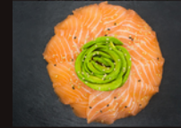
C2. Saumon Avocat 19,00€ Chirachi saumon, avocat et grand bol de riz vinaigré