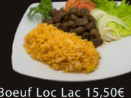
A10. Boeuf Loc Lac 15,50€ Emincé de boeuf mariné, salade, tomates, oignons, riz (supplément oeuf : 1€)