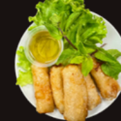
Q4. Nems au poulet 5,50€ 5 pièces