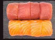
P13 17,50€ 4 Las Vegas saumon 4 Las Vegas thon