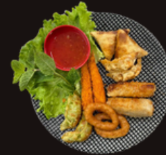
Q5. Box à partager 13,50€ 12 pièces