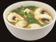
E1. Soupe Miso E2. Soupe Miso Saumon 3,90€