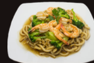
A5. Udon 13,50€ CREVETTES OU POULET Nouilles japonaises de blé tendre, brocolis, oeuf