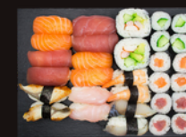
P32 40,00€ 16 Sushi: thon, saumon, crevette, daurade, maquereau, 2 Futo Maki 12 Maki: concombre, saumon, thon