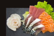
S3. Assortiment Poisson 18,00€ 16 pièces: saumon, thon, maquereau, daurade