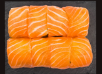
P12 16,60€ 8 Las Vegas saumon