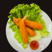
Q3. Tempuras 5,10€ 3 pièces