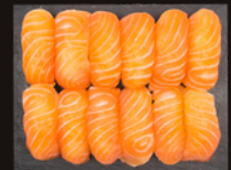
P17 22,00€ 12 Sushi saumon OU par 6 (11,00€)