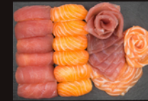
P30 40,00€ 20 Sashimi: thon, saumon 12 Sushi: thon, saumon