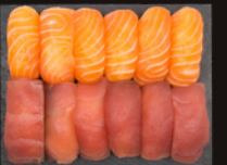
P18 23,90€ 12 Sushi thon saumon OU par 6 (12,00€)