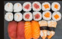
P28 17,60€ 12 Maki: surimi, thon saumon 6 Sushi: thon, saumon, crevette