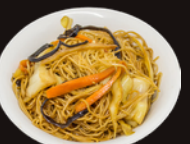
E14. Nouilles Légumes 3,50€