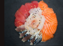
C4. Assortiment Poisson 19,50€ Chirachi thon, saumon, daurade, maquereau et grand bol de riz vinaigré