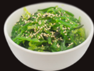
E6. Salade Wakame 3,90€ Salade d'algues japonaises