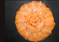
C1. Saumon 17,50€ Chirachi saumon et grand bol de riz vinaigré