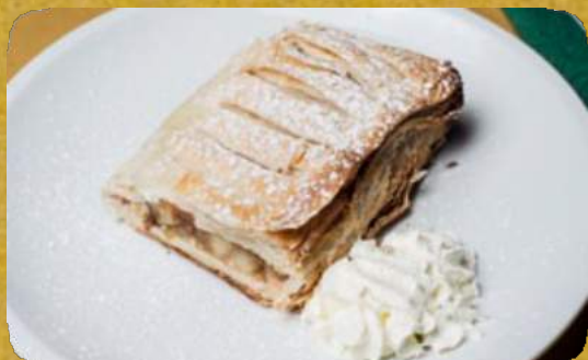
STRUDEL DI MELE - (* APPLE