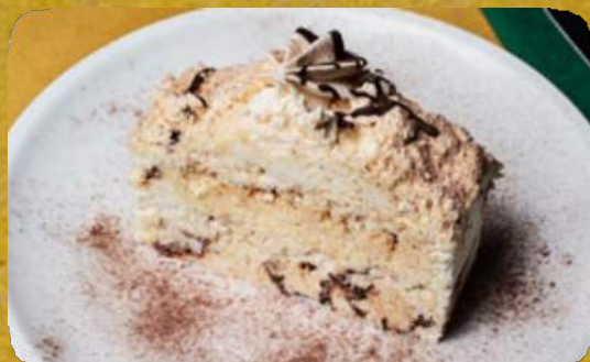
MERINGATA ARTIGIANALE - (* MILK&CHOCOLAT E