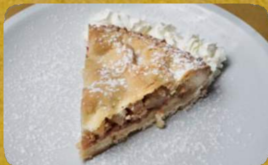
CROSTATA DI PERE ED AMARETTI Homemade cake with