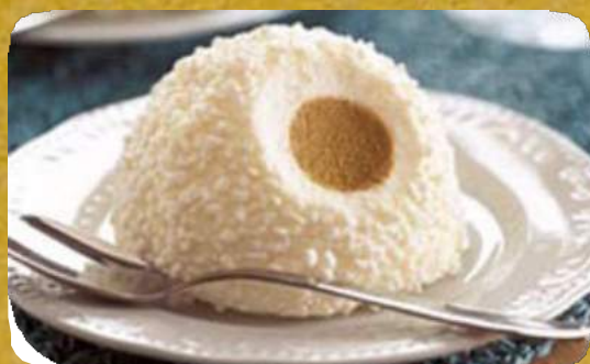
TARTUFO BIANCO/NERO - (* ) (ANCHE AFFOGATO AL