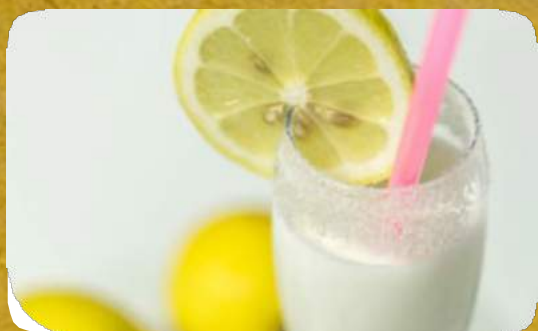
SORBETTO AL LIMONE E PROSECCO - (* )

N.b. Tutte le torte, semifreddi ed eventuali dessert proposti dai nostri