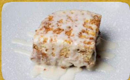
REGALE PATIO semifreddo alla crema con caffè, amaretto e croccante REGALE