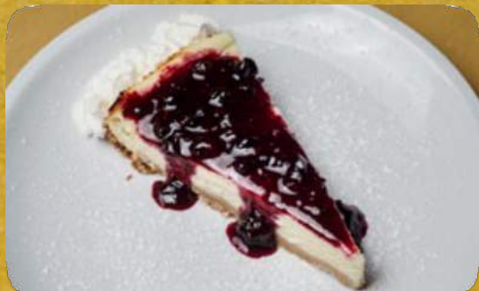
CHEESECAK E con salsa ai frutti di bosco -