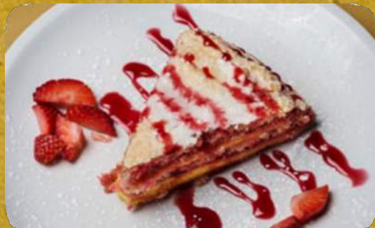
ZUPPA INGLESE HOMEMADE CUSTARD SPECIALTY