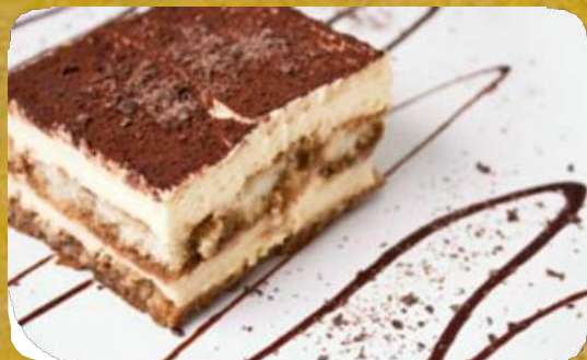
TIRAMISU TIRAMIS U