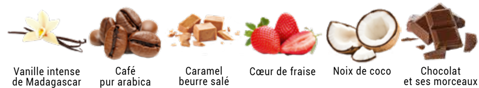
Vanille intense de Madagascar Café pur arabica Caramel beurre salé Cœur de fraise Noix de coco Chocolat et ses morceaux