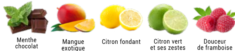
Menthe chocolat Mangue exotique Citron fondant Citron vert et ses zestes Douceur de framboise