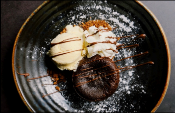
Coulant chocolat € 5.50