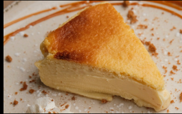
Gâteau au fromage € 5.50