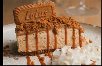
Gâteau au Lotus € 5.50