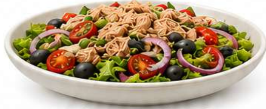
INSALATA TONNO Thunfischsalat Tuna Salad Salata od tune