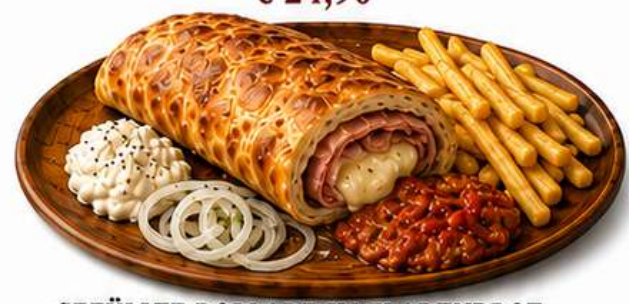
GEFÜLLTE ROLLADE IM FLADENBROT mit Käse, Puten-Schinken und Pommes € 23,90