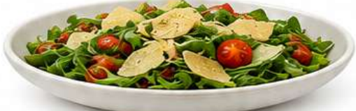
RUCOLA SALAT mit Parmesan Chips und Cherrytomaten Rocket Salad with Parmesan Chips and Cherry Tomatoes Rukola salata sa parmesan čipsom i cherry paradajzom