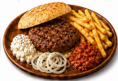
PLJESKAVICA IM FLADENBROT mit Kajmak, Ajvar und Pommes € 18,90