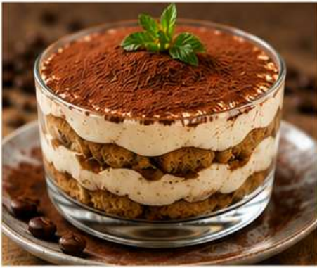
HAUSGEMACHTES TIRAMISU (ohne Alkohol & ohne Ei)