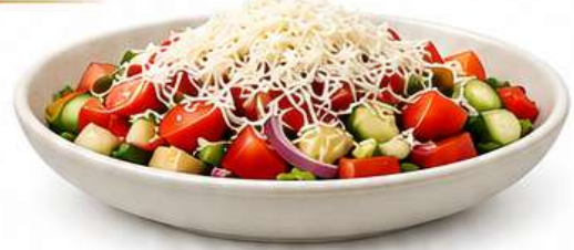
ŠOPSKA SALATA Šopska Salat Shopska Salad Šopska salata