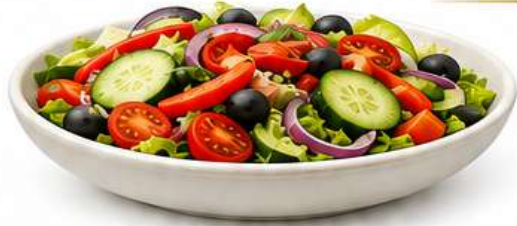
INSALATA MISTA Gemischter Salat Mixed Salad Miješana salata