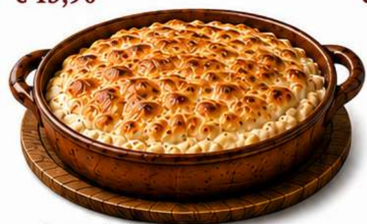
ĆEVAPČIĆI IN KAJMAK im Topf, mit Pizzateig aus dem Pizzaofen € 24,90