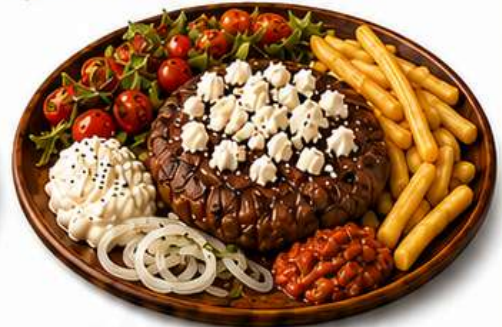
GOURMET PLJESKAVICA mit Schafkäse, Pommes, Salat, Kajmak und Ajvar € 22,90