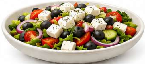
INSALATA GRECA Griechischer Salat Greek Salad Grčka salata