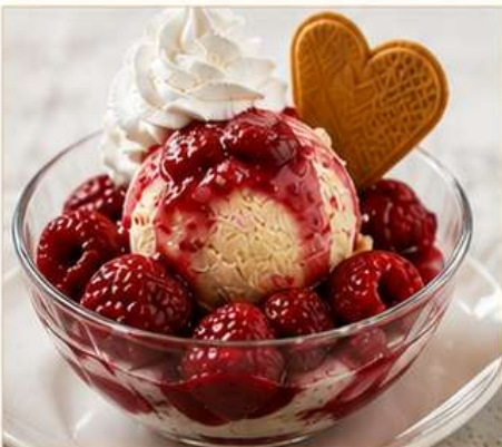
HEIßE LIEBE Vanilleeis mit heißen Himbeeren