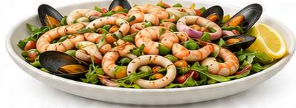
INSALATA FRUTTI DI MARE Meeresfrüchtesalat Seafood Salad Salata od morskih plodova