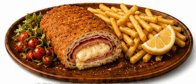
PEPPER ROYAL SCHNITZEL gefülltes Putensteak mit Käse und Puten-Schinken, Pommes € 24,90