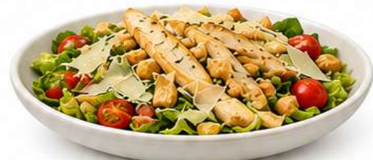
FITNESS SALAT Fitness Salat Fitness Salad Fitness salata