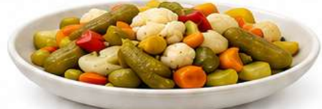
BALKANISCHE TURŠIJA Gemischtes eingelegtes Gemüse Mixed Pickled Vegetables Miješano ukiseljeno povrće