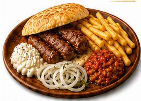
ĆEVAPČIĆI IM FLADENBROT mit Kajmak, Ajvar und Pommes € 15,90