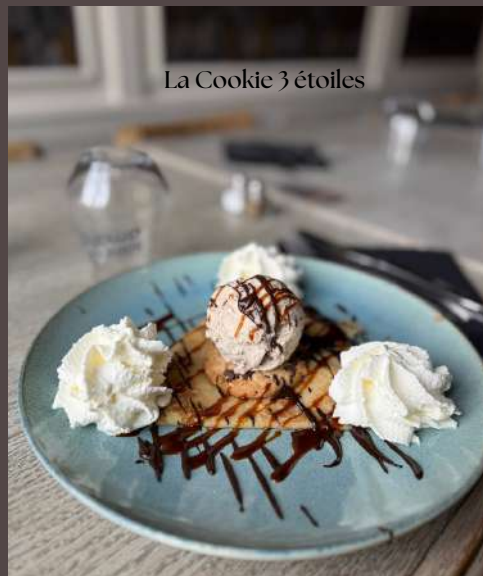
La Cookie 3 étoiles