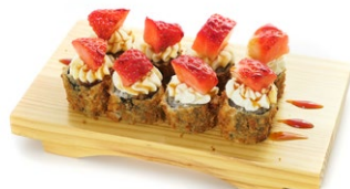
147. Hosom fragola Hosomaki di salmone fritto ricoperto con philadelphia e fragola, teriyaki