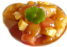
57. Pollo in salsa agrodolce Pollo*, ananas e pomodoro .. 5.00 euro