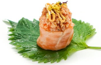
194. Gunkan sake cotto (2pz) Salmone cotto, salmone, salsa teriyaki e philadelphia .. 4.00 euro 🐟 🍷