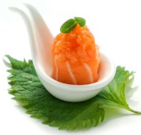
193. Gunkan spicy sake (2pz) 🌶️ Spicy salmon* e tobiko .. 5.50 euro 🐟