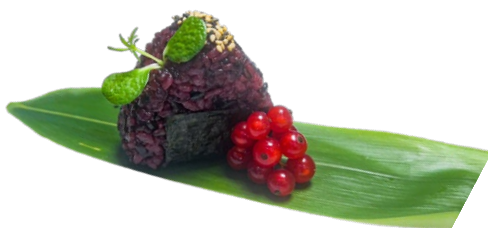
100. Onigiri nero Salmone, pistacchio, salsa rucola