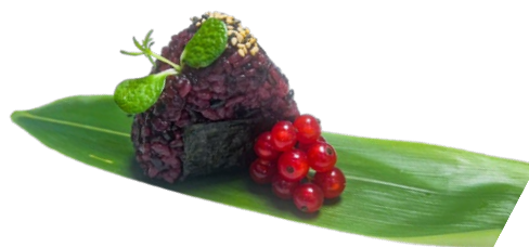
101. Onigiri nero ebi Gamberi* cotto, philadelphia, salsa teriyaky, katai