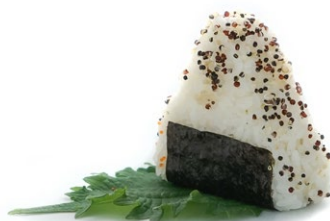
98. Onigiri sake spicy 🌶️ Spicy salmon* e sesamo