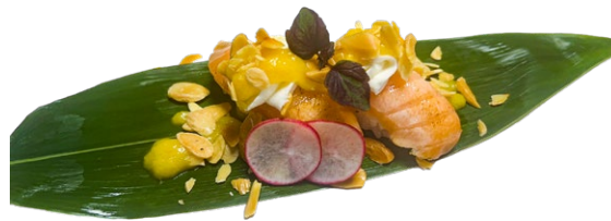
170. Nigiri speciale Salmone scottato, philadelphia, salsa di mango, mandorle .. 3.50 euro 🐟🥛🍷