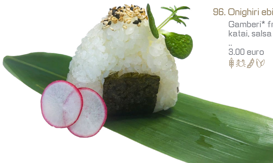
96. Onigiri ebiten Gamberi* fritto, katai, salsa teriyaky