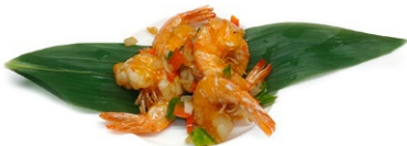
62. Gamberetti sale e pepe Gamberetti*, peperoni, pepe nero e cipolla .. 6.00 euro