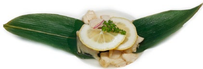
53. Pollo al limone Pollo* e limone .. 5.00 euro