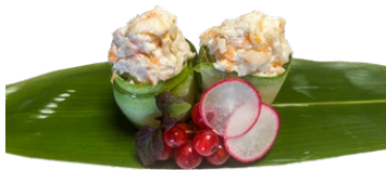
199. Gunkan ebi Cetriolo, gamberi* cotto condito in philadelphia .. 4.00 euro 🍷 🍷