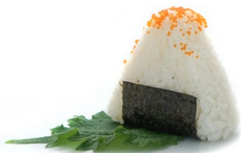
97. Onigiri tobiko Polpa di granchio*, maionese e uova di pesce