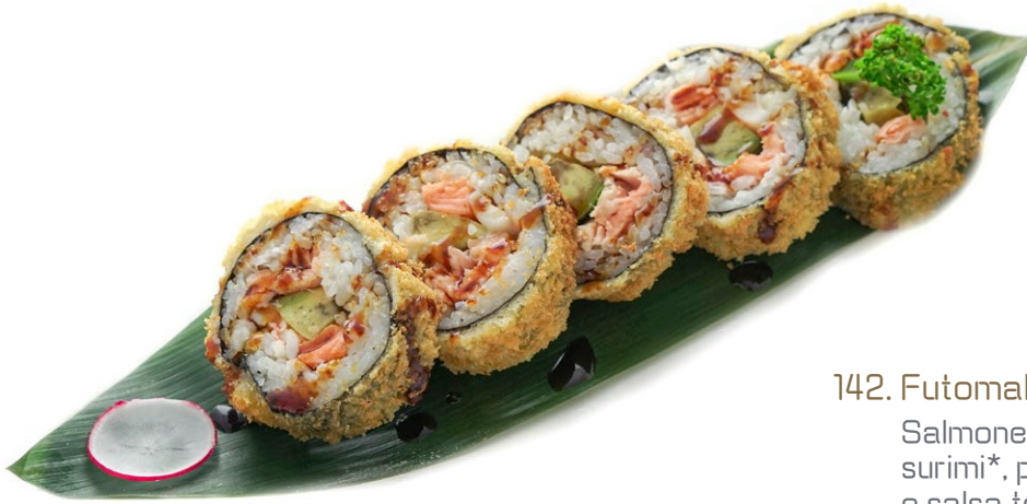
142. Futomaki fritto Salmone* , avocado, surimi* , philadelphia e salsa teriyaki