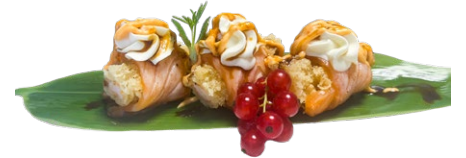
198. Gunkan oi Gamberi* fritto, salmone scottato, philadelphia, maionese piccante, salsa teriyaky .. 6.00 euro 🌾 🍷 🐟 🍷 🍷