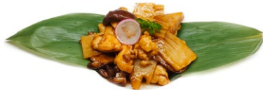
56. Pollo con funghi e bambu' pollo*, funghi e bambu' .. 5.00 euro