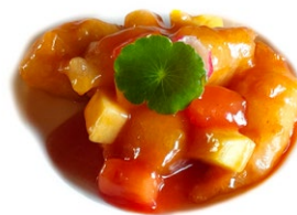
66. Maiale in salsa agrodolce Maiale*, ananas e pomodoro .. 5.00 euro