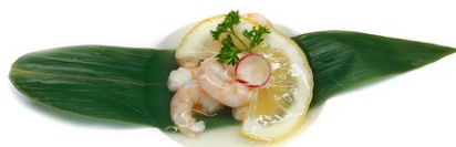
63. Gamberetti al limone Gamberetti* e limone .. 6.00 euro