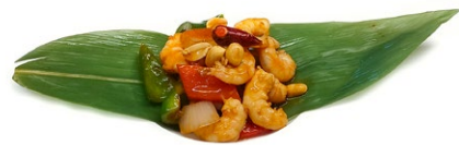
64. Gamberetti piccanti Gamberetti*, peperoni, arachidi e cipolla .. 6.00 euro