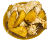
58. Pollo patate Pollo, patate fritto .. 5.00 euro