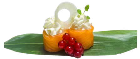
195. Gunkan phila sake Philadelphia, salmone .. 3.00 euro 🐟 🍷