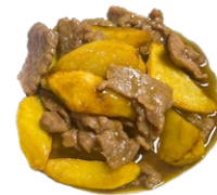
61. Manzo patate Manzo, patate fritto .. 6.00 euro