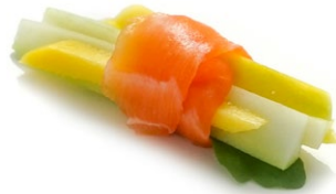
197. Gunkan mango (2pz) Mango, salmone* scottato, salsa ponzu e uova* di pesce .. 4.00 euro 🐟 🍷