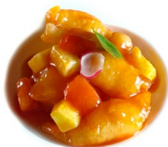
65. Gamberi in salsa agrodolce Gamberi*, ananas e pomodoro .. 6.00 euro