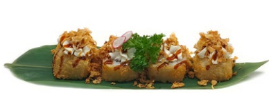
143. Uramaki fritto Tonno* cotto, maionese, philadelphia, cipolla fritto e salsa teriyaki