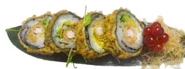
145. Futomaki dragon Gamberi* fritto, avocado, maionese, katai, salsa teriyaky