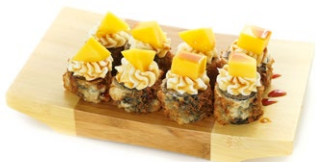
146. Hosomango Hosomaki di salmone fritto ricoperto con philadelphia e mango, teriyaki