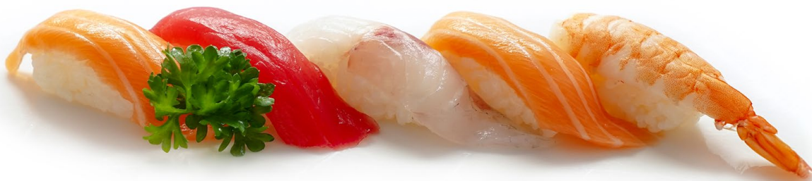
171. Sushi momo 5pz Salmone*, surimi*, tonno* e avocado .. 8.00 euro 🐟🍣🍣