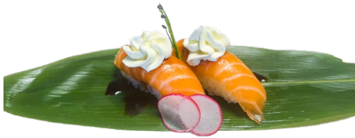
169. Nigiri neve Salmone, philadelphia, salsa teriyaky .. 3.50 euro 🐟🥛🍴