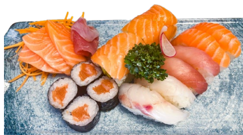
173. Combo 6pz nighiri mix, 4pz roll, 4pz hoso, 6pz sashimi .. 15.00 euro 🐟