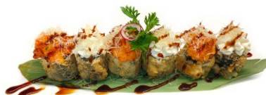
144. Hosomaki fritto 🌶️ Spicy salmone* , surimi* , philadelphia e salsa teriyaki