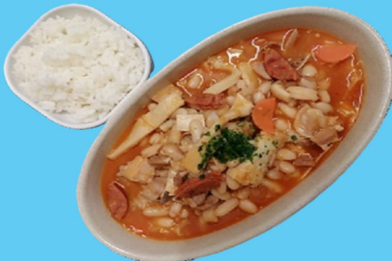
Tripas à moda do Porto

Desconto de 1,00€ num sobremesa à escolha