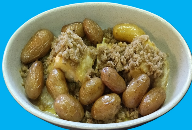
Bacalhau com Broa

Desconto de 1,00€ num sobremesa à escolha