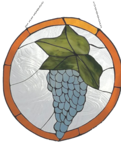
Bleiglasfenster Bodo Buhse