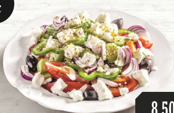
Griechischer Bauernsalat 16,5