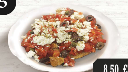
Eine verbreitete kretische Vorspeise aus Tomaten, Kräutern und Feta Käse auf griechischer Zwieback 16