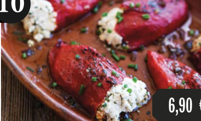
Marinierte rote Paprika Feta-Käse gefüllt 10,16