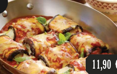
Auberginenröllchen mit einer Füllung aus Käse, Prosciutto & Tomatensauce 16