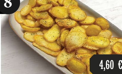
Frittierte Kartoffeln auf griechische Art 1