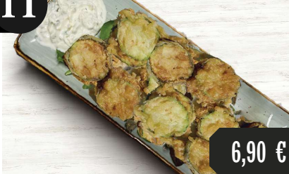
Frittierte Zucchini mit Tzatziki auf griechische Art 1,6,16