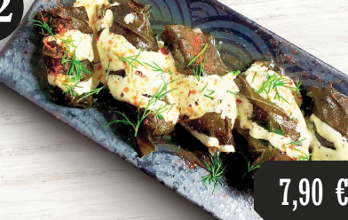
Gefüllte Weinblätter mit Hackfleisch, Reis, Pinienkernen und Zitronensauce 16