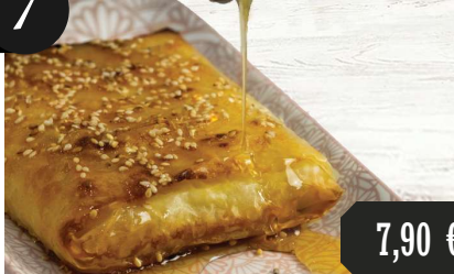
Feta-Käse frittiert mit Sesam und Honig 10,16