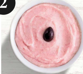
Fischrogen-Paste aus Griechenland