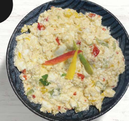
Pikante Scharfskäsecreme 16