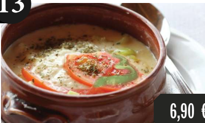
Feta-Käse, Gouda-Käse, frische Tomaten, scharfe Paprika in Olivenöl und Oregano aus Peloponnes 16