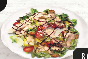
Eisberg, Olivenöl, Paprika, Croutons, Parmesankäse und hausgemachte Soße 16