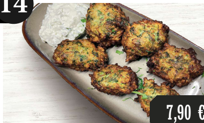
Zuccinipuffer mit Tzatziki auf griechische Art 16