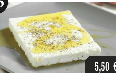
Feta Käse mit Oregano und Olivenöl aus unserer Heimat