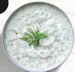
Griechischer Joghurtcreme 16