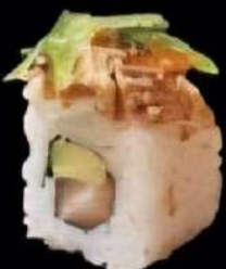
Alaska Salmon, aguacate, Puyoyo, sesame, webano y tobiko 4x 6'00e