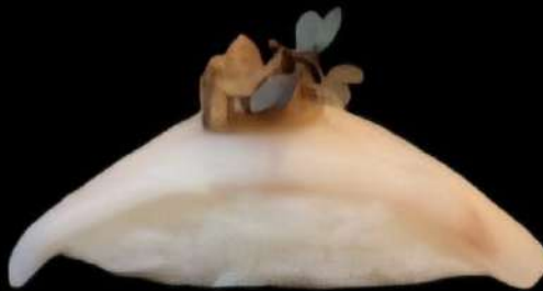
Pez Mantecquilla y trufa 2x 4'20