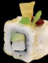
Tex Palo al horno, aguacate, Puyoyo, crujiente de lites y salsa chepalla 4x 6'00e