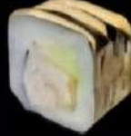
Langostinos 4x 4'70e