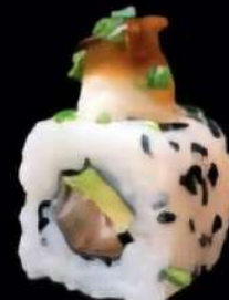
Salmon Trufado Salmon, Aguacate, un toque de queso Puyoyo con trufa negra y cebolla caramelizada 4x 6'00