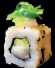
Puyoyo Butter Fresca mantequilla, aguacate, pepino, queso Puyoyo, un toque de algo webano y cobertura de furikake 4x 5'80e