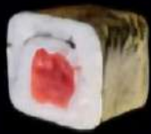
Atun Rojo Almadraba 4x 520e