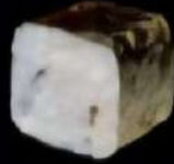
Pez Mantequilla con trufa 4x 5'00e