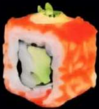
California Tonta, aguacate, cubierto de tobiko y nopo urimaha 4x 5'00e