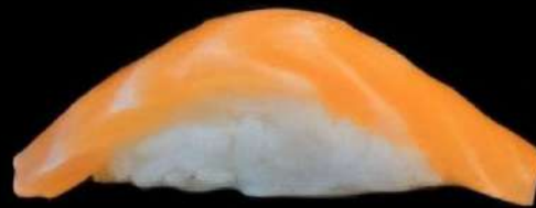
Salmon 2x 4'00