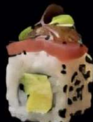
Tuna Mango Mango, aguacate, sesame, cubierto de atun rojo, mermelada de tomate y cebollito caramelizado 4x 6'00e