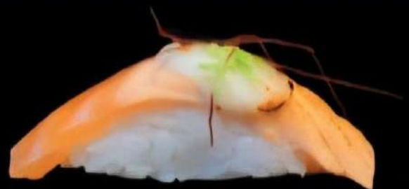
Salmon Payoyo 2x 4'90