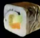
Vegetal 4x 4'70e