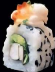
Chicken Spicy Palo al horno, fresca aguacate, un toque de queso fresco y langostinos, chili dulce y cebollitas 4x 6'00