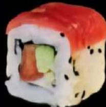
Puyoyo Aguacate, fresco Puyoyo, cubierto de atun y salsa teriyaki 4x 6'20e