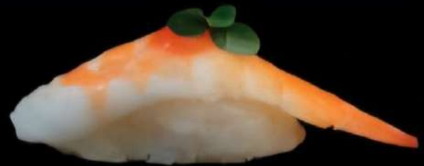
Langostino y sweet chili 2x 4'20