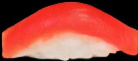
Atun Rojo de Almadraba 2x 4'90