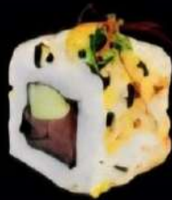
Red Tuna Atun, aguacate, furikake y salsa curry mayo 4x 6'00e