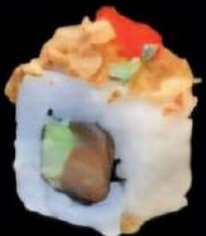
Salmon Crunch Salmon, aguacate, cebolla crujiente, mayo kincha y tobiko 4x 5'90e