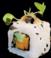
Vegano Aguacate, zanahoria, trufa, espárragos y limo hierbas 4x 5'20e