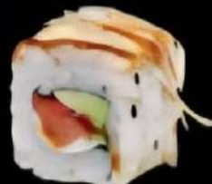
Salmon Tira Aguacate, fresco, phixadepin, cubierto de salmón broseta y mayo kincha 4x 6'00e