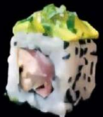
Serranito Palo al horno, Jaron Serrano con cobertura de aguacate y mermelada de espárragos 4x 6'00