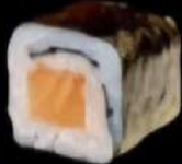
Salmon 4x 5'00e