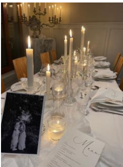
Beispieltisch, aber mehr Vasen mit Füllung

Deko Beispiel 3: „Boho“ mit frischen Blumen in Weiß, creme & fluffige Trockenblumen/Gräser dazu. Nur Glas Vasen & Glasleuchter, Blüten: weiße Pfingstrosen, Dahlien, Chrysanthemen, Rosen, Astilben, Pampasgras...nach saisonaler Verfügbarkeit