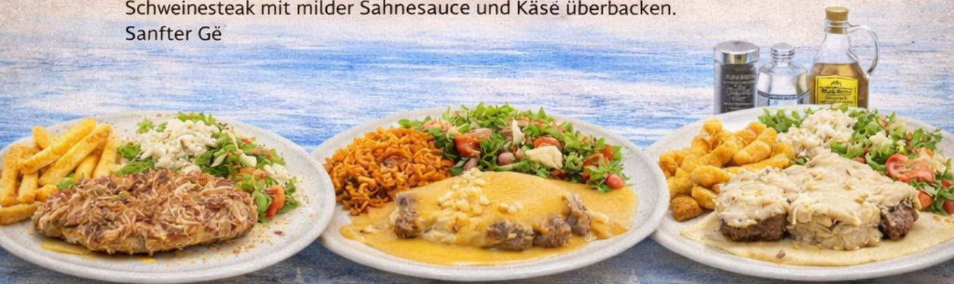
36. Gegrilltes Schweinesteak

Schweinesteak mit milder Sahnesauce und Käse überbacken. Sanfter Gë