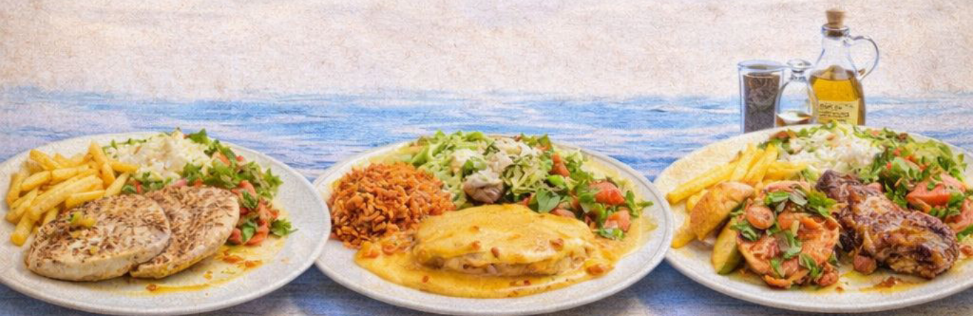
33. Hähnchenbrust vom Grill

Hähnchenfilet mit Tomaten und mediterranen Kräutern. Leicht, aromatisch und typlick süddländsch.