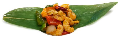
64. Gamberetti "gongbao" piccanti 🌶️ Gamberetti*, peperoni, arachidi e cipolla .. 6.00 euro 🍴 🍴