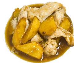
76. Pollo patate Pollo, patate fritto