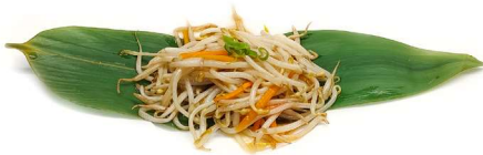
74. Germogli di soia saltati Germoglio di soia, carote e cipollina