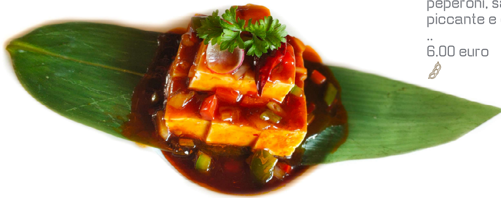
73. Tofu mapo 🌶️ Tofu, carne*, peperoni, salsa piccante e cipolla