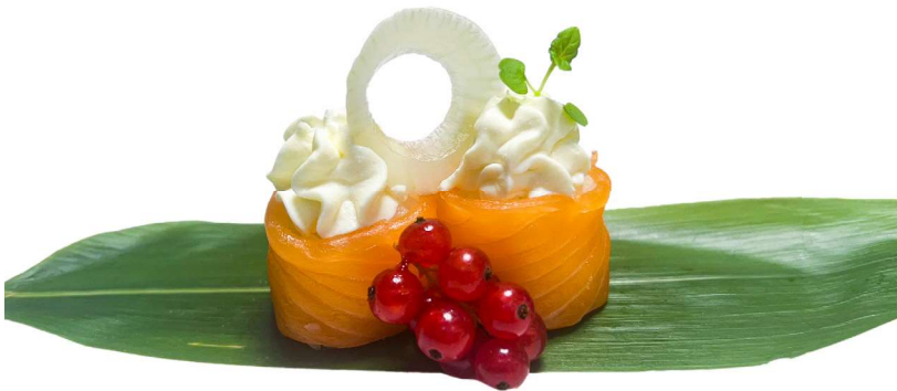
202. Bigne phila sake (2pz) Philadelphia, salmone .. 4.00 euro 🐟🍷