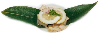
56. Pollo al limone Pollo* e limone .. 5.00 euro