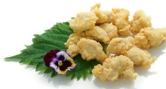
18. Pollo fritto Pollo* .. 4.00 euro 🌿