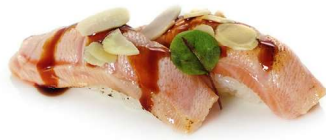
174. Nigiri salmone flambe' Riso con salmone scottato guarnito con salsa miso, teriyaki e pistacchio