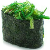
195. Gunkan wakame (2pz) Alghe* giapponesi .. 3.00 euro