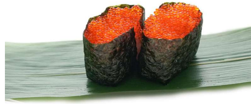
197. Gunkan tobiko (2pz) Uova* di pesce volante .. 3.00 euro 🐟