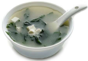
9. Zuppa di miso Zuppa con miso, tofu e alghe .. 2.50 euro 🌿