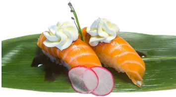
173. Nigiri phila salmone Salmone, philadelphia