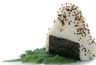
97. Onigiri sake spicy 🌶️ Spicy salmon* e sesamo