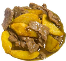
77. Manzo patate Manzo, patate fritto