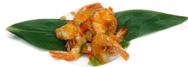
62. Gamberetti sale e pepe Gamberetti*, peperoni, pepe nero e cipolla .. 6.00 euro 🍴