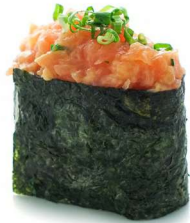
196. Gunkan sake (2pz) Salmone* .. 3.00 euro 🐟