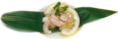
63. Gamberetti al limone Gamberetti* e limone .. 6.00 euro 🍴