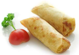
12. Involcini primavera (2pz) Verdura .. 3.00 euro 🌿