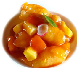
67. Gamberi in salsa agrodolce Gamberi*, ananas e pomodoro .. 6.00 euro 🍴