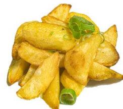
19. Patate sale pepe Patate fritto, erba cipollina .. 4.00 euro 🌿