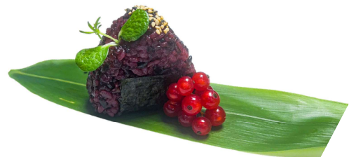
100. Onighiri nero ebi Gamberi* cotto, philadelphia, salsa teriyaky, katai