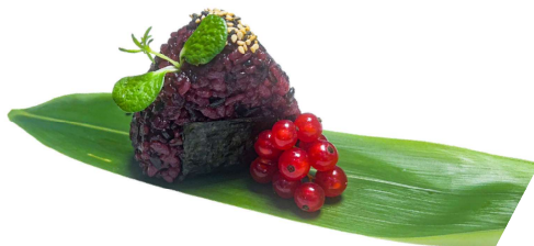
99. Onighiri nero Salmone, pistacchio, salsa rucola