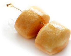
15. Pane fritto (2pz) Farina di grano .. 3.00 euro 🌿