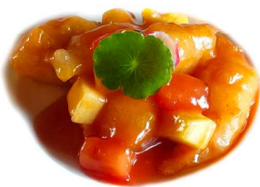
66. Maiale in salsa agrodolce Maiale*, ananas e pomodoro .. 5.00 euro