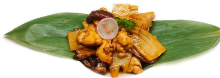
75. Pollo con funghi e bambu' pollo*, funghi e bambu'