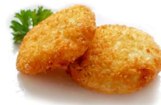
16. Korokke (3pz) patate e cipolla .. 3.50 euro 🍳 🌿