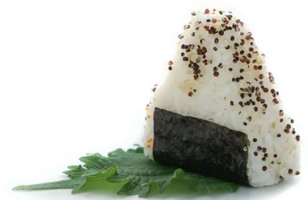
98. Onigiri sake cotto Salmone* cotto, philadelphia e sesamo