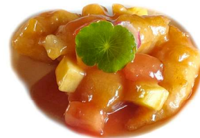
65. Pollo in salsa agrodolce Pollo*, ananas e pomodoro .. 5.00 euro