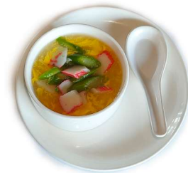
11. Zuppa di granchio Granchio*, asparagi e uovo .. 3.50 euro 🍳 🍷 🌿