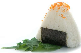
96. Onighiri tobiko Polpa di granchio*, maionese e uova di pesce