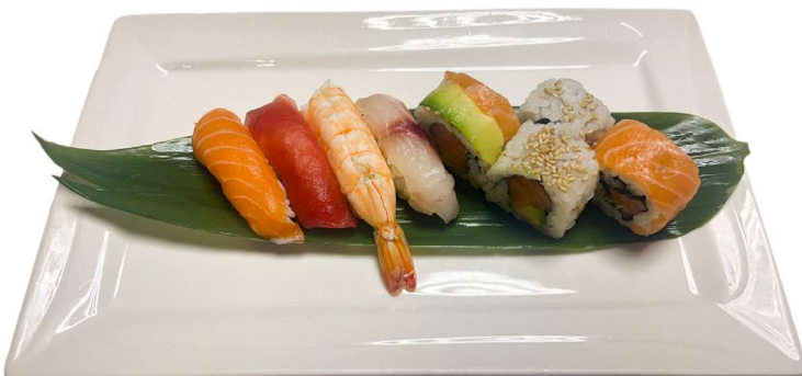
178. Sushi combo 4pz nighiri, 4pz uramaki