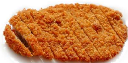
17. Tonkasu Cotoletta di maiale* .. 5.00 euro 🌿