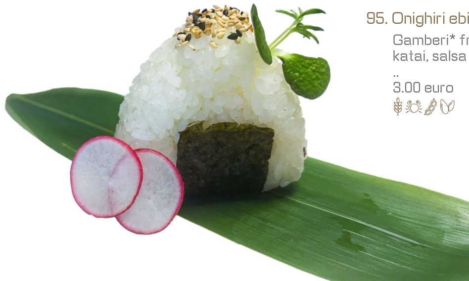
95. Onighiri ebiten Gamberi* fritto, katai, salsa teriyaky