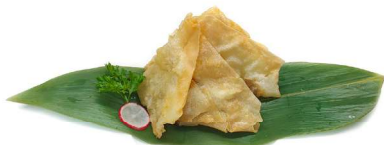
21. Wanton fritto (2pz) Carne*, gamberi* e pesce* .. 4.00 euro 🍷 🐟 🌿