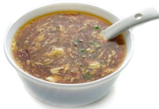
10. Zuppa agropiccante 🌶️ Zuppa con funghi, bambu', granchio*, verdura mista e uovo .. 3.50 euro 🍳 🌿