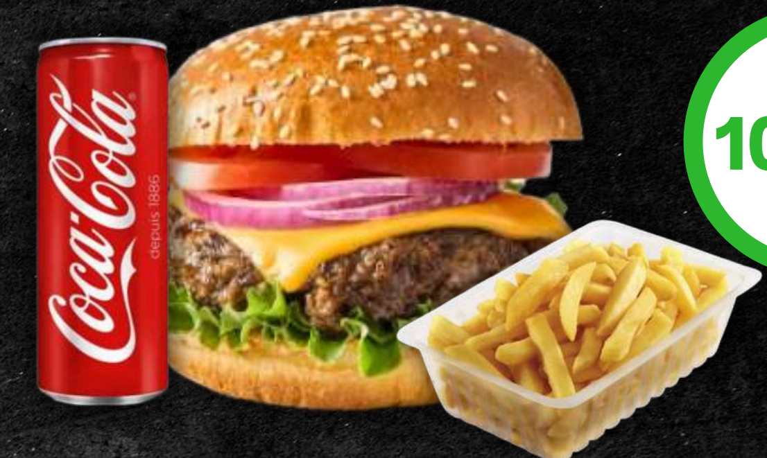
1 Steak 100gr Frites + boisson 33cl