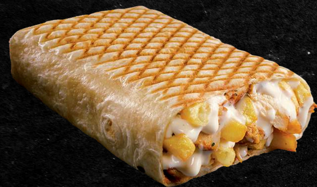
Frites dans le Tacos