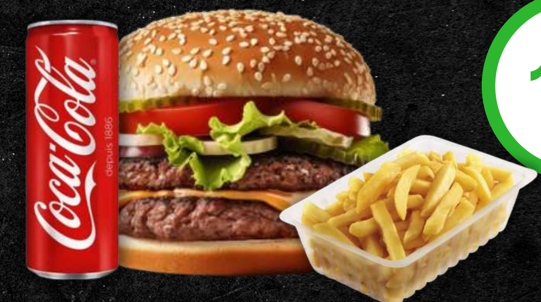
2 Steaks 100gr Frites + boisson 33cl