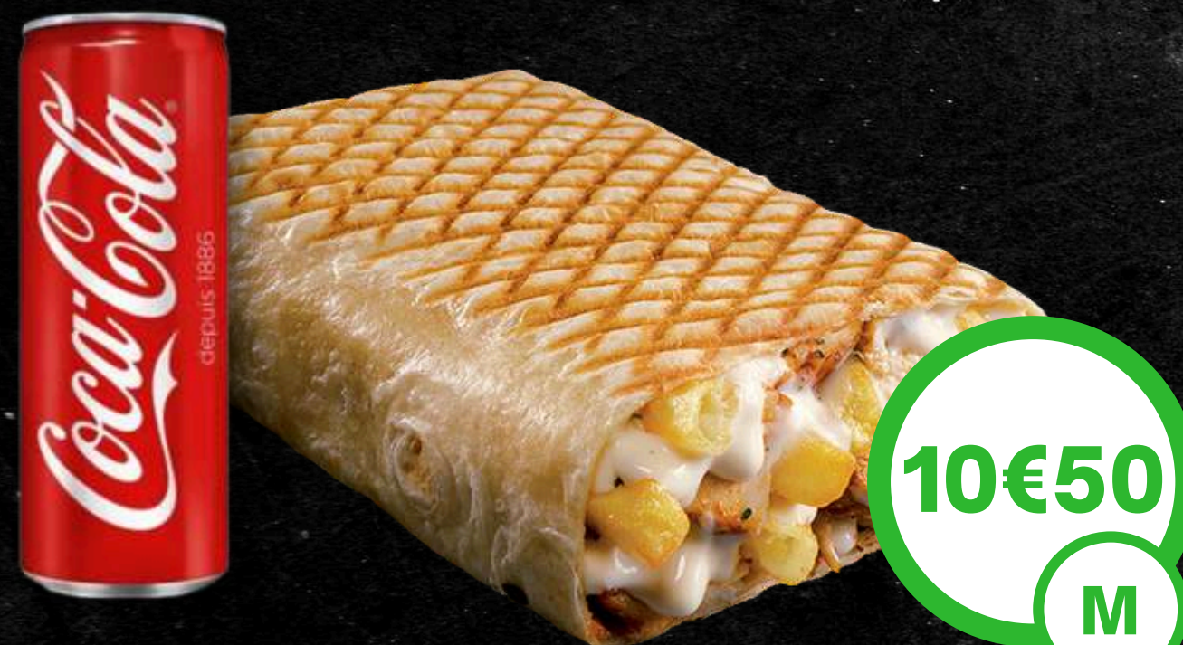
Frites dans le Tacos