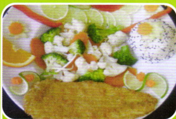
Rotbarschfilet gebacken baked redfish 7,90€