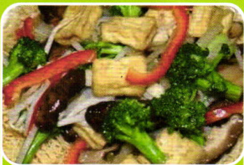
Zarte Tofu delicate tofu 6,90€