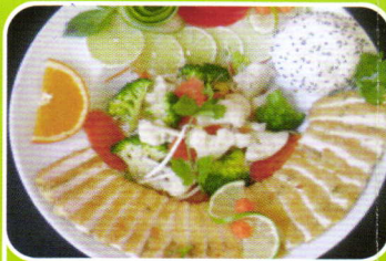
Hühnerbrustfilet gebacken baked chicken 7,50€