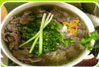
Rindfleisch (Hühnerfleisch) Reisbandnudeln Suppe noodle soup with beef(chicken) 7,50€