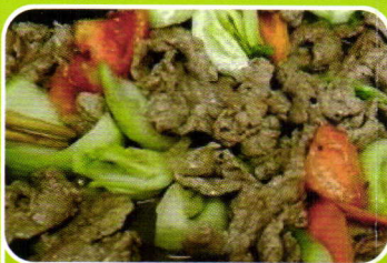
Rindfleisch gebraten, würzig spicy roast beef 7,50€