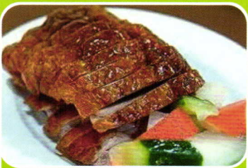
Ente kross crispy Duck 7,90€