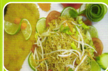
Kinder-Menü mit Nudeln, Huhn oder Entenfleisch Kids-menu noodles, chicken or duck 5,90€