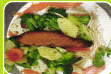
Lachs pikant geschmort spicy stewed salmon 7,90€