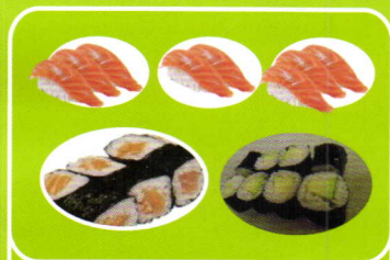
Menü2: 8x Maki Lachs 8x Maki Avocado 8x Nigiri Lachs 12,90 - 9,90€