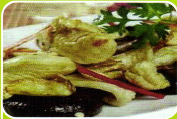
Hühnerfleisch pikant geschmort spicy stewed chicken 6,90€