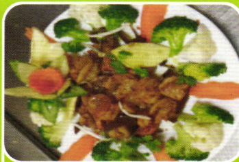
Garnelen pikant geschmort spicy stewed shrimps 7,90€